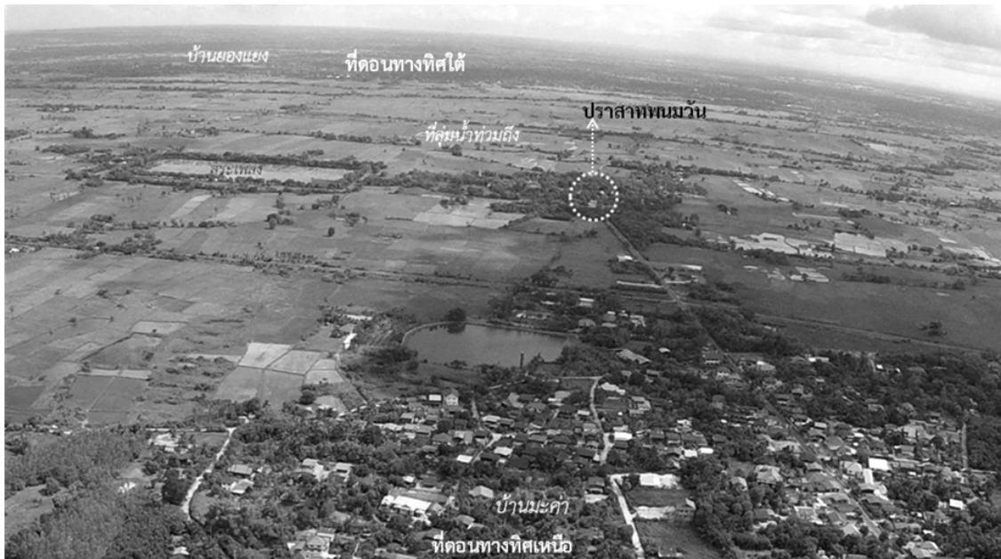
ภาพที่ 1 สภาพแวดล้อมโดยรอบปราสาทพนมวันที่มีลักษณะภูมิทัศน์วัฒนธรรมของพื้นที่ประวัติศาสตร์แบบพื้นถิ่น

และได้ห่างออกไป 1-5 กิโลเมตร เงื่อนไขทางธรรมชาติดังกล่าวทำให้เกิดลักษณะภูมิทัศน์วัฒนธรรมของพื้นที่ทางประวัติศาสตร์แบบพื้นถิ่น (Historic Vernacular Landscape) (เกรียงไกร เกิดศิริ 2551, 26) กล่าวคือชุมชนตั้งถิ่นฐานบ้านเรือนบนที่ดอนเว้นระยะห่างจากปราสาทซึ่งอยู่ในที่ลุ่ม แสดงให้เห็นถึงคุณค่าและทัศนคติของผู้คนในท้องถิ่นที่มีต่อพื้นที่ สะท้อนให้เห็นถึงรูปแบบการตั้งถิ่นฐานและการใช้สอยพื้นที่ของคนที่มีพัฒนาการเรื่อยมา ทำให้ชุมชนรอบปราสาทยังคงมีสภาพแวดล้อมที่ไม่เปลี่ยนแปลงไปมากนัก ซึ่งเป็นโจทย์ที่ท้าทายว่า ทำอย่างไรจะรักษาลักษณะดังกล่าวไว้ให้ได้มากที่สุด