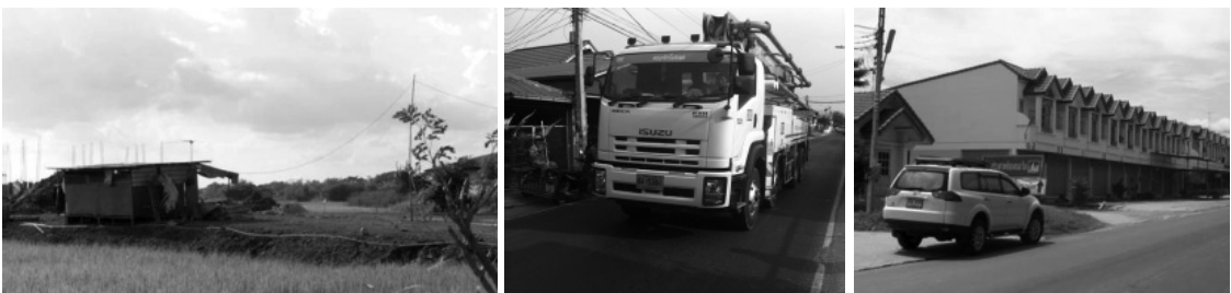
ภาพที่ 4 ปัญหาความไม่เข้าใจในแนวทางการอนุรักษ์และพัฒนา

การอนุรักษ์ที่ผ่านมาในอดีตมักดำเนินการโดยนักวิชาการและผู้เชี่ยวชาญเฉพาะทาง ซึ่งมุ่งเน้นการดำรงรักษาแหล่งมรดกเป็นสำคัญจนบางครั้งขาดการให้ความสำคัญกับการมีส่วนร่วมกับประชาชนและภาคส่วนต่างๆ หลายหน่วยงานที่มีส่วนเกี่ยวข้องกับการอนุรักษ์ เช่น กรมศิลปากร หน่วยงานที่เกี่ยวข้องระดับจังหวัด สถาบันการศึกษา ชาติการจัดทำแผนงานโครงการที่ชัดเจนในการสร้างจิตสำนึกให้ประชาชนหรือเยาวชนเกิดการมีส่วนร่วมในการอนุรักษ์สิ่งแวดล้อมศิลปกรรม ส่งผลให้ประชาชนเกิดความไม่เข้าใจในบทบาทการทำงานของหน่วยงานที่รับผิดชอบ เป็นอุปสรรคต่อการอนุรักษ์ที่ผ่านมา จำเป็นที่ทั้งภาครัฐและภาคประชาชนต้องสนับสนุน