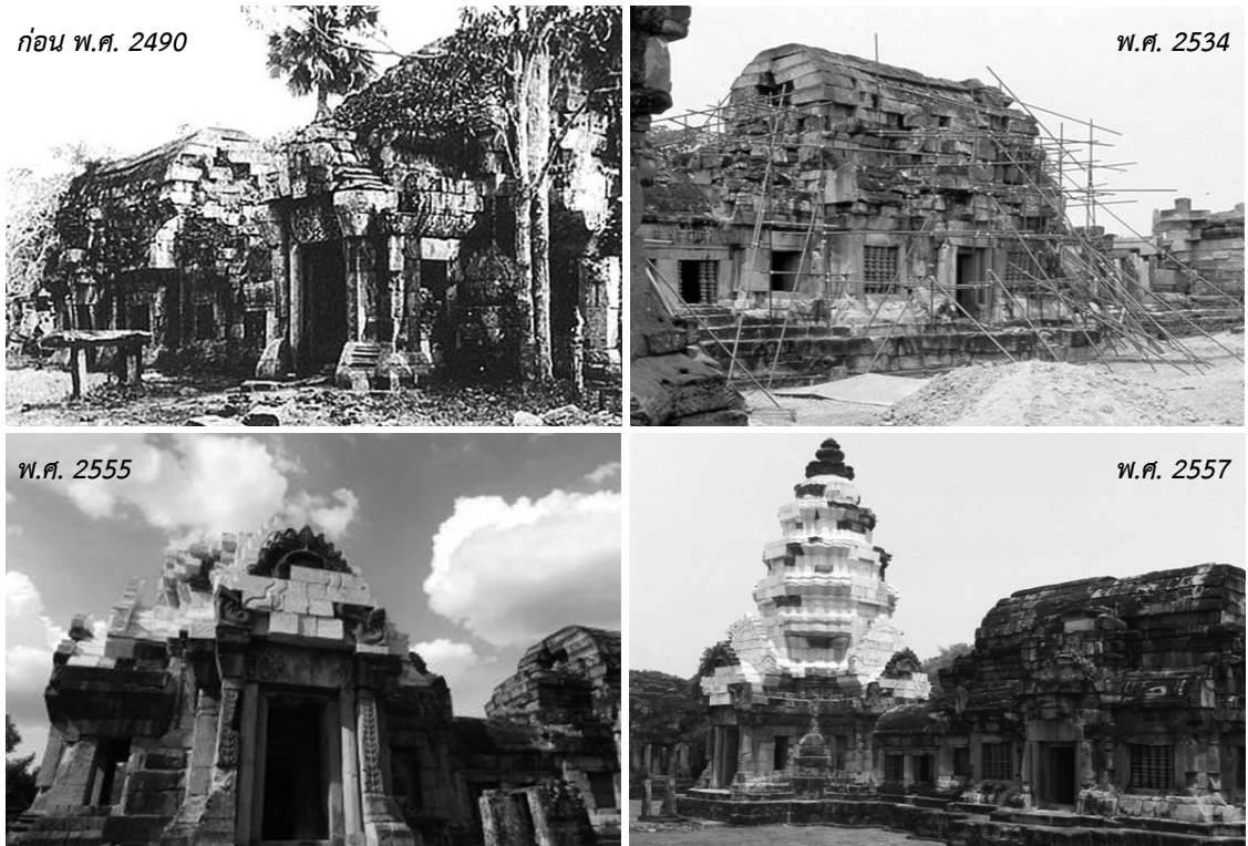
ภาพที่ 3 พัฒนาการการอนุรักษ์ปราสาทพนมวันตั้งแต่ก่อนปี พ.ศ. 2490-2557