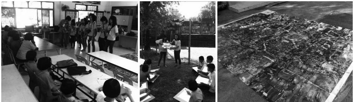
ภาพที่ 9 กิจกรรมปลูกจิตสำนึกด้านการอนุรักษ์แก่เยาวชน ในวันที่ 1 ธันวาคม พ.ศ. 2555

คุณค่าของชุมชนร่วมกัน และแบ่งกลุ่มเพื่อทำแผนที่ สินทรัพย์ในชุมชน เพื่อสร้างทัศนคติที่ดีต่องานและ เป็นการทำความรู้จักกับพื้นที่ให้มากขึ้นของคณะทำงาน ซึ่งเป็นคนจากภายนอก ทำให้ทราบถึงทุนทางสังคมและ มรดกทางวัฒนธรรมที่มีในชุมชน อันจะนำไปสู่การ วางแผนอนุรักษ์ที่มาจากความคิดของประชาชน สิ่ง สำคัญที่ต้องค้นหาคือ “คนใน” ซึ่งเป็นคนในท้องถิ่นที่มี ศักยภาพที่จะนำไปสู่การประสานงานเชื่อมโยงความร่วม มือกับผู้อื่นในชุมชน (ศรีศักร วัลลิโภดม 2555, 8) ในกรณี ของโครงการนี้มีหลายท่าน เช่น กำนัน ครู พระสงฆ์ ข้าราชการที่เป็นคนในท้องถิ่น ผู้บริหารเทศบาล เป็นต้น ซึ่งจะเป็นกลไกสำคัญในการดำเนินงานหลังจากระยะเวลา เวลาการศึกษาแล้วเสร็จ