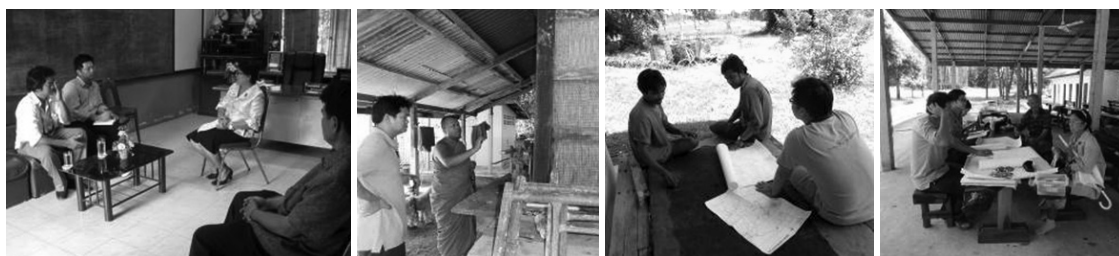
ภาพที่ 7 การประชุมกลุ่มย่อยกับครู พระสงฆ์ ผู้อาวุโส กลุ่มต่างๆในพื้นที่ในหลายโอกาส