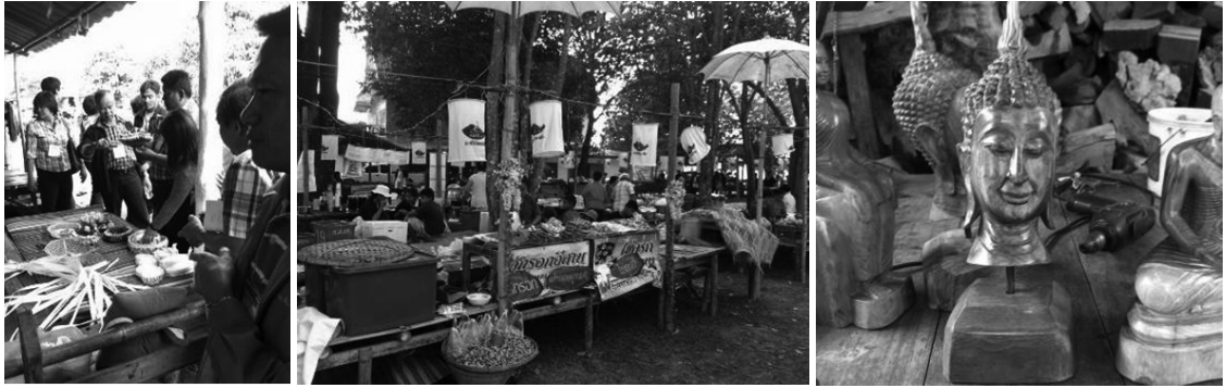
ภาพที่ 8 การศึกษาดูงานที่ชุมชนโดยรอบอุทยานประวัติศาสตร์สุโขทัย ในระหว่างวันที่ 7-9 ธันวาคม พ.ศ. 2555