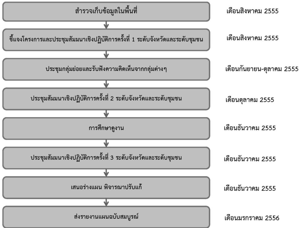
ภาพที่ 5 แผนผังแสดงขั้นตอนการดำเนินงานด้านการมีส่วนร่วม

ประชาชนมากที่สุด เนื่องจาก 1) ประชาชนได้เรียนรู้เมื่อได้เข้าร่วม ได้รับทราบข้อมูล ได้รับการอธิบายเหตุผล ทำให้มองเห็นและเข้าใจได้ดีกว่าเดิม 2) ประชาชนได้รับการพัฒนา เมื่อได้เรียนรู้ ผลที่ตามมาคือประชาชนพัฒนาและเปลี่ยนแปลง มีความรู้สึกรับผิดชอบร่วม และเริ่มเกิดความร่วมมือในการทำงาน 3) ให้ความสำคัญกับคนเป็นศูนย์กลางของการพัฒนา เป็นการให้ความสำคัญกับการพัฒนาระดับท้องถิ่นบนพื้นฐานของประชาธิปไตยแบบมีส่วนร่วม ซึ่งจะช่วยให้ภาคประชาสังคมมีความเข้มแข็งมากขึ้น (ชินรัตน์ สมสืบ 2547, 182-183) อันจะนำไปสู่การสร้างสำนึกรักถิ่นของตน