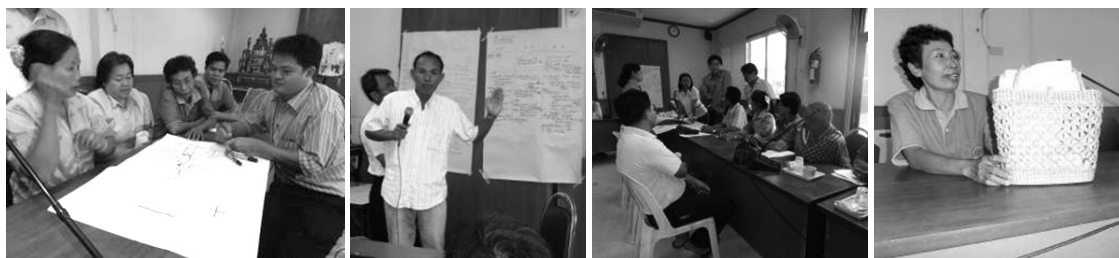
ภาพที่ 6 การค้นหาสินทรัพย์ของดีมีคุณค่าในชุมชนในวันที่ 22 สิงหาคม พ.ศ. 2555

การสร้างทัศนคติด้านบวกในการทำงานเป็นปัจจัยสำคัญเพื่อให้เกิดความร่วมมือที่ดี (อุทัยวรรณ กาญจนกามล (ม.ป.ป.) โดยในการประชุมรับฟังความคิดเห็นครั้งที่ 1 คณะทำงานได้ให้ชุมชนนำเสนอสิ่งที่เห็นข้อดี สิ่งที่มี