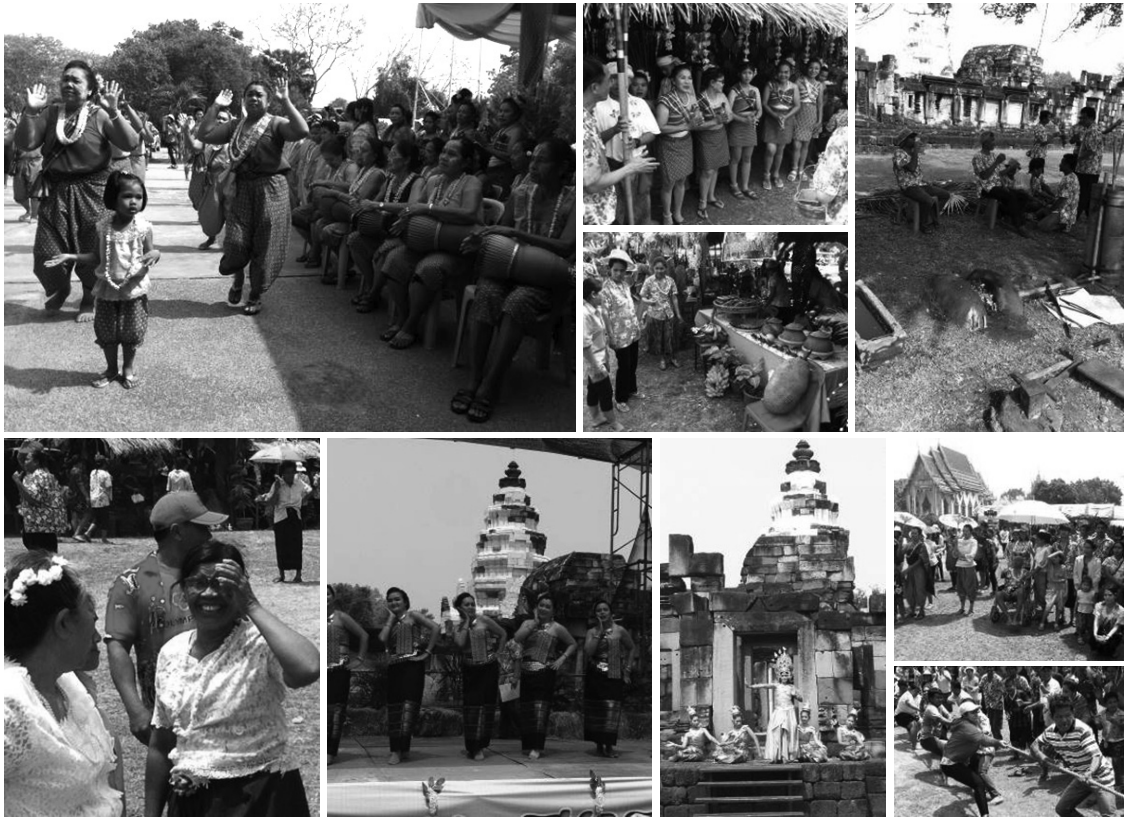
ภาพที่ 10 กิจกรรมสงกรานต์ย้อนยุคที่ปราสาทพนมวัน (เมษายน พ.ศ. 2557) เป็นกิจกรรมนำร่องที่แต่ละหมู่บ้านร่วมแรงร่วมใจกันเพื่อรื้อฟื้นวัฒนธรรมอันดีของตนและถือเป็นผลพลอยได้จากกระบวนการสร้างการมีส่วนร่วมที่ผ่านมามีมา : คณะสถาปัตยกรรมศาสตร์ ผังเมืองและนฤมิตศิลป์ มหาวิทยาลัยมหาสารคาม 2556

อัตลักษณ์ การประสานงบประมาณจากหน่วยงานและองค์กรท้องถิ่นและการประชาสัมพันธ์เพื่อให้ชุมชนเป็นที่รู้จักมากขึ้น