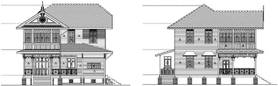
ภาพที่ 3 กระบวนการสำรวจรังวัดและบันทึกสภาพบ้านพระศรีสาคร ที่มา : ณัฐวุฒิ อัครวิทวงศ์และคนอื่นๆ