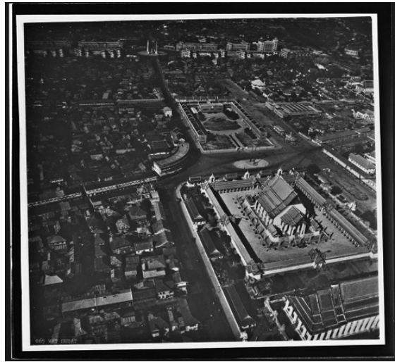
ภาพที่ 2 ชุมชนหลังวัดราชนัดดาในราว พ.ศ. 2483