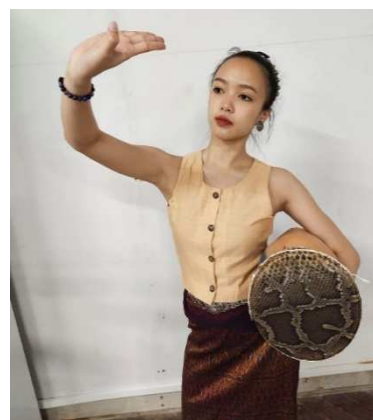
ภาพที่ 3 ท่ายุงรำแพน