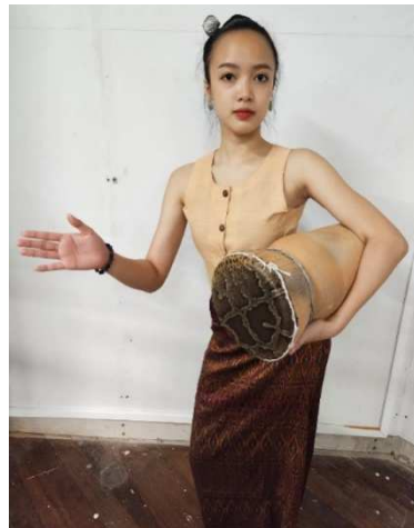
ภาพที่ 2 ท่าตีกลองกินเหล้า