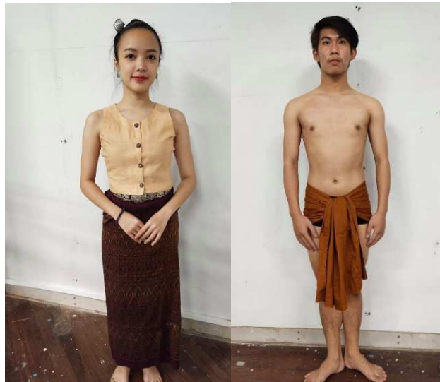
ภาพที่ 4 การแต่งกายนักแสดงหญิงและนักแสดงชาย

5.4) เครื่องแต่งกายได้นำการนุ่งผ้าของชาวชัยภูมิมาประยุกต์ให้เข้ากับการแสดง โดยการนุ่งผ้าถุงกรอมเท้าตามแบบฉบับของชาวบ้าน และการออกแบบเสื้อจะเป็นแขนกุดสีพื้น โดยออกแบบมาจากการสวมใส่เสื้อผ้าที่สบายตัว สอดคล้องกับการเคลื่อนไหวร่างกายโดยจะใช้สีที่ย้อมจากเปลือกไม้ เครื่องประดับ ผู้วิจัยได้นำเอาเครื่องประดับเงินมาเป็นเครื่องประดับส่วนทรงผม ผู้วิจัยได้เลือกทำผมแบบเกล้ามวยสูงแบบที่นิยมของชาวอีสาน และปักปิ่นเงินนักแสดงชาย นุ่งผ้าฝืนเดี่ยว คล้ายการนุ่งผ้าเดี่ยวของชาวอีสาน