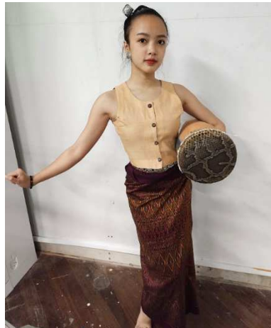
ภาพที่ 1 ท่ากายจับอู่