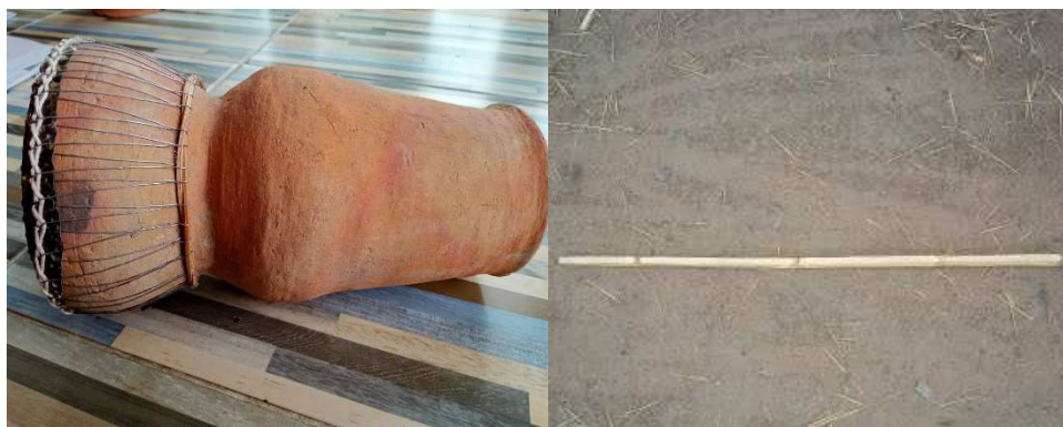
ภาพที่ 5 กลองโตนและไม้ไผ่

5.6) ดนตรีที่ใช้ประกอบในการแสดงได้มีการออกแบบให้ใช้เสียงกลองโตนเป็นหลัก โดยใช้จังหวะกระสวนของบ้านเขว้าและจังหวะจากการตีกลองของผู้แสดงซึ่งสื่อความหมายให้อาณัติสัญญาณในการมารวมตัวกันของชาวบ้าน