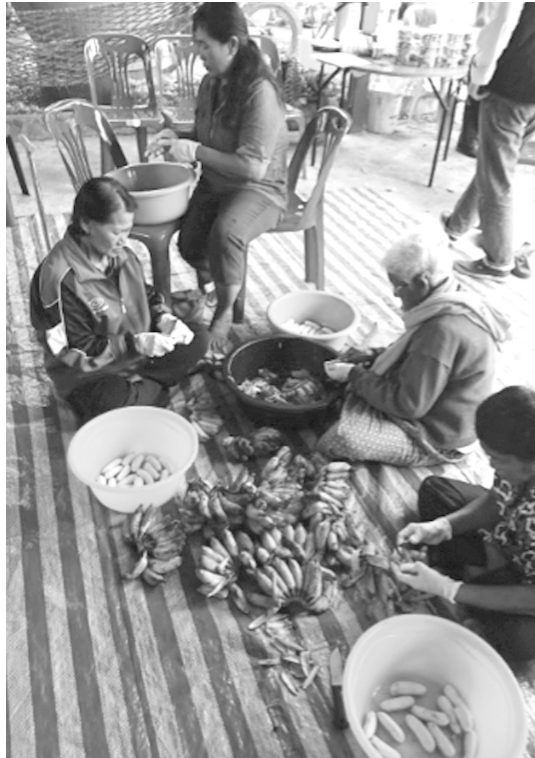
ภาพที่ 1 สมาชิกกล้วยตากชุมชนหนองปลาไหล ตำบลท่าดินดำ อำเภอชัยบาดาล จังหวัดลพบุรี

หน้าที่ตามภารกิจของมหาวิทยาลัย นั่นคือ การให้บริการวิชาการแก่สังคม จึงเห็นความสำคัญและสนใจในการทำวิจัยเรื่อง การพัฒนารูปแบบการบริหารจัดการผลิตภัณฑ์กล้วยตากชุมชน มุ่งเน้นถ่ายทอดองค์ความรู้ให้กับกลุ่มผลิตภัณฑ์ชุมชน กลุ่มผลิตภัณฑ์กล้วยตากชุมชนบ้านหนองปลาไหล ตำบลท่าดินดำ อำเภอชัยบาดาล จังหวัดลพบุรี