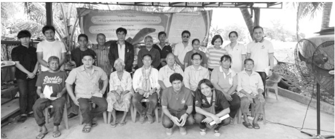
ภาพที่ 3 คณะวิจัยร่วมกับสมาชิกกลุ่มกล้วยตาก