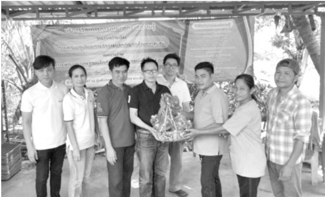
ภาพที่ 5 คณะวิจัยมอบของที่ระลึกให้ตัวแทนกลุ่มกล้วยตากชุมชน

การวิจัยเป็นการวิจัยที่เน้นกลุ่มในพื้นที่ การเก็บรวบรวมข้อมูลจะได้จากแบบสอบถาม สั้น ๆ สัมภาษณ์ และจากเอกสารข้อมูลที่ทาง กลุ่มผลิตภัณฑ์กล้วยตากชุมชน จัดบันทึกไว้ เช่น ปริมาณการซื้อวัตถุดิบ ยอดขาย รายได้ เป็นต้น