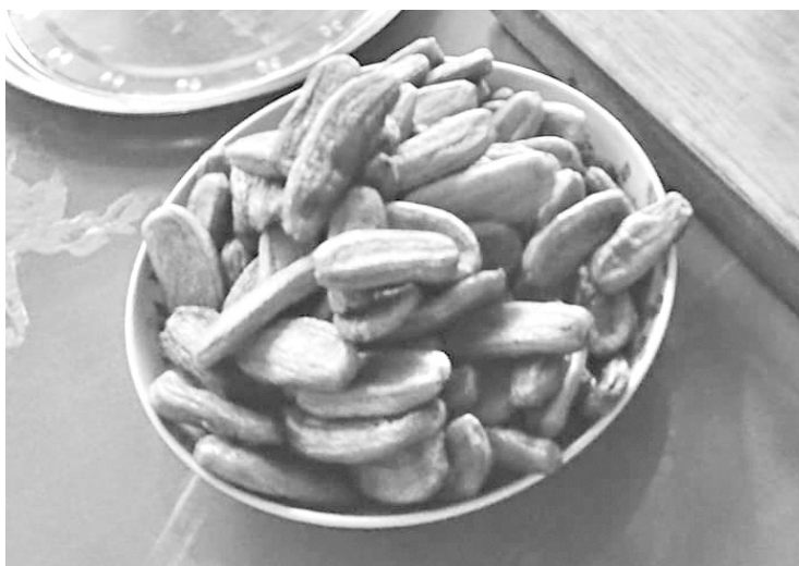
ภาพที่ 6 ผลิตภัณฑ์ของกลุ่มกล้วยตาก (ผลิตภัณฑ์เดิม)