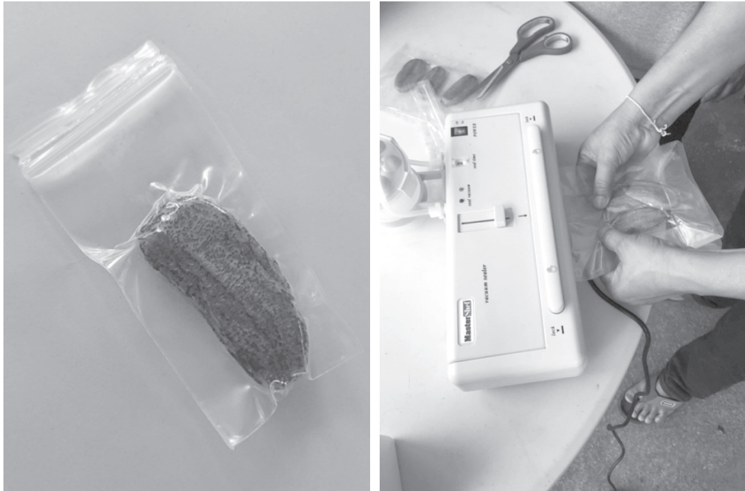
ภาพที่ 7 ผลิตรภัณฑ์ของกลุ่มกล้วยตาก (ผลิตรภัณฑ์ใหม่) หลังการถ่ายทอดองค์ความรู้

ตารางที่ 1 ปริมาณการซื้อกล้วยดิบและปริมาณการขายกล้วยตากหลังการได้รับการถ่ายทอดเนื้อหาการบริหารจัดการผลิตรภัณฑ์