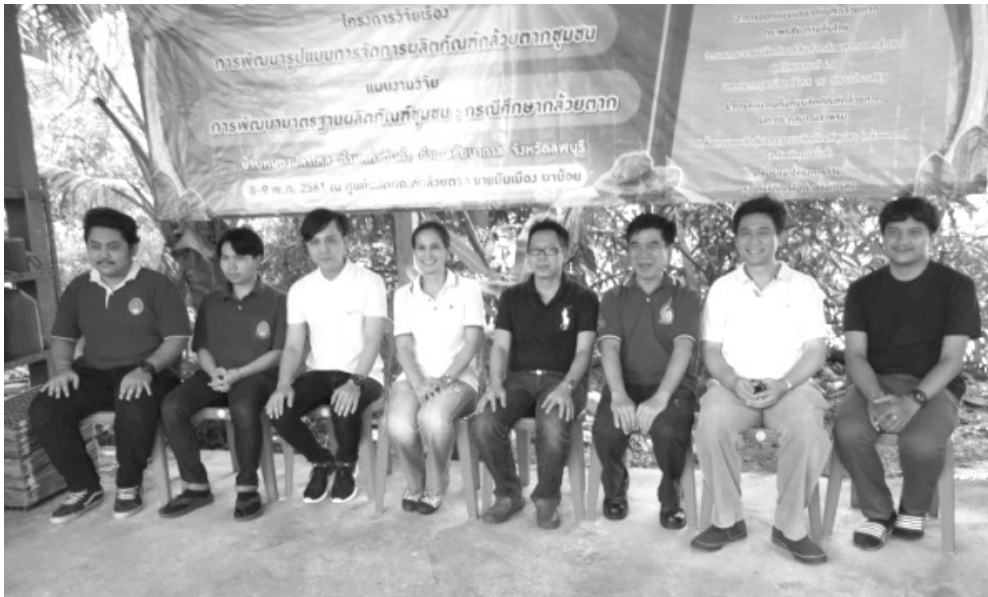
ภาพที่ 4 คณะวิจัย