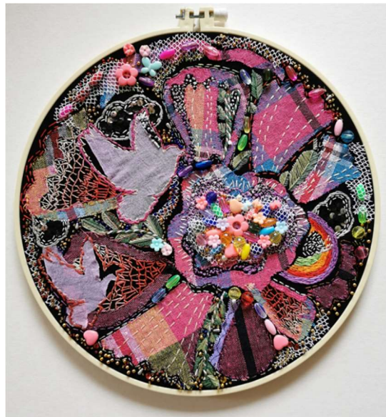
ภาพที่ 12 ภาพผลงานที่เสร็จสมบูรณ์

6) ขั้นตอนสุดท้ายเก็บรายละเอียดในส่วนต่างๆ ของภาพที่เพิ่มเติมจากภาพร่างอีกครั้งจนเสร็จสมบูรณ์