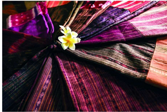
ภาพที่ 3 ตัวจีน ลายตั้งชั้นทางยีนสลับลวดลายที่เกิดจากการมัดหมี่ หรือ หมี่คั้นน้อย (หัวแดงตีนก่านสวมใส่สไตล์ไทหล่ม,2562)