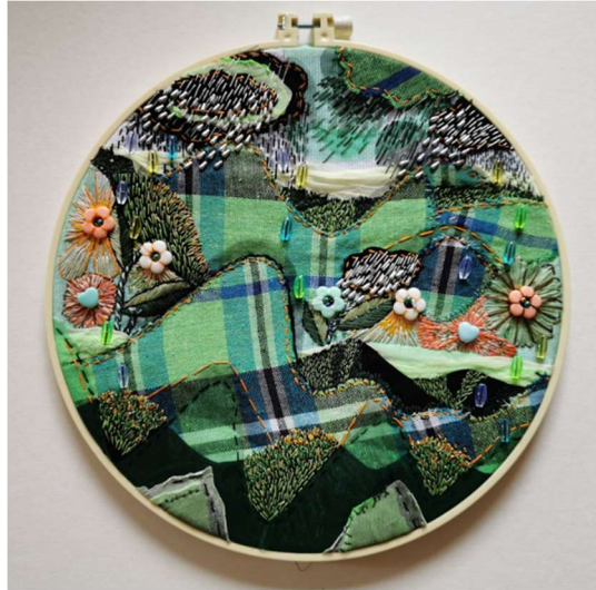
ภาพที่ 13 “การสร้างสรรคศิลปะสื่อประสมจากลวดลายผ้าทอ จังหวัดเพชรบูรณ์ หมายเลข 01”