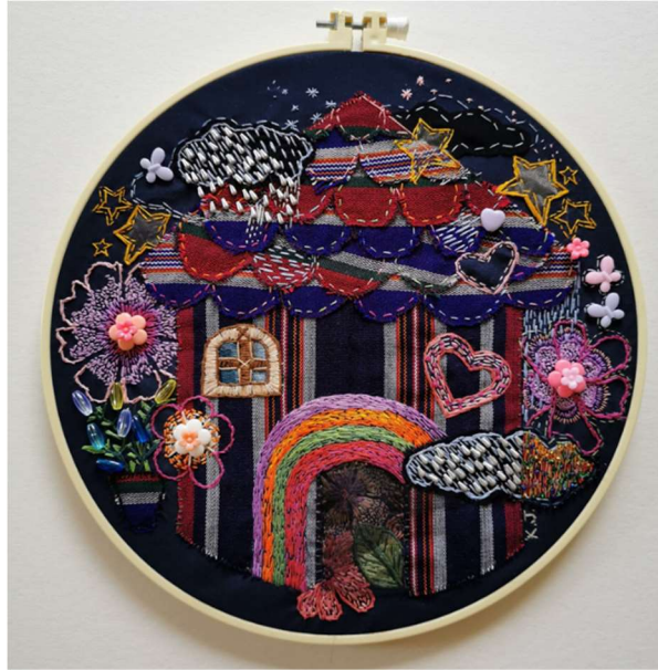
ภาพที่ 16 “การสร้างสรรค์ศิลปะสื่อประสมจากลวดลายผ้าทอ จังหวัดเพชรบูรณ์ หมายเลข 04”