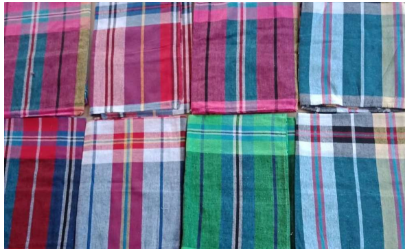
ภาพที่ 1 ผ้าขาวม้า

จากการศึกษาประเภทของผ้าทอ และประวัติความเป็นมาที่เก่าแก่ของผ้าทอในจังหวัดเพชรบูรณ์ ทำให้ผู้วิจัยมีความสนใจในลวดลายผ้าทอที่เป็นเอกลักษณ์ มีความเฉพาะตัว จึงเลือกนำผ้าขาวม้า และซิ่นหัวแดงตีนก่านมาสร้างสรรค์เป็นผลงานศิลปะสื่อผสม โดยผ้าขาวม้านั้นจะมีทั้งชนิดทอจากฝ้ายและไหม ผ้าฝ้ายจะใช้ด้ายสองสี ลวดลายเป็นรูปทรงสี่เหลี่ยมจตุรัส และสี่เหลี่ยมผืนผ้า ส่วนใหญ่จะใช้เป็นผ้าพาดบ่าหรือผ้าพันเอว ซึ่งผ้าขาวม้าจะมีสีเส้นและลวดลายให้เลือกใช้ได้อย่างสร้างสรรค์หลากหลายรูปแบบ เหมาะแก่การนำมาสร้างสรรค์ผลงาน และซิ่นหัวแดงตีนก่าน หรือซิ่นหมี่คั้นน้อย ถือเป็นมรดกภูมิปัญญาของชาวไทหล่ม (อำเภอหล่มสัก และอำเภอหล่มเก่า) จะมีกรรมวิธีในการผลิตที่งดงามในการกำหนดลวดลายในส่วนต่างๆ ของซิ่น ซึ่งจะมีองค์ประกอบ 3 ส่วนหลัก ได้แก่ หัวซิ่น ตัวซิ่น และตีนซิ่น เมื่อทอเสร็จแล้วจะนำแต่ละส่วนมาเย็บติดกันก่อนสวมใส่ (กรมการพัฒนาชุมชน จังหวัดเพชรบูรณ์ : 2562 :11-12)