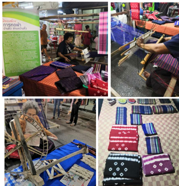
ภาพที่ 5 ภาพการเก็บข้อมูลจากสถานที่จริง ณ ถนนคนเดินไท-หล่ม อำเภอหล่มสัก จังหวัดเพชรบูรณ์

เพื่อศึกษาประวัติความเป็นมา ประเภท และรูปแบบตลอดจนกระบวนการผลิตผ้าทอ จังหวัดเพชรบูรณ์ จึงทำการลงพื้นที่เก็บข้อมูลภาคสนาม ศึกษา และรวบรวมภาพถ่ายจากสถานที่จริง ณ ถนนคนเดินไท-หล่ม อำเภอหล่มสัก จังหวัดเพชรบูรณ์ ซึ่งเป็นผ้าทอในเขตอำเภอตอนบนของจังหวัด ทำให้ได้เห็นกระบวนการผลิตผ้าทอพื้นบ้าน ที่ใช้เส้นด้ายจากไหม และฝ้ายที่มีอยู่ในท้องถิ่นมาเป็นวัตถุดิบหลักในการทอผ้า โดยเน้นการใช้สีจากธรรมชาติ ในโทนสีอบอุ่นทอออกมาเป็นลายขวาง และพิพิธภัณฑ์หล่มสักดี อำเภอหล่มสัก จังหวัดเพชรบูรณ์ ได้ทราบประวัติข้อมูล รูปแบบของการนำผ้าทอมาใช้เป็นเครื่องนุ่งห่มในชีวิตประจำวัน เกิดเป็นวัฒนธรรมการแต่งกายที่เป็นเอกลักษณ์ของคนไทหล่ม ในอำเภอหล่มสัก จังหวัดเพชรบูรณ์