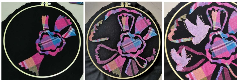
ภาพที่ 10 การเย็บผ้าลงบนสะดึง

4) นำผ้าที่ตัดไว้มาจัดวางองค์ประกอบลงบนผ้าพื้นหลังที่ขึงไว้กับสะดึงที่เตรียมไว้ ตามแบบร่างที่กำหนดไว้ จากนั้นใช้ไหมเย็บติดให้เรียบร้อย