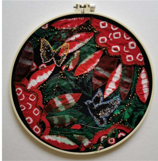
ภาพที่ 15 “การสร้างสรรค์ศิลปะสื่อประสมจากลวดลายผ้าทอ จังหวัดเพชรบูรณ์ หมายเลข 03”