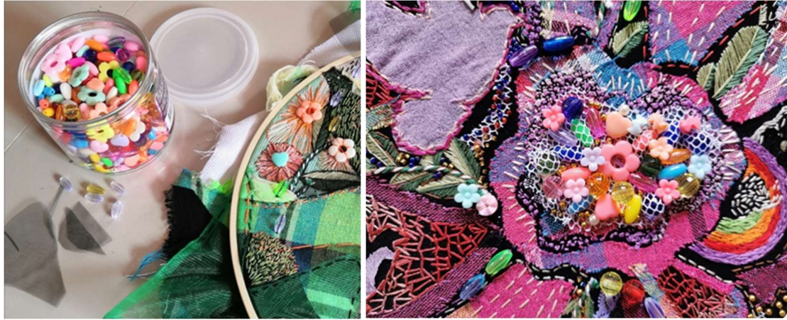
ภาพที่ 11 การตกแต่งด้วยลูกปัด และไหมปักผ้า ที่มา : ขวัญจิรา เจียนสกุล , 2563

5) เพิ่มเติมรายละเอียดของภาพผลงาน โดยการนำลูกปัดขนาดต่างๆ เลื่อมสี และไหมปักผ้ามาตกแต่งให้เกิดรายละเอียดตามภาพร่างให้สมบูรณ์