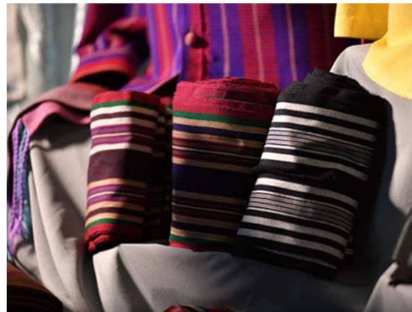
ภาพที่ 4 ตีนจีน ทอด้วยด้ายเส้นยีนมีสีตัดกับตัวจีน โดยทอเป็นลายขวาง เรียกว่า ตีนก่าน ก่าน แปลว่า ทางขวาง ในภาษาลาว (หัวแดงตีนก่านสวมใส่สไตล์ไทหล่ม,2562)