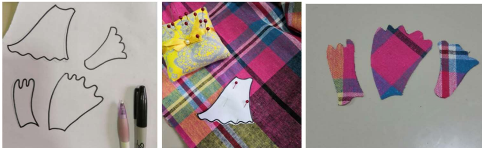
ภาพที่ 9 การตัดผ้าตามแบบร่าง

3) ทำการร่างแบบของรูปทรงที่จะใช้ ลงบนกระดาษตามขนาดที่ต้องการให้เหมาะสมกับขนาดจริงจากภาพร่าง และตัดแบบกระดาษที่ร่างไว้ทาบลงบนผ้าทอมือแล้วตัดออกมาเป็นชิ้นๆ เพื่อที่จะนำมาเย็บติดลงบนผ้าที่ขึงไว้กับสะดึง