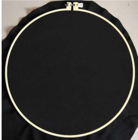
ภาพที่ 8 การขึงผ้าบนสะดึง

2) เลือกนำผ้าสีพื้นที่ใช้เป็นพื้นหลัง (background) ของผลงาน โดยเลือกใช้สีตามภาพร่างที่กำหนดไว้ มาขึงลงบนสะดึงให้ตึง