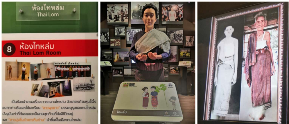
ภาพที่ 6 ภาพการเก็บข้อมูลจากสถานที่จริง ณ พิพิธภัณฑ์หล่มศักดิ์ อำเภอลหล่มสัก จังหวัดเพชรบูรณ์