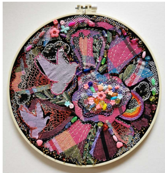
ภาพที่ 14 “การสร้างสรรคศิลปะสื่อประสมจากลวดลายผ้าทอ จังหวัดเพชรบูรณ์ หมายเลข 02”