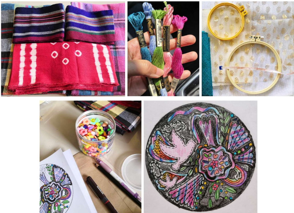
ภาพที่ 7 จัดเตรียมวัสดุอุปกรณ์ก่อนการสร้างสรรค์ผลงาน

1) ก่อนการสร้างสรรค์ผลงานในแต่ละชิ้นจะต้องทำการเลือกผ้าทอมือ จัดทำภาพร่าง และจัดเตรียมวัสดุอุปกรณ์ต่างๆ ที่จะใช้ให้เรียบร้อยก่อนการสร้างสรรค์ผลงาน