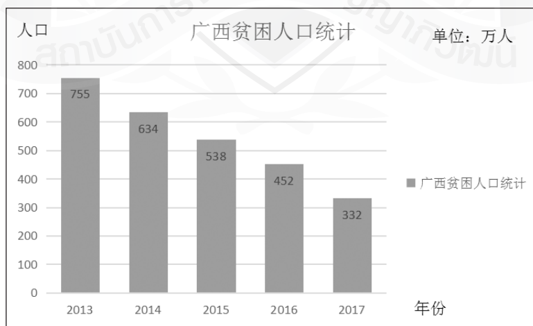
图1 广西近五年贫困人口统计情况

为进一步加快推进对贫困区县脱贫摘帽工作进度，确保 2020 年实现全面小康的目标，中央财政和自治区财政不断加大对广西各贫困地区县的资金扶持力度，扶贫资金数额逐年上涨。近日，自治区财政厅提前下达了 2017 年度财政专项扶贫资金（发展资金）32.47 亿，用于支持全区今年扶贫开发相关工作。32.47 亿元专项扶贫资金包括中央资金 22.47 亿元，比上年同期提前下达的中央资金增长 68.9%；自治区资金 10 亿元，是上年同期提前下达自治区资金的 2.5 倍。中央下达资金较 2016 年度增加 9 亿多元；自治区本级资金 10 亿元，较 2016 年度增加了 6 亿多元。同时，从 2010 年的 1012 万贫困人口到如今的 332 万，广西与贫困战斗的成绩有目共睹（详见图 1 所示）。