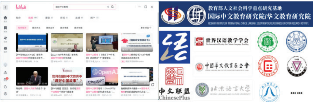
图 1 哔哩哔哩（Bilibili）视频平台和“国际中文教育”相关资源平台

本研究主要通过哔哩哔哩（Bilibili）视频平台和“国际中文教育”相关资源平台(如图 1)，如“中文联盟”和“中外语言交流合作中心”等资源平台，北京语言大学国际中文教育研究院/华文教育研究院类——教育部人文社会科学重点研究基地，中央民族大学、浙江师范大学、云南师范大学、厦门大学等高校平台，综合搜集国际中文教育讲座相关内容。