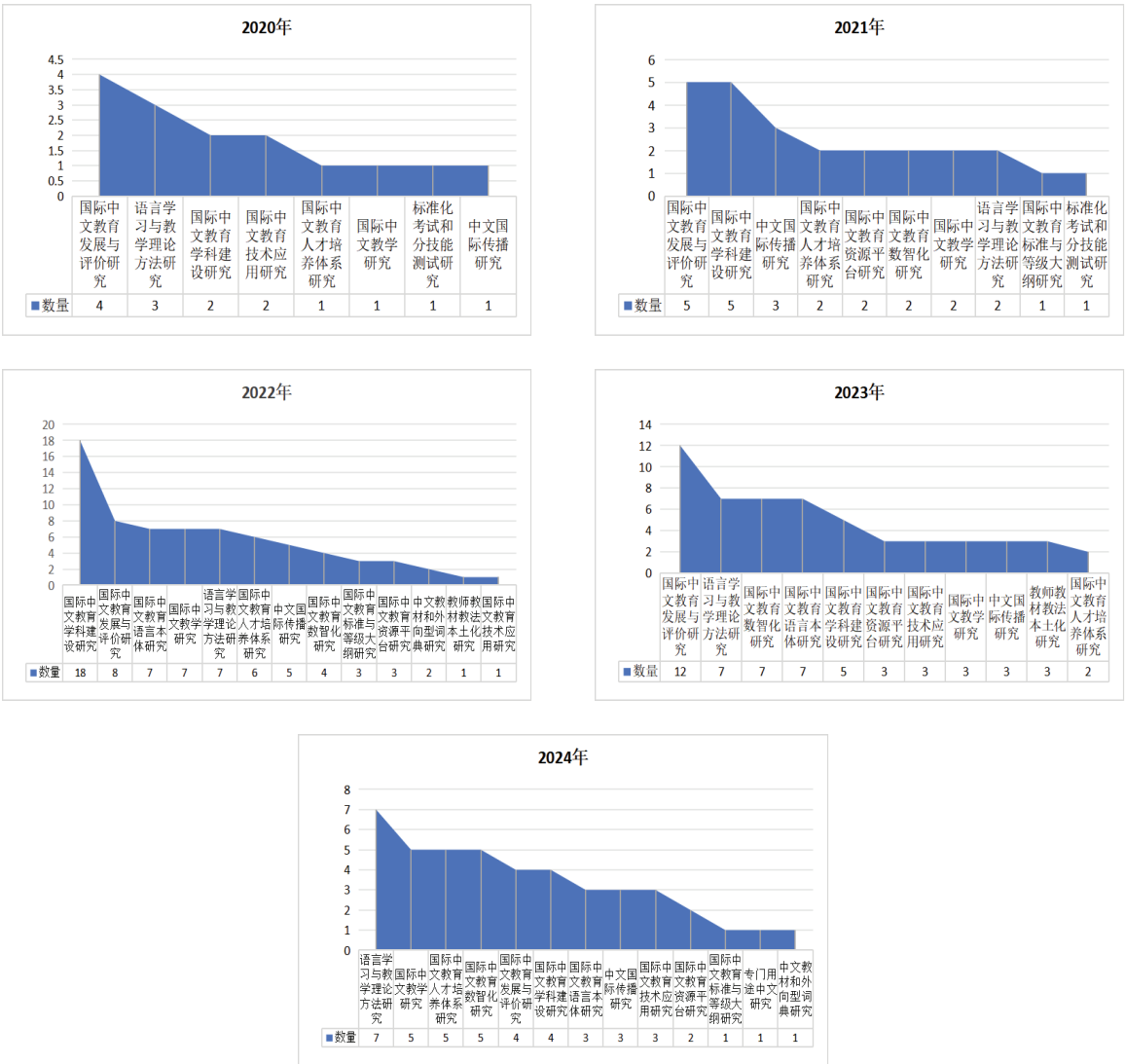
图 2 2020-2024 年国际中文教育线上讲座主讲内容从属类型面积图组

根据图 2 图组可以看出，各年的国际中文教育线上讲座内容焦点各异，2020 年为发展与评价研究内容；2021 年是发展与评价研究和学科建设研究内容；2022 年为学科建设研究内容；2023 年为发展与评价研究内容；2024 年为语言学习与教学理论方法研究内容。