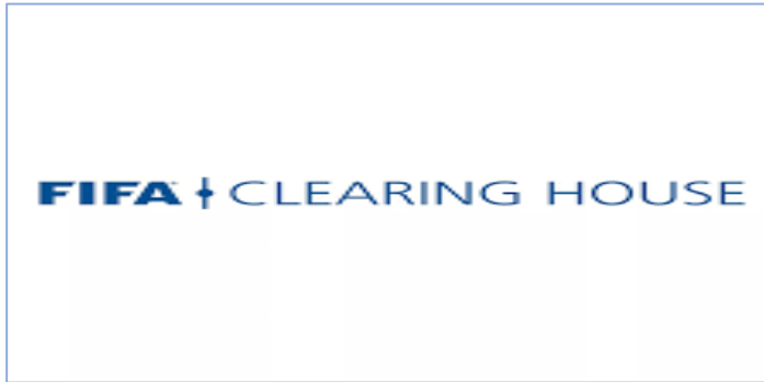
ภาพที่ 1 สัญลักษณ์ของสำนักงาน FIFA Clearing House 21