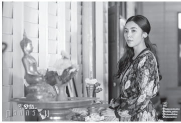
ภาพที่ 2 ภาพประกอบแสดงตัวละครเรณู

ตัวละครปรธม หรือ เฮียใช้ ลูกชายคนโตของแม่ช้อย ตระกูลแบ้ พบรักกับเรณูที่บาร์ที่ตาคลี และพากันย้ายมาอยู่ที่หุ้มแสง เฮียใช้เป็นทำอาชีพเป็นทหาร เป็นคนสุขุม แต่ด้วยความเกรงใจเจ้านายที่เป็นทหาร ทำให้ต้องแต่งงานใหม่กับลูกเจ้านาย แต่สุดท้ายประสบอุบัติเหตุจนพิการ ทำให้ลูกสาวเจ้านายเลิกไป เรณูจึงกลับไปดูแลเฮียใช้