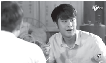
ภาพที่ 6 ภาพประกอบแสดงตัวละครกรมกล หรือ อาลี

ตัวละครกรมกล หรือ อาลี ลูกชายคนที่ 4 ของแม่ช้อย ตระกูลเบ๊ นิสัยเจ้าชู้ เป็นนักเรียนโรงเรียนช่างอยู่ที่ปากน้ำโพ