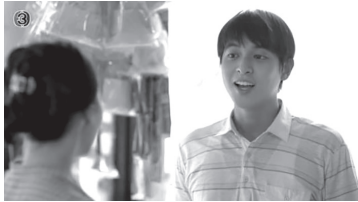
ภาพที่ 5 ภาพประกอบแสดงตัวละครกรมล หรือ อาซา

ตัวละครกรมล หรือ อาซา ลูกชายคนที่ 3 ของแม่ช้อย เป็นคนจิตใจดี หน้าตาน่ารัก แต่งตัวสุภาพ ชอบช่วยเหลือพี่สะใภ้จากแม่ช้อยที่ชอบค้าอยู่เสมอ เชื่อฟังคำสั่งสอนของพ่อแม่ เป็นลูกที่ดี