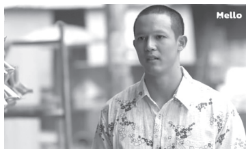
ภาพที่ 4 ภาพประกอบแสดงตัวละครประสงค์ หรือ อาตง

ตัวละครประสงค์ หรือ อาตง ลูกชายคนที่ 2 ของแม่ช้อย ตระกูลแบ้ เคยบวชพระ แต่แม่ขอให้สึกมาแต่งงานกับพี่ไลคู่หมั้นเก่าของเฮียใช้เป็นคนสุภาพ พุดจาใจเย็น แต่งกายสุภาพ นิสัยเป็นคนที่เรียบร้อย พุดจาดี