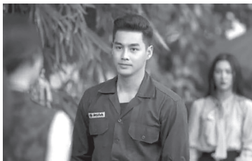
ภาพที่ 3 ภาพประกอบแสดงตัวละครปรธม หรือ เฮียใช้

ตัวละครปรธม หรือ เฮียใช้ ลูกชายคนโตของแม่ช้อย ตระกูลแบ้ พบรักกับเรณูที่บาร์ที่ตาคลี และพากันย้ายมาอยู่ที่หุ้มแสง เฮียใช้เป็นทำอาชีพเป็นทหาร เป็นคนสุขุม แต่ด้วยความเกรงใจเจ้านายที่เป็นทหาร ทำให้ต้องแต่งงานใหม่กับลูกเจ้านาย แต่สุดท้ายประสบอุบัติเหตุจนพิการ ทำให้ลูกสาวเจ้านายเลิกไป เรณูจึงกลับไปดูแลเฮียใช้