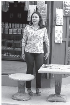
ภาพที่ 1 ภาพประกอบแสดงตัวละครแม่ช้อย

ตัวละครแม่ช้อย เป็นผู้มีฐานะดี ร่ำรวย เป็นเจ้าของร้านค้าและโรงสีที่ชุมชน แดงกายคูตีเป็นเจ้าเป็นมีคนที่ชอบบงการชีวิตลูกตัวเอง คอยจัดการทุกอย่างภายในบ้าน เห็นแก่ตัว เจ้าคิดเจ้าแค้น หยิ่งในศักดิ์ศรีของตนเอง พุดจาไม่สุภาพ รุนแรง มีปากเสียงกับลูกสะใภ้คนโตอย่างรุนแรงตลอดเวลา ไม่ยอมให้ใครมาพุดจาถูกเหยียดหยามตนเอง