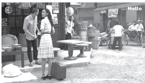
ภาพที่ 8 ตัวอย่างภาพประกอบแสดงตัวละครฉากชุมชนที่ตัวละครหลักอาศัยอยู่

ฉากที่เกี่ยวข้องกับชุมชน ยกตัวอย่างเช่น ฉากการค้าขายในตลาด ในชุมชน ที่ตัวละครหลักอาศัยอยู่, ฉากในบริเวณหมู่บ้านที่จัดงานศพโกสั่ว๊ด เป็นต้น