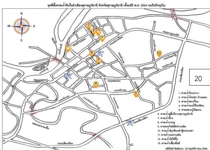
ภาพที่ 20: แผนที่แสดงจุดที่ตั้งศาลเจ้าจีนในอำเภอเมืองสุราษฎร์ธานี (ตั้งแต่ปี พ.ศ. 2524 จนถึงปัจจุบัน)

ตั้งแต่ปี พ.ศ. 2524 จนถึงปัจจุบัน ช่วง 4 ทศวรรษที่ผ่านมา จุดที่ตั้งศาลเจ้ายังมีการเปลี่ยนแปลง คือ จุดที่ตั้งของศาลเจ้าอู่ตี้เป๊ะกงสุราษฎร์ธานี เนื่องจากการขยายพื้นที่ในการจัดสร้างจังหวัดทหารบกสุราษฎร์ธานี (ค่ายวิภาวดีรังสิต) จึงทำให้ศาลเจ้าแห่งนี้ต้องย้ายสถานที่ตั้งไปที่จุดหมายเลข 6 ซึ่งเป็นสถานที่ตั้งปัจจุบัน 1 นอกจากนี้ มีศาลเจ้าที่ก่อตั้งขึ้น (ช่วงปี พ.ศ. 2543-2557) จำนวน 4 แห่ง คือ หมายเลข 7 ศาลเจ้าจิ้งก มูลนิธิส่งเสริมคุณธรรม หมายเลข 8 ศาลเจ้ากวนอู หมายเลข 9 ศาลพระโศภิตร์กวนอิม และหมายเลข 10 ศาลเจ้าตั้งเทียนซำฟู่หองหย่า ซึ่งศาลเจ้าทั้ง 4 แห่งนี้ ก่อสร้างบนพื้นที่ที่สะดวกในการจัดหาและมีความเหมาะสมในการจัดตั้งตามวัตถุประสงค์ของศาลเจ้า ปัจจุบันอำเภอเมืองสุราษฎร์ธานีปรากฏศาลเจ้าที่มีสภาพขาดการดูแลและไม่เปิดให้บริการทางด้านสาธารณสุขตามสัญลักษณ์รูปดาวในแผนที่