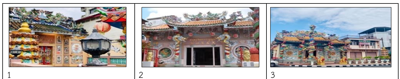
ภาพที่ 1: ภาพศาลเจ้าปึงเถ่ากง ภาพที่ 2: ภาพศาลเจ้าไหหล่า บ้านดอน ภาพที่ 3: ภาพศาลเจ้าฮกเกี้ยน

ตารางแสดงข้อมูลศาลเจ้าจีนในอำเภอเมืองสุราษฎร์ธานีข้อมูลข้างต้น แสดงให้เห็นว่าในพื้นที่อำเภอเมืองสุราษฎร์ธานี ไม่ปรากฏ “วัดจีน” ซึ่งมีความแตกต่างไปจากพื้นที่จังหวัดอื่นของประเทศไทย ข้อมูลในตารางสามารถเรียงลำดับอายุของศาลเจ้าแต่ละแห่งออกเป็น 2 ช่วง คือ ช่วงที่ 1 ศาลเจ้าที่มีหลักฐานปรากฏช่วงก่อนปี พ.ศ. 2500 ในลำดับที่ 1-4 มี ศาลเจ้าปึงเถ่ากง ศาลเจ้าไหหล่า บ้านดอน ศาลเจ้าฮกเกี้ยน และศาลเจ้าองค์โป๊ยเซียโจวซือ มูลนิธิมิทิตาจิตธรรมสถาน ช่วงที่ 2 ศาลเจ้าที่มีหลักฐานปรากฏในตั้งแต่ปี พ.ศ. 2500 เป็นต้นมา ในลำดับที่ 5-10 มีศาลหลวงปู่ไต่ฮงกง มูลนิธิกุศลศรัทธา ศาลเจ้าอู๋ตี้แป๊ะกง ศาลเจ้าจี้กง มูลนิธิส่งเสริมคุณธรรม ศาลเจ้ากวนอู ศาลพระโพธิสัตว์กวนอิม และศาลเจ้าตั้งเทียนซาฟู่ห้วงหย่า ส่วนลำดับที่ 11-13 คือศาลเจ้าที่มีสภาพขาดการดูแลและไม่เปิดให้บริการด้านสาธารณกุศล มีศาลเจ้าแม่กวนอิม ศาลเจ้าไฮไ้จื้อ และศาลเจ้าเสี่ยวลิ้มยี่ ศาลเจ้าในลำดับที่ 1-9 มีข้อมูลประวัติดังต่อไปนี้