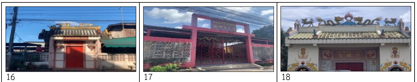
ภาพที่ 16: ศาลเจ้าแม่กวนอิม ภาพที่ 17: ศาลเจ้าไฮไต้จื้อ ภาพที่ 18: ศาลเจ้าเสี้ยวลิ้มยี่ ที่มา (ซ้าย กลางและขวา): ภาพศาลเจ้าที่มีสภาพขาดการดูแลและไม่เปิดให้บริการด้านสาธารณกุศล (อริปัตย์ นิตยน์รา, บันทึกเมื่อ วันที่ 10 พฤศจิกายน 2564)

ในส่วนของศาลเจ้าที่มีสภาพขาดการดูแลและไม่เปิดให้บริการด้านสาธารณกุศลทั้ง 3 แห่งนั้น คือ ศาลเจ้าแม่กวนอิม ศาลเจ้าไฮไต้จื้อ และศาลเจ้าเสี้ยวลิ้มยี่ ผู้วิจัยยังไม่พบเอกสารประวัติรวมถึงข้อมูลที่จะสามารถนำมาประกอบการวิจัยได้