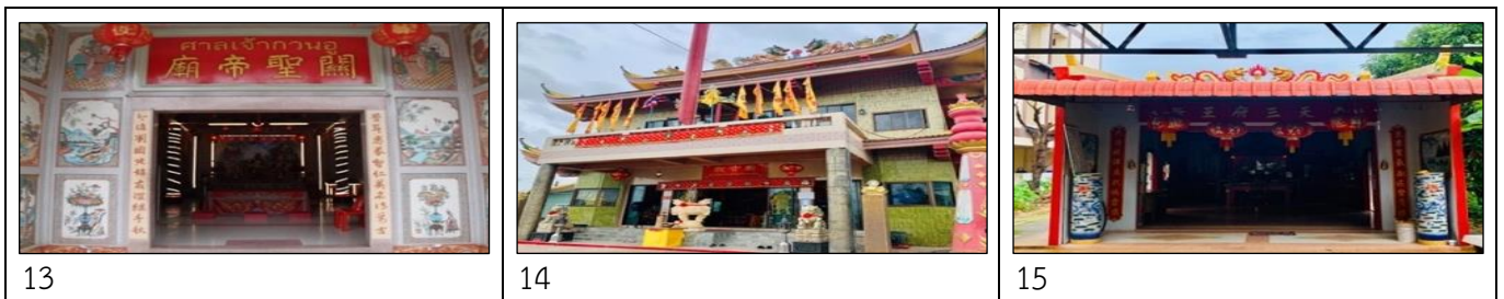
ภาพที่ 13: ภาพศาลเจ้ากวนอู ภาพที่ 14: ภาพศาลพระโพธิสัตว์กวนอิม ภาพที่ 15: ภาพศาลเจ้าตั้งเทียนชำฟูห้วงหย่า

นอกจากการศึกษาเอกสารข้อมูลประวัติศาลเจ้าเงินที่ตั้งในอำเภอเมืองสุราษฎร์ธานีแล้ว ผู้วิจัยยังได้ลงพื้นที่ศึกษาข้อมูล ประวัติศาลเจ้าเพิ่มเติม พบว่า เอกสารข้อมูลประวัติศาลเจ้าในช่วงก่อนปี พ.ศ. 2500 บางแห่งสูญหายไปตามกาลเวลาและไม่ได้มีการจดบันทึกใหม่ เหลือเพียงแต่ข้อมูลสำหรับการท่องเที่ยวเท่านั้น และมีศาลเจ้าเพียง 3 แห่ง จากศาลเจ้า 9 แห่งที่ยังไม่จดบันทึกข้อมูลประวัติศาลเจ้าอย่างเป็นรูปธรรม ซึ่งเป็นศาลเจ้าเงินที่ก่อตั้งขึ้นในช่วง 20 กว่าปีที่ผ่านมานี้ (ช่วงปี พ.ศ. 2544-2557) คือ ศาลเจ้ากวนอู ศาลพระโพธิสัตว์กวนอิม และศาลเจ้าตั้งเทียนชำฟูห้วงหย่า