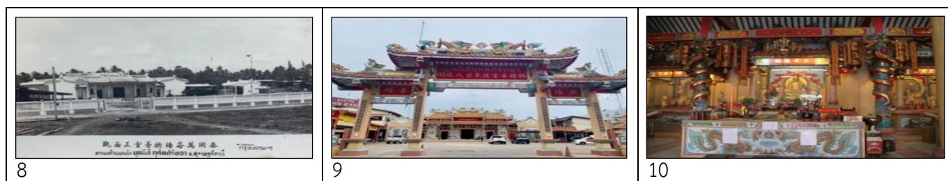
ภาพที่ 8-10: ด้านหน้าศาลหลวงปู่โตฮองกง มูลนิธิกุศลศรัทธาในอดีตและปัจจุบัน

ที่มา (ซ้าย): ภาพเก่าด้านหน้ามูลนิธิกุศลศรัทธา (มูลนิธิกุศลศรัทธาสุราษฎร์ธานี, 2558: 98)