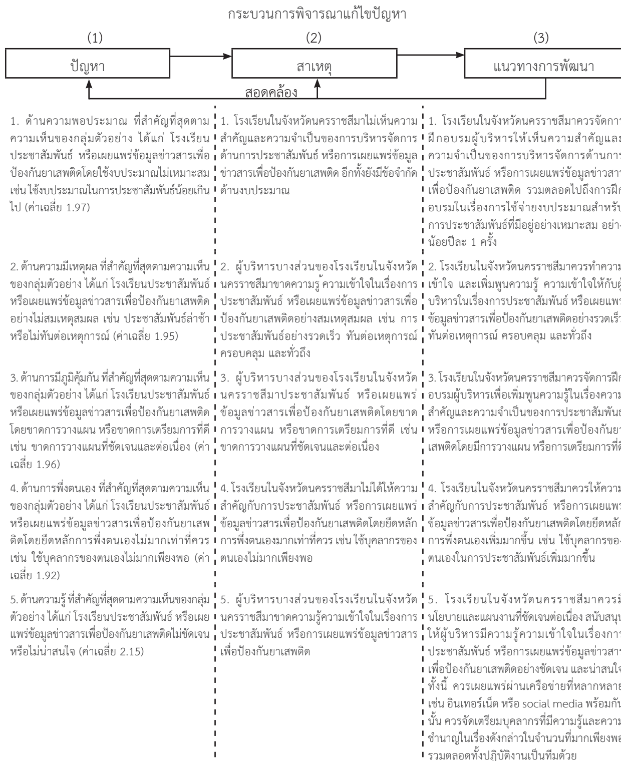
ภาพ 2 ภาพรวมปัญหา สาเหตุ และแนวทางการพัฒนาการบริหารจัดการด้านการประชาสัมพันธ์เพื่อป้องกันยาเสพติดของโรงเรียนในจังหวัดนครราชสีมาตามปรัชญาของเศรษฐกิจพอเพียง

ที่สำคัญที่สุด ด้านละ 1 ปัญหาเท่านั้น ในเวลาเดียวกัน ได้เสนอสาเหตุ และแนวทางแก้ไข หรือ แนวทางการพัฒนาการบริหารจัดการควบคู่ไปด้วยดังภาพ 2