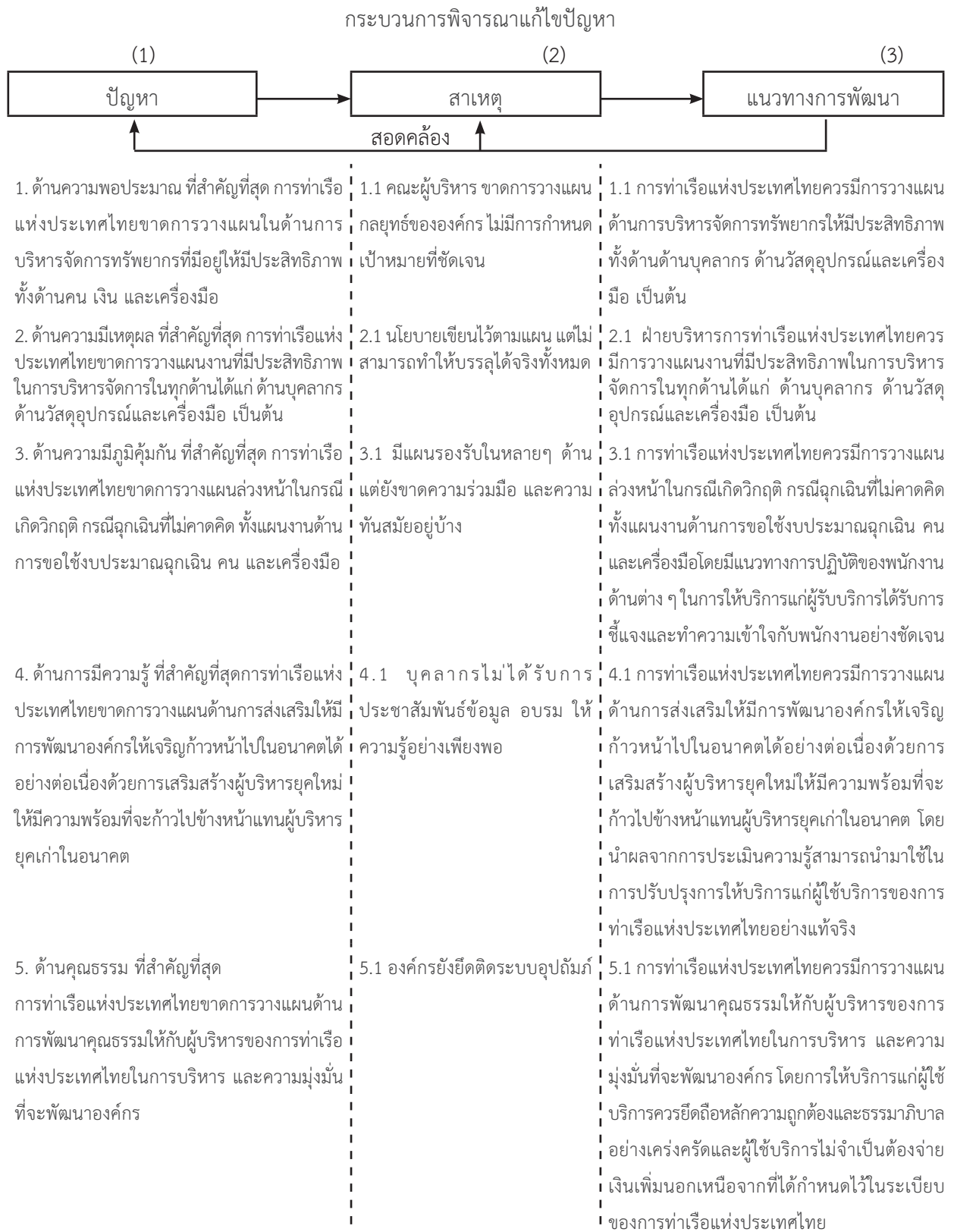
ภาพ 2 ภาพรวมปัญหา สาเหตุ และแนวทางการพัฒนาการบริหารจัดการด้านการวางแผนของการทำเรือแห่งประเทศไทย ตามปรัชญาของเศรษฐกิจพอเพียง 5 ด้าน โดยนำกรอบแนวคิดทางวิชาการที่เรียกว่า “กระบวนการพิจารณาการแก้ไข ปัญหา” ที่ประกอบด้วยปัญหา สาเหตุ และแนวทางการแก้ไข หรือแนวทางการพัฒนามาปรับใช้