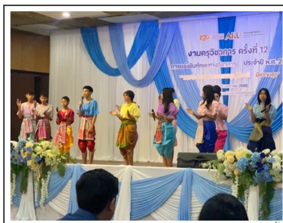
ภาพ 3 การแสดงเพลงน้อยสร้างสรรค์ งานครูวิชาการ ครั้งที่ 12 จัดโดยคณะครุศาสตร์ มหาวิทยาลัยราชภัฏพระนครศรีอยุธยา

นอกจากนี้ผู้วิจัยยังได้นำผลงานการแสดงไปเผยแพร่ในงานครูวิชาการ ครั้งที่ 12 จัดโดยคณะครุศาสตร์มหาวิทยาลัยราชภัฏพระนครศรีอยุธยา ในวันที่ 21 มกราคม 2568 ดังภาพ 3