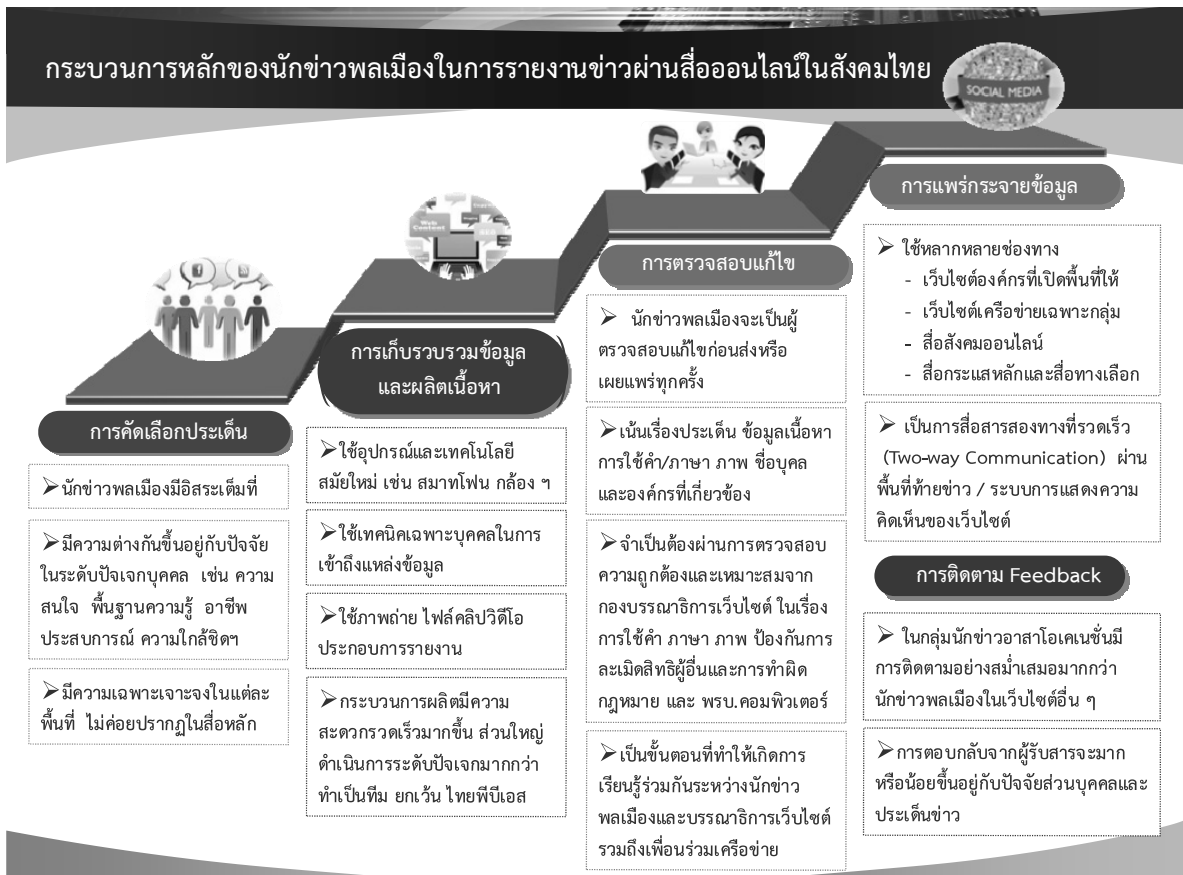
ภาพที่ 1 : แสดงรายละเอียดกระบวนการในการรายงานข่าวผ่านสื่อออนไลน์ของนักข่าวพลเมืองในสังคมไทย

2551, 245) ที่พบว่า มีขั้นตอนหลักที่เหมือนกัน นั่นคือ การรวบรวม การหาข่าวหรือคัดเลือกประเด็นในการนำเสนอ การแสวงหาข้อมูล การผลิตเนื้อหา การบรรณาธิการข่าว การเผยแพร่ข่าวสารไปยังผู้รับ สามารถที่จะตรวจสอบให้ข้อมูล ช่วยรวบรวม และหาข่าวร่วมกันได้ ส่วนความแตกต่างที่พบนั้น นักข่าวพลเมืองมีอิสระในการคัดเลือกและนำเสนอประเด็นปัญหาต่าง ๆ ได้มากกว่า เนื่องจากไม่ต้องดำเนินงานภายใต้กรอบนโยบายหรือมีเป้าหมายในเชิงธุรกิจเหมือนกับนักข่าวอาชีพในองค์กรสื่อ