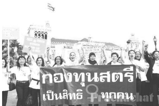
รูปที่ 1 กลุ่มผู้สนับสนุนนโยบายกองทุนพัฒนาบทบาทสตรี