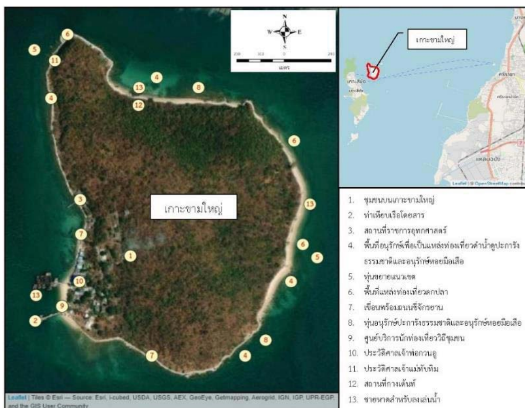
ภาพที่ 2: แผนที่แหล่งท่องเที่ยวเกาะขามใหญ่

จะเห็นได้สิ่งเหล่านี้ เป็นส่วนสนับสนุนการท่องเที่ยวของชุมชนและเกิดมูลค่าต่อภูมิภาค โดยทรัพยากร จะแสดงในภาพที่ 2 ดังต่อไปนี้