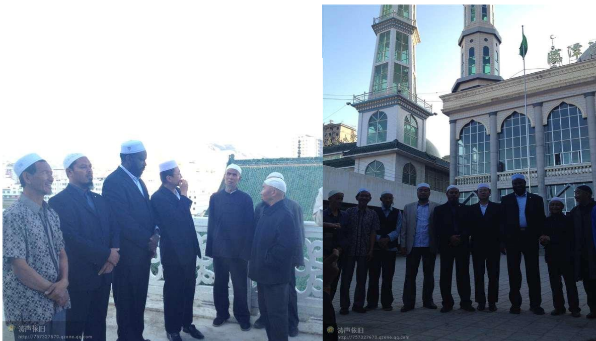
صورة تذكارية مع الأخوة من جماعة شيداتونغ ( الجامع الكبير الغربي ) في لينتان