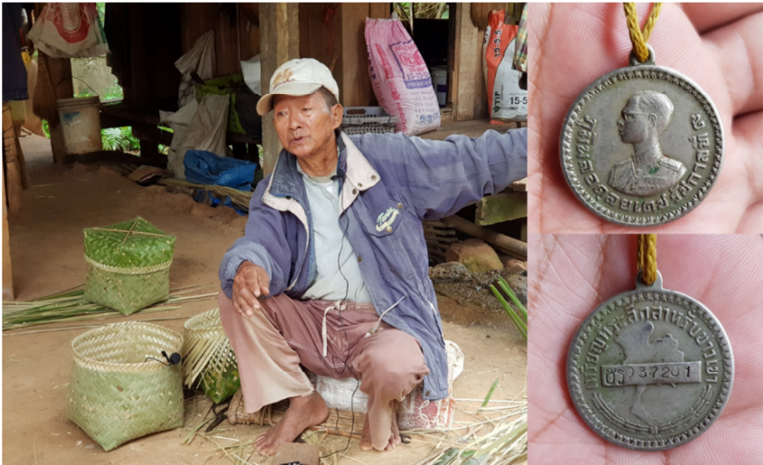
ภาพที่ 1 เรื่องเล่าเหรียญของในหลวง บ้านสะงี อำเภอยางชุมน้อย จังหวัดศรีสะเกษ

หมู่บ้านสะงี หรือดอยสะงี เป็นภาษาถิ่นซึ่งออกเสียงได้ 2 ลักษณะคือ สะงี หรือสะงีะ เดิมชุมชนตั้งอยู่บริเวณที่สูง เรียกว่า “ดอยสะงีบน” และประมาณ ปี พ.ศ. 2509 ทรัพยากรธรรมชาติบนดอยสะงีบนเริ่มเสื่อมโทรม รวมถึงภัยจากสัตว์ป่า และยุบชุกชุม ทำให้ชาวบ้านส่วนใหญ่ย้ายที่ดินทำกิน ปลูกข้าวไร่ในพื้นที่ด้านล่างลงไป จนสุดท้ายชนผลผลิตทางการเกษตรที่ได้ขึ้นดอยไม่ไหวจึงย้ายบ้านเรือนมาตั้งอยู่ใน หมู่บ้านดอยสะงีในปัจจุบัน ปี พ.ศ. 2512 ชาวบ้านดอยสะงีได้รับพระราชทานเหรียญ แทนบัตรประชาชน เช่นเดียวกับหลายชุมชนที่เป็นกลุ่มชาติพันธุ์หรือกลุ่มชาวเขาบน พื้นที่สูงของจังหวัดศรีสะเกษ ซึ่งพระบาทสมเด็จพระบรมชนกาธิเบศร มหาภูมิพลอดุลยเดชมหาราช บรมนาถบพิตร ทรงเห็นความสำคัญของชาวบ้านในพื้นที่ชายแดน ทำให้ชุมชนเริ่มติดต่อกับสังคมภายนอกและเป็นการเปิดโอกาสให้กับชุมชนในเรื่องอื่น ๆ ตามมา เช่น การติดต่อค้าขายแลกเปลี่ยนสินค้า