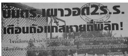
ตัวอย่าง 4

บี้มตร.เผาออก2 ร.ร.เตือนถึง แก๊สหายดีพลิก! โจรเลือกเผาโรงเรียนตามใจชอบ ทั้งริมทาง-บนยอดเขาออก เตือนภัยน่าสงสัยถึงแก๊สหายดี ผิดปกติ หวั่นเข้าตาโจรทำระเบิด (ข่าวใต้ 6 มกราคม 2548)