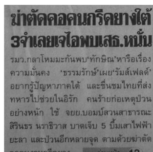
ตัวอย่าง 3

ฆ่าตัดคอคนกรีดขางได้3จำเลยเจอโพบเสธ.หนัก รุมว.กลาโหมมะกันพบ 'ทักษิณ' หรือเรื่องความมั่นคง 'ธรรมรักษ์' เผย 'วิมลเพลด์' อยากรู้ปัญหาภาคใต้ และขึ้นชมไทยที่ส่งทหารไปช่วยในอิรัก คนร้ายก่อเหตุป่วน อย่างหนัก ไซ จยย.บอมบ์สวนสาธารณะ สิรินธร นราธิวาส บาดเจ็บ 5 บีมเสลาไฟฟ้า ยะลา และป่วนอีกหลายจุด ตามด้วยฆ่าตัด คอกองกำลัง (มติชน 7 มิถุนายน 2548)