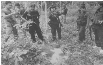
ตัวอย่าง 2