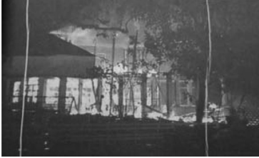
ตัวอย่าง 1