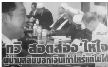
'ทวี สอดส่อง' ให้ใจ ผู้นำมุสลิมบอกเงินเท่าไรให้แก้ไม่ได้ (โพกัส 31 ธันวาคม-13 มกราคม 2554)

ตัวอย่างที่ 1 คือ "ทักษิณ" นายกรัฐมนตรีขณะนั้น และตัวอย่าง 2 คือ "ทวี สอดส่อง" ผู้อำนวยการบริหารจังหวัดชายแดนภาคใต้ (ศอ.บต.) ซึ่งทั้งสองจัดเป็นบุคคลจากหน่วยงานของรัฐเป็นผู้ที่มีหน้าที่รับผิดชอบโดยตรงในการจัดการแก้ไขปัญหาดังกล่าว บุคคลที่มีอำนาจสูงสุดขณะนั้นก็คือ พันตำรวจโท ดร.ทักษิณ ชินวัตร นายกรัฐมนตรีมีอำนาจสั่งการทุกอย่าง เช่น กรณีดังกล่าวที่เป็นการเปิดเผยภาพกองกำลังที่นายสุธรรม แสงประทุม รมช.มหาดไทยขณะนั้นนำมาเปิดเผย ทักษิณมีทั้งความสำคัญโดยตำแหน่งเฉพาะบุคคลและได้รับความสำคัญจากสื่อ