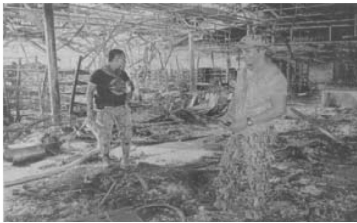
ตัวอย่าง 3