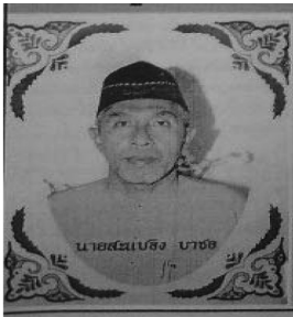
ตัวอย่าง 2