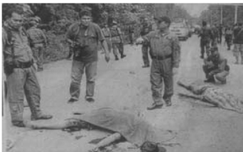
ตัวอย่าง 3