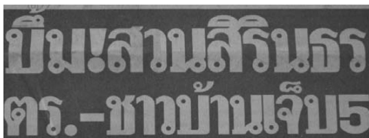
ตัวอย่าง 2

บี้ม!สวนสิรินธร ตร.- ชาวบ้านเจ็บ5 (มติชน 7 มิถุนายน 2548)