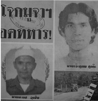
ตัวอย่าง 1