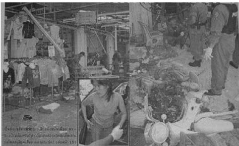
ตัวอย่าง 4