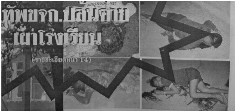
ตัวอย่าง 5