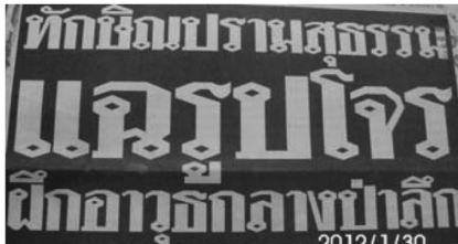
ทักษิณปราณสุธรรม แฉรูปโจร ผึกอาวุธกลางป่าลึก (ไทยรัฐ 24 ธันวาคม 2547)