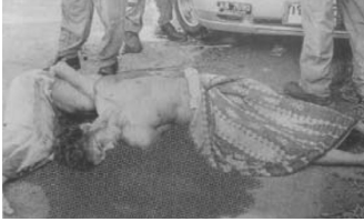
ตัวอย่าง 4