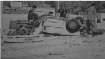
ตัวอย่าง 2