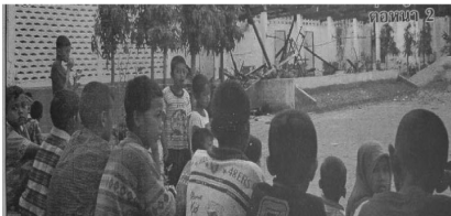
ตัวอย่าง 6