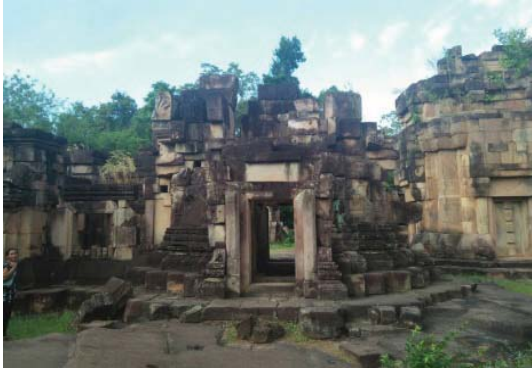
(ที่มา: สุริยา คลังฤทธิ์ ถ่ายเมื่อ 19 พฤศจิกายน 2559)

มากกว่า 3,000 ปี เขตพื้นที่จังหวัดสุรินทร์ อยู่ในเขตพื้นที่พนมดงรัก เป็นแอ่งอารยธรรมขอม บนเขตพื้นที่ราบสูงที่อุดมไปด้วยทรัพยากรธรรมชาติ ดินแดนแถบนั้นถือว่าเป็นแหล่งอารยธรรมที่เจริญรุ่งเรืองสูงสุดด้านการเมือง การปกครอง ศิลปวัฒนธรรม ความเจริญรุ่งเรืองนี้ได้แพร่กระจายออกไปยังอาณาบริเวณรอบนอกพระนคร เนื่องด้วยการขยายอำนาจและอาณาเขต การปกครองอันแสดงถึงศักยภาพและความรุ่งเรือง จนขยายมาถึงเทือกเขาพนมดงรักหรือเขตจังหวัดสุรินทร์และอาณาเขตจังหวัดอุดรธานีแห่งนี้ จุดนี้เอง จากประวัติศาสตร์ ชาติพันธุ์ วัฒนธรรม ประเพณี ตั้งแต่สมัยอาณาจักรโบราณจวบจนกระทั่งปัจจุบัน จึงได้มีสัญลักษณ์ความเชื่อวัฒนธรรม ความศรัทธาที่สืบทอดมาจากบรรพบุรุษชาวเขมรแต่โบราณ ดังที่เห็นได้ในปัจจุบันนี้ เช่น ประเพณีการเซ่นไหว้บรรพบุรุษหรือการแซนโฎนตา พิธีกรรมการเข้าทรง ติดต่อกับวิญญาณเพื่อการศึกษาโรคหรือโงลมะมีวัด เป็นต้น ความเชื่อในเรื่องพญานาคหรือนาคาของก็มีในสังคมชาวเขมรระหว่างสองประเทศทั้งชาวเขมรสุรินทร์และชาวกัมพูชา