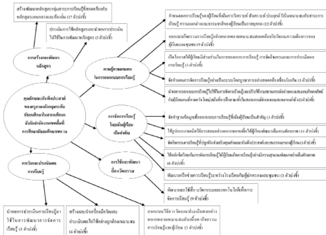
รูปที่ 1 กรอบแนวคิดในการวิจัย

เป็นข้อคำถามความคิดเห็นเกี่ยวกับคุณลักษณะอันพึงประสงค์ของครูภาษาอังกฤษ โดยมีค่าความเชื่อมั่นจำแนกรายด้าน ดังนี้ 1) การสร้างและพัฒนาหลักสูตร เท่ากับ .972 2) ความรู้ความสามารถในการออกแบบการเรียนรู้ เท่ากับ .989 3) การจัดการเรียนรู้ที่เน้นผู้เรียนเป็นสำคัญ เท่ากับ .989 4) การใช้และพัฒนาสื่อ นวัตกรรม เทคโนโลยีเพื่อการจัดการเรียนรู้ เท่ากับ .971 และ 5) การวัดและประเมินผล การเรียนรู้ เท่ากับ .961 ซึ่งมีค่าความเชื่อมั่นโดยรวม เท่ากับ .996