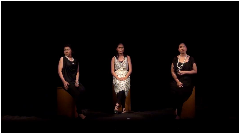
ภาพที่ 3 การแสดงละครเวทีร่วมสมัย เรื่อง “ลูกไม้ Why/วาย/วัย ปวง”

การตัดสินใจใด ๆ จึงเป็นหน้าที่ของพ่อและแม่ โดยเฉพาะเรื่องการเลือกคู่ครองที่ควรขึ้นอยู่กับความเห็นชอบของพ่อและแม่เป็นหลัก ทั้งนี้ด้วยเหตุที่ประเด็นสำคัญของพระราชนิพนธ์บทละครพูดเรื่องนี้ใกล้เคียงกับพระราชนิพนธ์บทละครพูดเรื่อง “ตบตา” ที่สะท้อนประเด็นคตินิยมความเชื่อของคนไทยในอดีตที่ว่าการทำตามในสิ่งที่พ่อและแม่ต้องการหรือวางแผนไว้ให้นั้น เป็นสิ่งที่สตรีในฐานะลูกสาวควรเชื่อฟังและปฏิบัติ ดังนั้นในประกอบสร้างบทละครขึ้นใหม่ คณะผู้วิจัยจึงมุ่งเน้นการถอดรื้อโครงเรื่องเดิมออกไปและตั้งคำถามต่ออนาคตของตัวละคร “โสภา” ว่าชีวิตหลังการแต่งงานของเธอจะเป็นเช่นไร และเมื่อเธอมีลูกเธอจะทำหน้าที่แม่อย่างไร ในสภาพแวดล้อมของสังคมปัจจุบันที่ผู้หญิงมีบทบาทมากขึ้นในสังคม