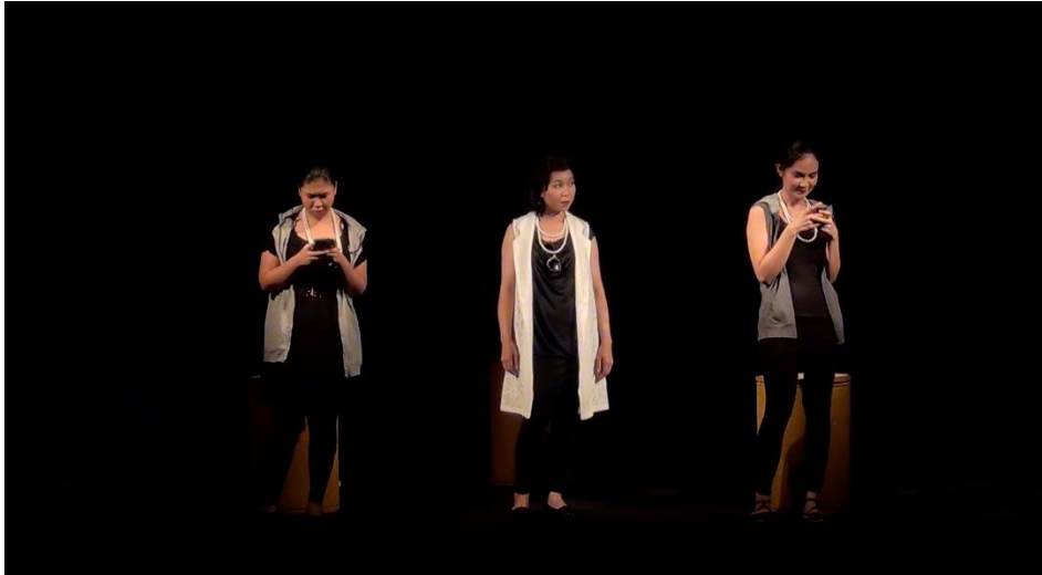
ภาพที่ 1 การแสดงละครเวทีร่วมสมัย เรื่อง “ลูกไม้ Why/วาย/วัย ปวง”

ปัจจุบัน ที่สามารถพูดคุยถึงความรู้สึกของตนเองให้ผู้ชมได้รับรู้ได้ โดยยังรักษาประเด็นเรื่องการพูดโกหก หลอกลวงและการพูดโอ้อวด เพื่อให้ผู้อื่นเห็นว่าตนเองนั้นเป็นคนที่มีความมุ่งมั่นและเป็นบุคคลที่มีชื่อเสียงในสังคมไว้ เนื่องจากเป็นประเด็นที่คณะผู้วิจัยมองว่ามีความสากลและพบเห็นได้ในทุกยุคทุกสมัย