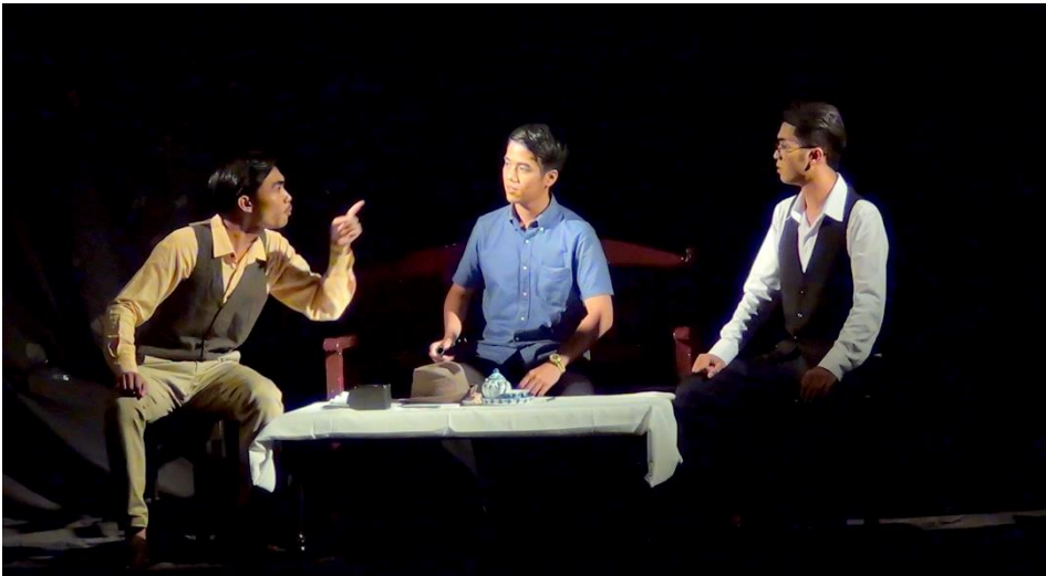
ภาพที่ 2 การแสดงละครเวทีร่วมสมัย เรื่อง “ลูกไม้ Why/วาย/วัย ปวง”

ไม่จำเป็นต่อประเทศ แต่ผู้ปกครองประเทศควรผลักดันให้ผู้ที่มีความรู้ในศาสตร์ด้านต่าง ๆ จากต่างประเทศเข้ามา มีบทบาทในการบริหารประเทศในตำแหน่งต่าง ๆ มากกว่า คณะผู้วิจัยพบว่าประเด็นเรื่องการให้สิทธิแก่สตรีในการตัดสินใจ โดยเฉพาะด้านการเลือกคู่ครองนั้น เป็นประเด็นที่น่าสนใจ ซึ่งหากพิจารณาตามบริบทของสังคมไทย ปัจจุบัน ก็พบว่าบทบาทของสตรีในปัจจุบันสะท้อนให้เห็นถึงความเปลี่ยนแปลงอย่างชัดเจน ในปัจจุบันสตรีสามารถเลือกตัดสินใจได้ด้วยตนเอง มีสภาพการณ์แห่งการเป็นผู้นำ และได้รับการยอมรับจากสังคมเทียบเท่ากับผู้ชาย