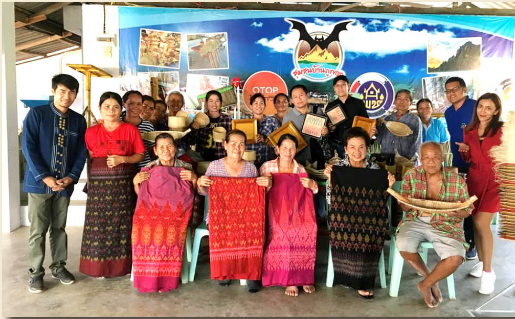
ภาพที่ 16 การติดตามและประเมินผลการดำเนินงานจากผู้ทรงวุฒิ

สวยงาม 4) หลังจากทอเสร็จแล้วควรนำไปแปรรูปเป็นสินค้าอื่นๆ เช่น ตัดเย็บเสื้อผ้าสำเร็จรูป ทำของที่ระลึก 5) ชุมชนควรมีสถานที่ผลิตที่ชัดเจน และควรตั้งกลุ่มเป็นวิสาหกิจชุมชน และผลการประเมินความพึงพอใจผู้เข้าร่วมกิจกรรม ดังตารางที่ 2