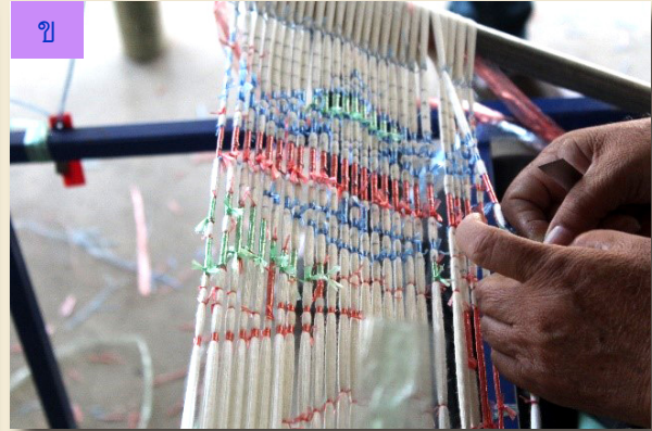
ภาพที่ 13 ก) การกำหนดขนาดลวดลายมัดหมี่ ข) เชือกฟางมัดลวดลายตามแบบที่กำหนด