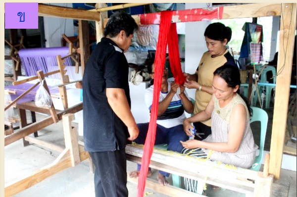
ภาพที่ 15 ก) พิมพ์ผ้า (ข) การสืบทอดเส้นด้ายยืน