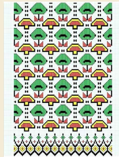
ภาพที่ 7 แบบร่างลวดลายผ้าทอ ลวดลายเห็ดโคน