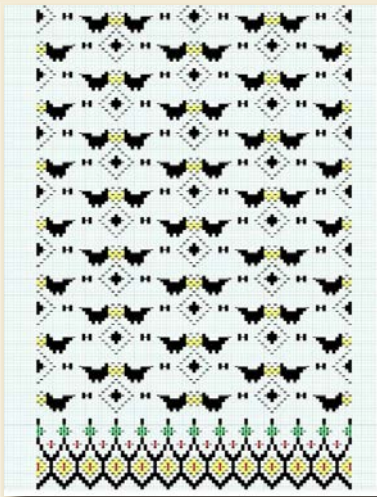
ภาพที่ 9 แบบร่างลวดลายผ้าทอ ลวดลายอีเกีย (ลายค้ำดาว)