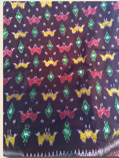
ภาพที่ 20 ผลิตภัณฑ์ต้นแบบลวดลายค้างคาว (อีเกีย)