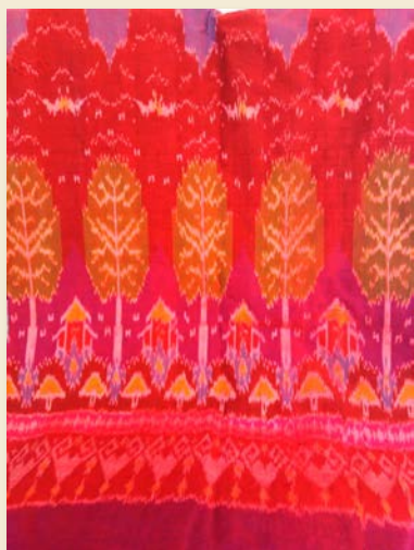
ภาพที่ 19 ผลิตภัณฑ์ต้นแบบลวดลายต้นสักอายุ 700 ปี