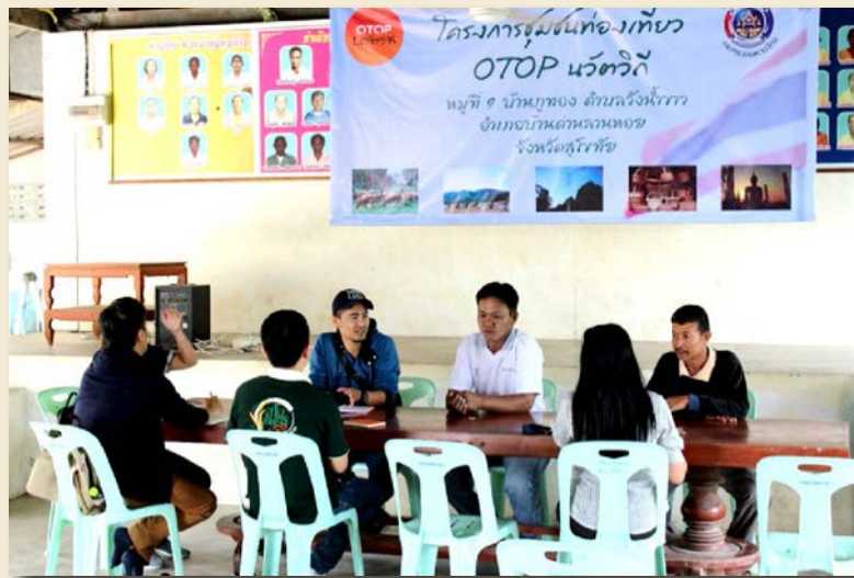
ภาพที่ 1 การประชุมและการเก็บข้อมูลเชิงพื้นที่ของชุมชนเมื่อวันที่ 18 พฤศจิกายน 2561 ณ ศาลาเอนกประสงค์บ้านภูทอง

การพัฒนาผลิตภัณฑ์ผ้าทอเชิงปฏิบัติการแบบมีส่วนร่วมของชุมชนบ้านภูทอง อำเภอบ้านด่านลานหอย จังหวัดสุโขทัย กระบวนการดำเนินการวิจัยครั้งนี้ ผู้วิจัยได้ดำเนินการตามกรอบการวิจัย ดังภาพที่ 3