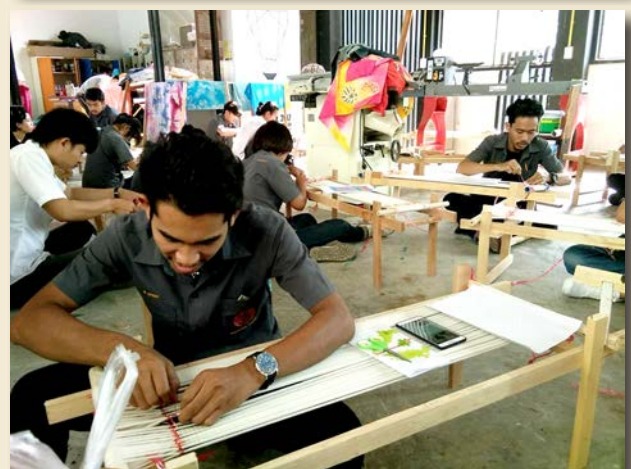
ภาพที่ 21 การบูรณาการการเรียนการสอนกับการวิจัย ณ อาคารปฏิบัติการสาขาวิชาออกแบบผลิตภัณฑ์อุตสาหกรรม