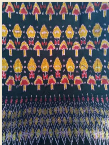
ภาพที่ 18 ผลิตภัณฑ์ต้นแบบลวดลายเห็ดโคน

นอกจากนี้ ผู้วิจัยยังบูรณาการการเรียนการสอนกับงานวิจัยเพื่อให้นักศึกษาได้เรียนรู้ทักษะกระบวนการวิจัยและแก้ไขปัญหาให้กับชุมชน จากการเข้าไปสนทนาร่วมกับกลุ่มชุมชน การออกแบบลวดลายมัดหมี่ การค้นหมี และการย้อมผ้าทอ ซึ่งกิจกรรมต่างๆ ทำให้นักศึกษาตระหนักถึงความสำคัญของชุมชนอันเป็นถิ่นบ้านเกิดของนักศึกษา ดังภาพที่ 21