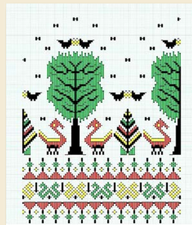
ภาพที่ 8 แบบร่างลวดลายผ้าทอ ลวดลายต้นสัก