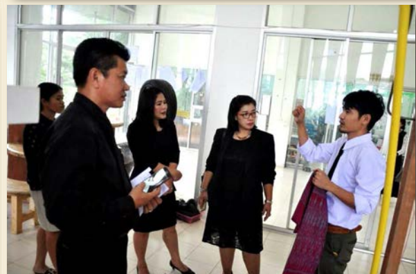
ภาพที่ 17 การให้ความรู้และการบรรยายการออกแบบผ้าทอ ณ ศาลาเอนกประสงค์บ้านภูทองและห้องจัดนิทรรศการ สาขาวิชาออกแบบผลิตภัณฑ์อุตสาหกรรม