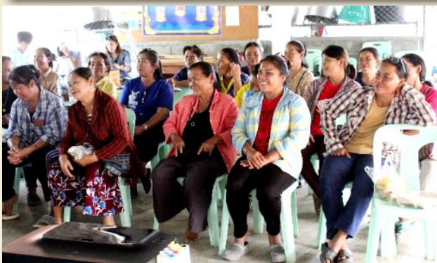
ภาพที่ 10 การบรรยายแนวทางการพัฒนาผลิตภัณฑ์ผ้าทอจากผู้เชี่ยวชาญด้านผ้าทอ

กิจกรรมที่ 2 การถ่ายทอดองค์ความรู้ในการออกแบบลวดลายผลิตภัณฑ์ผ้าทอ กระบวนการออกแบบลวดลายเริ่มจากการสนทนาร่วมกับผู้ผลิตผ้าทอ เพื่อหาแรงบันดาลใจและนำ