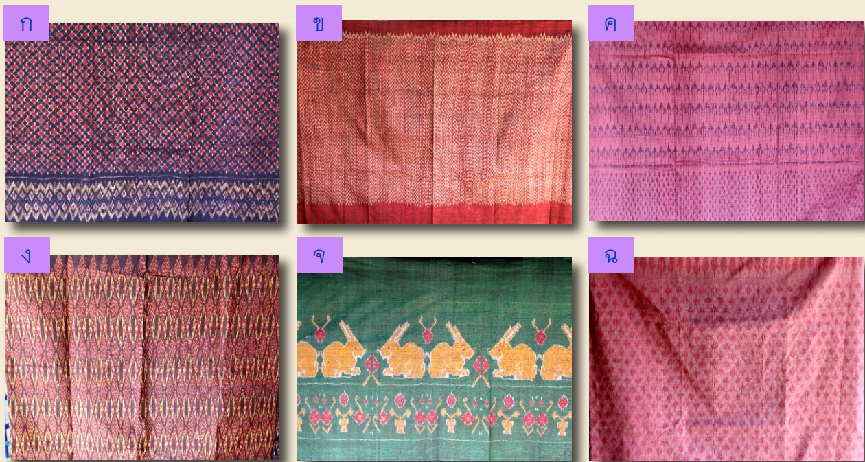
ภาพที่ 2 รูปแบบลวดลายดั้งเดิมผ้าทอบ้านภูทอง ก) ลายดอกพิกุล ข) ลายบั๊กจับ ค) ลายดอกกฐน ง) ลายสามเหลี่ยมชั้นพื้นหรี จ) ลายกระต่าย ฉ) ลายต่างแห