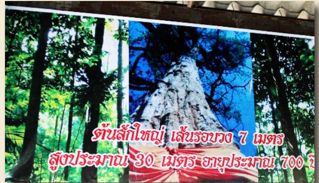
ภาพที่ 5 ต้นสักใหญ่อายุ 700 ปี ในพื้นที่ป่าชุมชน