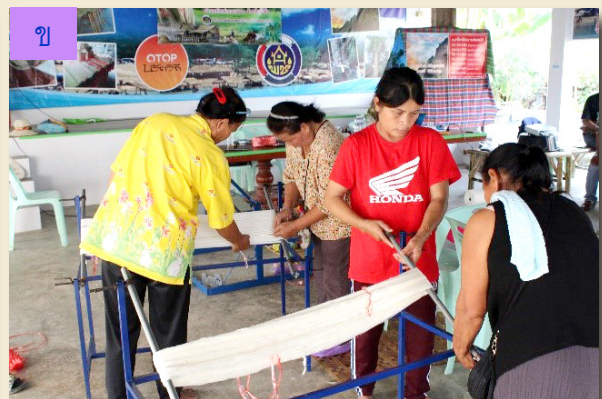
ภาพที่ 12 ก) การค้นหาเส้นด้ายพุ่งสำหรับการมัดลวดลาย ข) การนำเส้นด้ายเข้าอุปกรณ์มัดลวดลาย

กิจกรรมที่ 4 การติดตามและประเมินผลกิจกรรมการพัฒนาผลิตภัณฑ์ผ้าทอ หลังจากการดำเนินกิจกรรมแล้วเสร็จในวันที่ 8 มีนาคม พ.ศ. 2562 ผู้วิจัยร่วมกับผู้ทรงคุณวุฒิสำรวจ