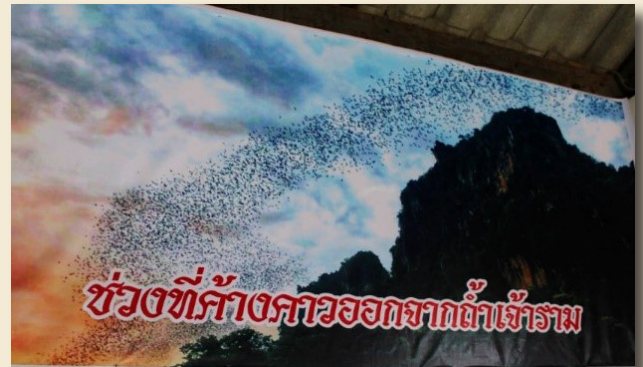
ภาพที่ 6 ผู่ค้างคาวอาศัยอยู่ในถ้ำเจ้าราม