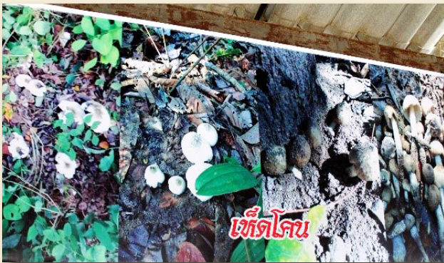
ภาพที่ 4 เห็ดโคนที่ขึ้นเองตามธรรมชาติในชุมชนบ้านภูทอง

จากการสรุปแนวคิดเพื่อสร้างแรงบันดาลใจในการออกแบบลวดลายผ้าทอ เพื่อให้ชุมชนเห็นภาพลวดลายผ้าทอในเบื้องต้น ซึ่งแรงบันดาลใจที่นำมาใช้ในการออกแบบลวดลายผ้าทอมี 3 แนวคิด ดังนี้