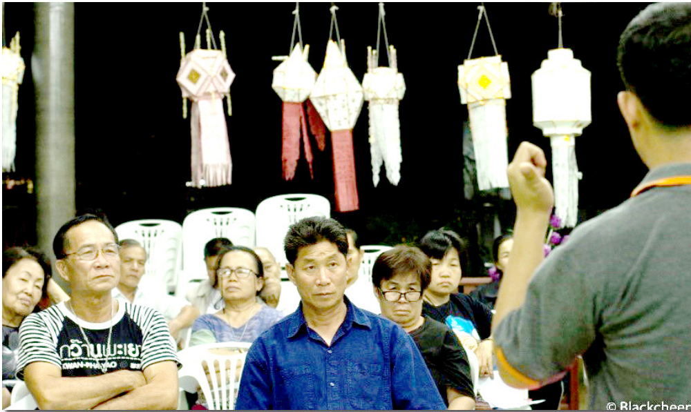
ภาพที่ 1 การประชาคมกลุ่มผู้นำชุมชน และกลุ่มนักแสดง ในตำบลบ้านต๋อน

2) สร้างความเข้าใจกับปราชญ์ชุมชนต้นแบบในการถ่ายทอด โดยถ่ายทอดครั้งละ 1 ท่อนเพลง และผู้วิจัยถอดบทเรียนแล้วตรวจสอบกับปราชญ์ชุมชนว่าทำนองเพลงที่ถอดบทเรียนออกนั้นถูกต้องหรือไม่