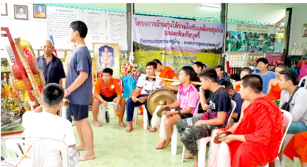
ภาพที่ 2 การถ่ายทอดองค์ความรู้การตีกลองปู่จาจากปราชญ์ชุมชนและผู้วิจัย