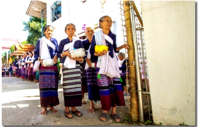
ภาพที่ 5 การใช้ถุงย่ามในชีวิตประจำวันของคนในชุมชน

3) การฝึกปฏิบัติการพัฒนาผ้าทอลายโกเป็นสินค้าทางวัฒนธรรม โดยเริ่มจากกระบวนการเตรียมเส้นด้าย การออกแบบลวดลายที่เป็นเอกลักษณ์แต่ยังคงพื้นฐานของลายโกที่เป็นลายผ้าทอเฉพาะถิ่น การทอผ้าตามรูปแบบที่กำหนด และการตัดเย็บและพัฒนาสินค้าทางวัฒนธรรม โดยดำเนินการฝึกอบรมวิธีทำตุ๊กตาแม่อุ้ยกับหลานสาวและถุงย่ามลายโกให้กับชุมชน ผู้เข้าร่วมอบรมแบ่งเป็น 3 กลุ่มช่วงอายุ ได้แก่ เยาวชน กลุ่มแม่บ้านและผู้สูงอายุ โดยเชิญวิทยากรที่มีความเชี่ยวชาญด้านการส่งเสริมและพัฒนาผลิตภัณฑ์ชุมชนมาเป็นผู้ถ่ายทอดให้ความรู้เทคนิค และวิธีการทำ และได้รับการอนุเคราะห์จากวัดดอนไชยเป็นสถานที่ฝึกปฏิบัติการ (ภาพที่ 8)