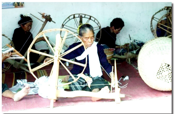
ภาพที่ 2 การทอผ้าที่เป็นวิถีชีวิตของคนในชุมชนบ้านแม่ลอยหลวง