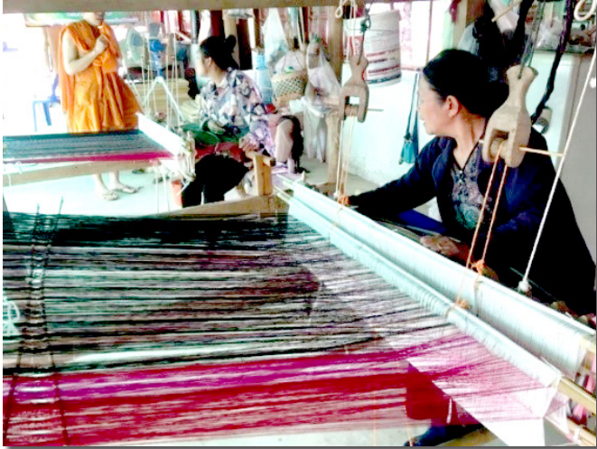
ภาพที่ 3 การทอผ้าของกลุ่มผู้สูงอายุในชุมชน