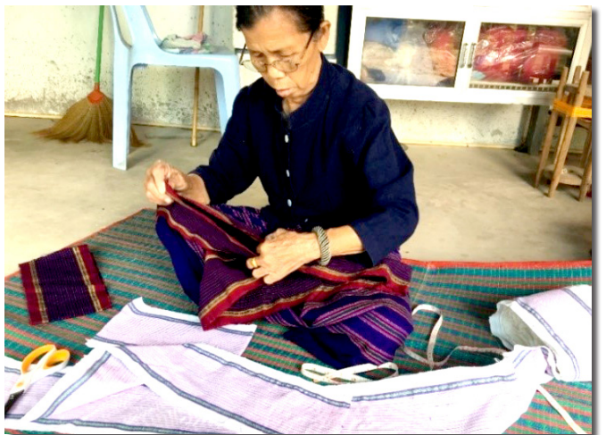
ภาพที่ 7 การตัดเย็บถุงย่ามจากผ้าทอลายโก