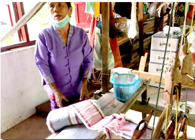
ภาพที่ 6 กี่ทอผ้าและผ้าทอลายโกที่ปรับขนาดเพื่อนำไปทำถุงย่าม