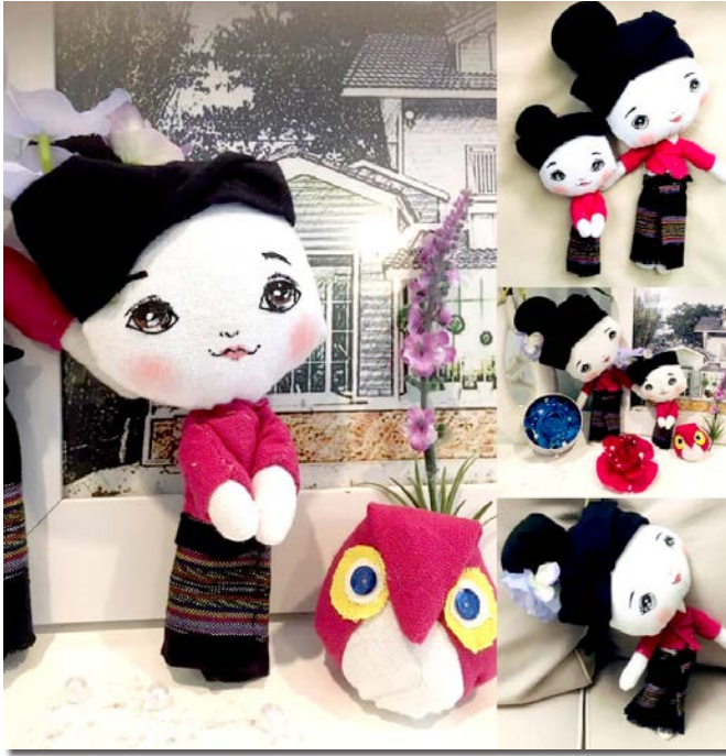
ภาพที่ 4 ตุ๊กตาแม่อุ้ยกับหลานสาว

ลวดลายที่สวยงาม (ภาพที่ 7) เพิ่มพูนห้อยท้ายถุงย่าม และติดแผ่นเงินดูนลายเพื่อให้เกิดความสวยงามและโดดเด่น ถุงย่ามลายโกจึงเป็นสินค้าทางวัฒนธรรมสำหรับการใช้สอย สะดวกในการพกพาและมีความสวยงาม มีขนาดที่เหมาะสมสำหรับการใช้งานของทุกเพศทุกวัย สามารถเป็นของฝากและของที่ระลึกได้