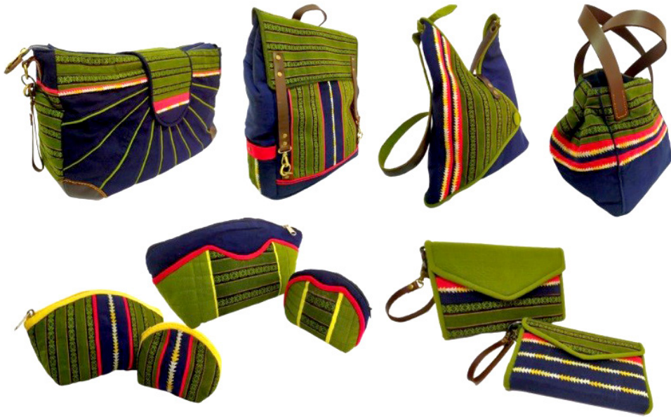
ภาพที่ 6 ต้นแบบผลิตภัณฑ์ชุดกระเป๋าสำหรับสุภาพสตรี