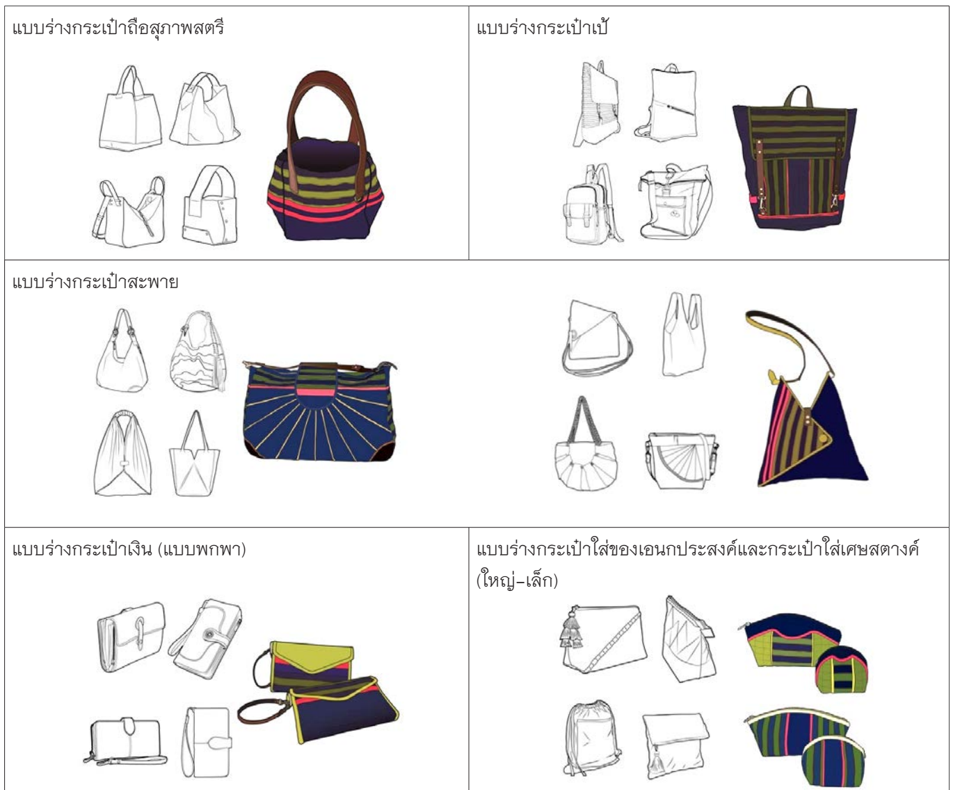
ตารางที่ 2 การออกแบบผลิตภัณฑ์ร่วมสมัยจากผ้าทอพื้นเมืองไท-ยวน จังหวัดสระบุรี

ขั้นที่ 5 การสร้างแพทเทิร์นและผลิตต้นแบบบรรจุภัณฑ์และผลิตภัณฑ์ การสร้างต้นแบบจากกระดาษ เพื่อให้ชุมชนได้ศึกษาลักษณะของผลิตภัณฑ์ต่อสรีระและพฤติกรรมการใช้งานของผู้บริโภค เป็นการจตุวางแพทเทิร์นของรูปแบบ การวางลายบนผ้า การใช้สีเส้นให้งานดูมีคุณค่า ดูพรีเมียม ตามสัดส่วนการใช้งานและความงามที่เกิดจากความเหมาะสมของการสร้างสรรค์ต่อรูปแบบใหม่ของผลิตภัณฑ์ อีกทั้งมีการประเมินผลการออกแบบกับศักยภาพของกลุ่มตัดเย็บผ้าในการต่อยอดสำหรับการผลิตจริงเพื่อการจำหน่ายต่อไป ดังนั้น การออกแบบโครงสร้างบรรจุภัณฑ์ต้องเป็นรูปทรงที่มาตรฐานเป็นทรงเหลี่ยมที่ง่ายต่อการจัดวางซ้อนทับกัน ระบบการพิมพ์ที่ผลิตควรพิมพ์ได้หลายสี (ภาพสี่สี) เป็นระบบออฟเซตที่ต้องการความงาม คมชัด ในการออกแบบกราฟิกบรรจุภัณฑ์เป็นการนำอัตลักษณ์ผ้าทอไท-ยวน สระบุรี คือ ผ้าทอยกมุก มาใช้