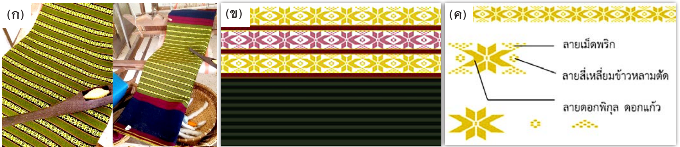
ภาพที่ 2 ลักษณะลวดลายผ้าทอยกมุก (ก) ลักษณะผ้าทอพื้นเมืองไท-ยวน สระบุรี ลวดลายยกมุก 8 ตะกรอ (ขา) (ข) ภาพเวกเตอร์รูปแบบการจัดวางลายผ้าทอยกมุก และ (ค) ลักษณะลายและชื่อเรียกลายประกอบบนผืนผ้า