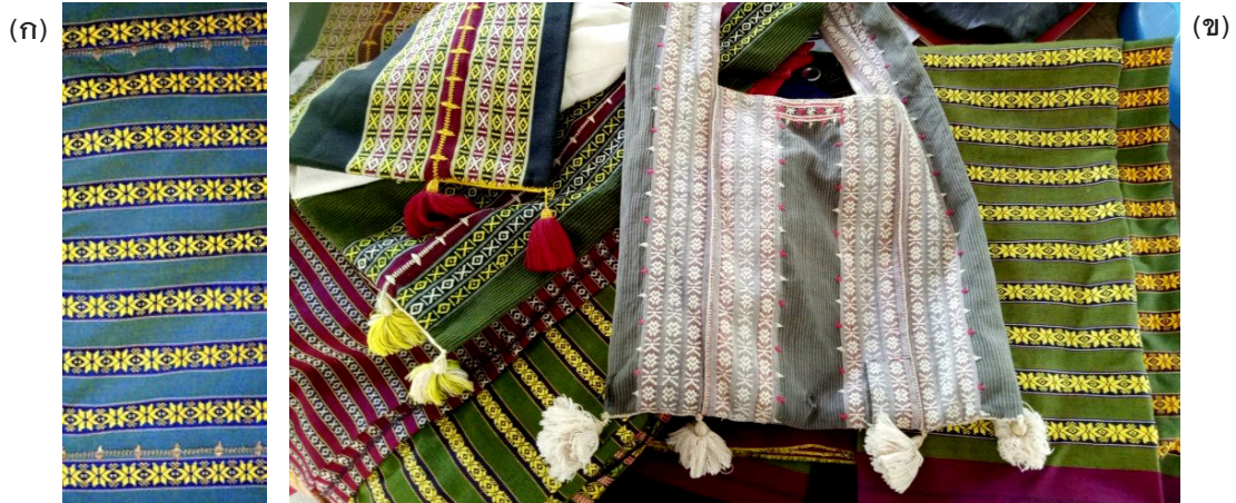
ภาพที่ 1 ผ้าทอพื้นเมืองชาวไท-ยวน จังหวัดสระบุรี (ก) ลักษณะรูปแบบของผ้าทอยกมุก จังหวัดสระบุรี และ (ข) ผลิตภัณฑ์จากผ้าทอพื้นเมืองชาวไท-ยวน สระบุรี (ถุงย่าม-ผ้าซิ่น)

สระบุรี จะดำเนินการภายในกลุ่มสตรีทอผ้าบ้านต้นตาล จังหวัดสระบุรี และบางส่วนมักกลับไปทอที่บ้านแล้วนำมารวบรวมจำหน่ายที่กลุ่มชุมชน ซึ่งผ้าส่วนใหญ่เป็นผ้าซิ่น ผ้านุ่งสำเร็จ ถุงย่าม มีทั้งรูปแบบลวดลายทอดั้งเดิมและลวดลายประยุกต์ แต่มีรูปแบบที่ไม่หลากหลาย สมาชิกกลุ่มทอผ้าส่วนใหญ่มีอายุ 45 ปีขึ้นไป ผลิตงานแบบวันต่อวัน จำนวนไม่มากนัก ขาดการคิดค้นงานสร้างสรรค์ และเนื่องจากอยู่ในวัยสูงอายุ จึงไม่มีพื้นฐานด้านการออกแบบ การตัดเย็บและรูปแบบการใช้งานที่ไม่หลากหลาย การผลิตงานทอผ้ายังยึดติดกับรูปแบบเดิม ๆ ทำให้การแปรรูปหรือการพัฒนาในรูปแบบผลิตภัณฑ์ขาดความแปลกใหม่