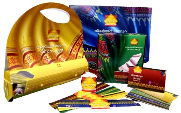
ภาพที่ 3 ต้นแบบบรรจุภัณฑ์จากผ้าทอพื้นเมืองไท-ยวน สระบุรี

จิปาละต่าง ๆ และ 2) ตุ๊กตาหอมประดับ เป็นตุ๊กตาที่ใช้ประดับตกแต่งห้องและวางตามมุมต่าง ๆ ที่เกิดกลิ่นอับและความชื้น ช่วยดูดกลิ่นและช่วยกระจายความหอมของพืชสมุนไพร ซึ่งการคัดเลือกการฝึกอบรมพิจารณาจากระยะเวลาการผลิตสินค้าที่ไม่ยาวนาน ไม่มีความซับซ้อน กระบวนการผลิตไม่ยุ่งยากสำหรับสมาชิกกลุ่มสตรีทอผ้า และต้นทุนการผลิต และการลงทุนที่ไม่สูงมาก และง่ายแก่การตัดสินใจของกลุ่มเป้าหมาย การฝึกอบรมเป็นการเพิ่มทักษะการตัด การวางแบบแพทเทิร์นด้วยเทคนิคการจัดวางผ้าแบบสลับสี สลับลายให้เกิดการผสมผสานของสี ลวดลายบนผืนผ้า ใช้ผ้าทอยกมุกและผ้าทอสีพื้นเรียบ ๆ แบบ 2-3 ตะกรอ เข้ามาร่วมด้วย และใช้วัสดุประกอบอื่น ๆ เช่น เส้นหนังแท้ หมุดตอก ตาไก่ หมุดโลหะ ชิบทอง-เงิน ด้ายเย็บหนัง ลูกบิดสี รีบบิ้น และผ้าแคนวาสสำหรับบุภายใน เพื่อให้งานเกิดมิติของผลงาน กระบวนการผลิตการขึ้นโครงสร้างแบบจากมือและใช้การเย็บจักรอุตสาหกรรม