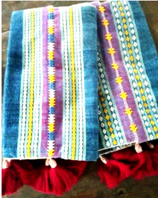
ภาพที่ 4 การเย็บปักเดินเส้นลายกำปี่ กำแป้อ (ผีเสื้อ) อัตลักษณ์ของชาวไท-ยวน สระบุรี

ช่วยให้เกิดความแข็งแรง คงทน มีการเย็บ การใช้การตกแต่งด้วยเทคนิคการประดิษฐ์จากงานฝีมือช่างชุมชนที่มีอัตลักษณ์ท้องถิ่น อาทิ การเย็บ ปักเดินเส้นลายกำปี่ กำแป้อ (ผีเสื้อ) (ภาพที่ 4 และ 5) และการถักและติดฟู่ยามลงบนผลิตภัณฑ์ ซึ่งเป็นการพัฒนาปรับเปลี่ยนวัสดุจากผืนผ้าทอให้กลายเป็นผลิตภัณฑ์รูปแบบใหม่ เกิดความงามที่แปลกตา สามารถใช้งานได้จริงในชีวิตประจำวัน การ