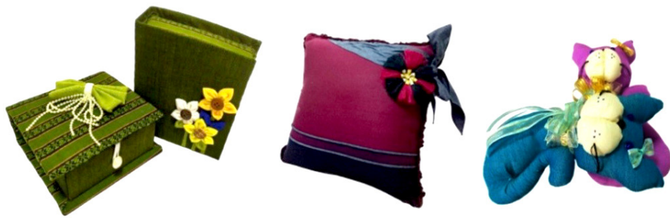
ภาพที่ 7 ต้นแบบผลิตภัณฑ์ของที่ระลึกสำหรับตกแต่งบ้าน

ทราบถึงที่มาของเรื่องราวทางวัฒนธรรมแก่กลุ่มเป้าหมาย ถือเป็นการเผยแพร่และประชาสัมพันธ์แก่สาธารณะชนต่อไป 2) ความพึงพอใจต่อรูปแบบผลิตภัณฑ์ด้านการรับรู้ในการออกแบบผลิตภัณฑ์จากทุนทางวัฒนธรรม มีความพึงพอใจอยู่ที่ระดับมากที่สุด โดยงานผลิตภัณฑ์ภาพรวม สามารถบ่งบอกอัตลักษณ์ชาวไทย-ยวน จังหวัดสระบุรี ได้จากการใช้รูปแบบ สี ลวดลายหลักของผ้าทอยกมุกและการตกแต่งร่วมบนผลิตภัณฑ์แบบดั้งเดิมพื้นถิ่น มีการประยุกต์แนวคิดสมัยใหม่ การใช้วัสดุและกระบวนการผลิตที่มีการประยุกต์ใช้เพิ่มเติมทำให้เกิดการผสมผสานคุณค่าทางวัฒนธรรมเดิกับนวัตกรรมเทคโนโลยีปัจจุบัน ทำให้ทราบว่าการมุ่งเป้าหมายเกิดความสนใจและพึงพอใจผลิตภัณฑ์ผ้าทอพื้นเมืองรูปแบบใหม่ แต่การเรียนรู้มีความซับซ้อนในการทำแพทเทิร์นของกระเป๋าต่าง ๆ มากกว่าการทำผลิตภัณฑ์ของที่ระลึกสำหรับตกแต่งบ้าน จึงต้องส่งเสริมทักษะการตัดเย็บให้มีความชำนาญมากขึ้น อาจมีการจัดตั้งกลุ่มอาชีพสำหรับเรียนรู้การตัดเย็บที่มี แบ่งการทำงานเป็นส่วน ๆ อาทิ ส่วนการทอผ้า (การทำวัตถุดิบการผลิต) ส่วนการตัดเย็บ-การวางแพทเทิร์น การตลาดเพื่อการจำหน่าย เพื่อลด