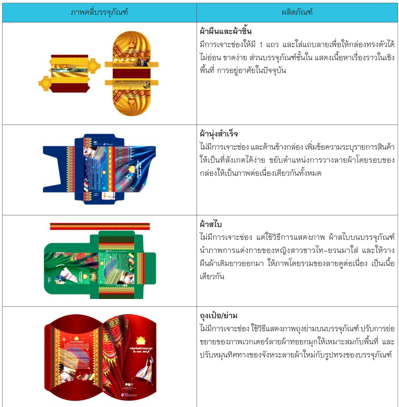
ตารางที่ 1 การออกแบบบรรจุภัณฑ์สำหรับผลิตภัณฑ์ผ้าทอไท-ยวน จังหวัดสระบุรี