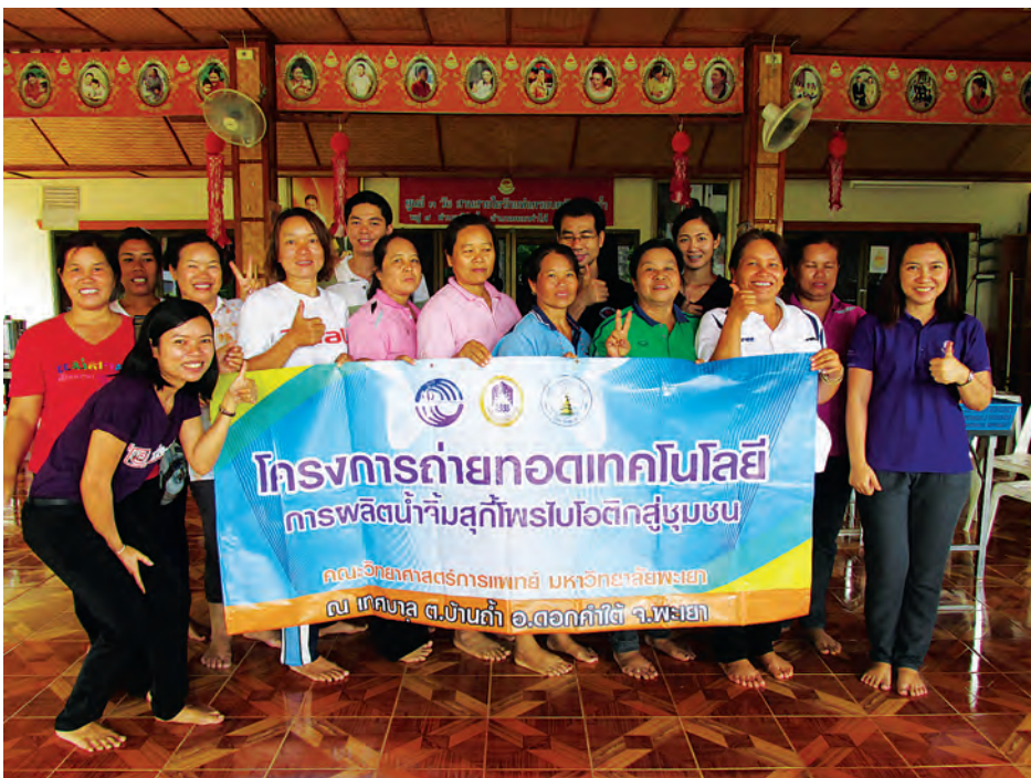
กลุ่มผู้ผลิตผลิตภัณฑ์น้ำจิ้มสุกที่หมักด้วยเชื้อโพรไบโอติก อ.ดอกคำใต้ จ.พะเยา

ทำให้เกิดกลิ่นและรสชาติของอาหารหมักซึ่งมีรสเปรี้ยวสามารถนำมาใช้เป็น ส่วนประกอบของน้ำจิ้มสุก เพื่อลดการใช้รสเปรี้ยวหรือกรดอะซิติกซึ่งเป็นสารสังเคราะห์ได้ นอกจากนี้เชื้อแบคทีเรียกรดแลคติกยังมีความสามารถในการสร้างสารแบคทีริโอซิน (bacteriocin) ซึ่งมีคุณสมบัติในการยับยั้งการเจริญเติบโตของจุลินทรีย์ก่อโรคนชนิดอื่นได้อันจะทำให้ได้น้ำจิ้มสุกโพรไบโอติกที่มีประโยชน์