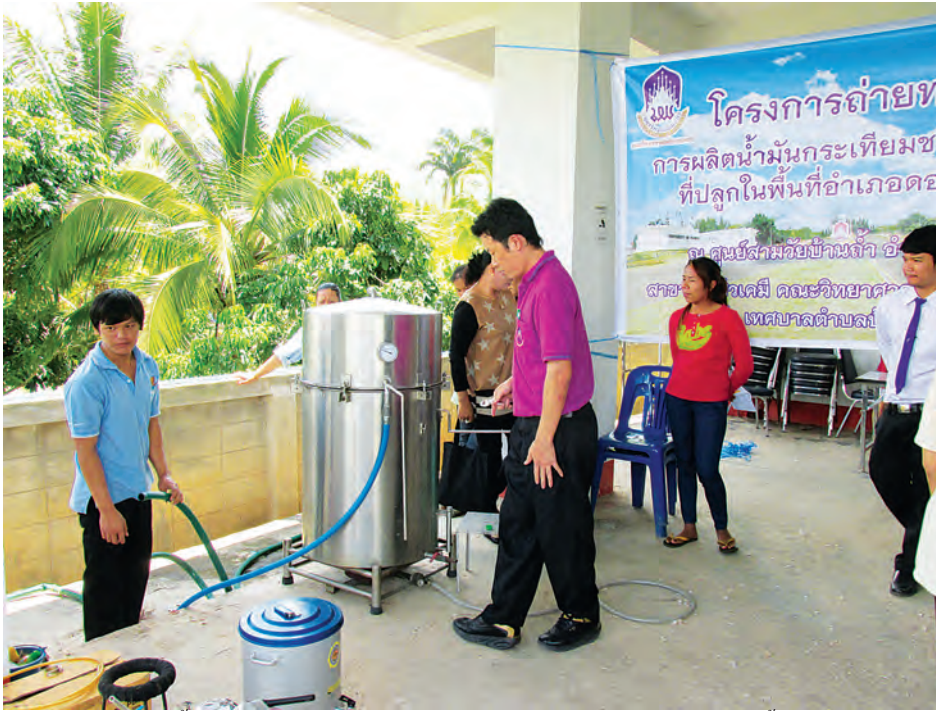
กระบวนการสกัดน้ำมันกระเทียม ก่อนที่จะนำกากกระเทียมที่เหลือมาใช้หมักด้วยเชื้อโพรไบโอติก

(ประมาณ 30°C) จากนั้นนำน้ำจิ้มที่ผลิตได้มาวิเคราะห์คุณภาพทางด้านกายภาพ ได้แก่ ค่าความเป็นกรด-ด่าง และความหนืด และวิเคราะห์ทางด้านจุลชีววิทยา ได้แก่ ปริมาณจุลินทรีย์ทั้งหมด, ยีสต์ และรา ตามวิธี FAD BAM (2001)