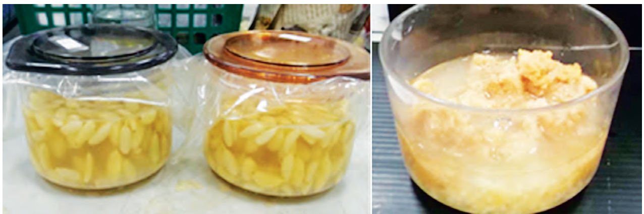
กระเทียมดองและกากกระเทียมหมักที่เตรียมไว้ในห้องปฏิบัติการ

ก) กระบวนการผลิตน้ำจิ้มสุกี้โพรไบโอติก อาศัยหลักการผลิตอาหารปลอดภัยขั้นพื้นฐานสำหรับกระบวนการผลิตน้ำจิ้มสุกี้ (GMP) คือ สถานที่ตั้งและอุปกรณ์การผลิตที่สะอาด มีการควบคุมการสุขาภิบาลของผู้ปฏิบัติงาน ได้แก่ การใส่หน้ากากอนามัย ถุงมือและหมวกคลุมผม ใช้วัตถุดับในท้องถิ่นเพื่อลดต้นทุนและยังเป็นการเพิ่มมูลค่าให้เกิดประโยชน์อีกทาง โดยมีวัตถุดิบสำหรับน้ำจิ้มสุกี้สูตรกว้างตั้ง ได้แก่ ซอสพริก น้ำตาลทราย น้ำส้มสายชู ซีอิ๊วขาว กากกระเทียมหมักด้วยเชื้อโพรไบโอติก