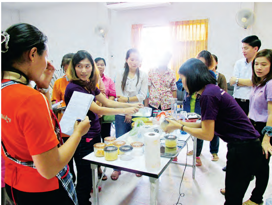
ฝึกปฏิบัติการดองกระเทียมและการหมักกระเทียมด้วยเชื้อโพรไบโอติก

ข) วิธีการพัฒนาสูตร (Product Test) ได้ศึกษาการผลิตน้ำจิ้มสุกึ่งสูตรวางตั้งและสูตรไหนโดยใช้กระเทียมหมักด้วยเชื้อโพรไบโอติกเป็นส่วนผสม ในกระบวนการหมักกากกระเทียมด้วยเชื้อโพรไบโอติกจะเกิดสร้างกรดแลคติกและกรดอินทรีย์อื่นๆ ขึ้นมาตามธรรมชาติทำให้เกิดกลิ่นและรสชาติของอาหารหมักซึ่งมีรสเปรี้ยวสามารถนำมาใช้เป็นส่วนประกอบของน้ำจิ้มสุกึ่งเพื่อทดแทนการใช้กระเทียมสดและน้ำกระเทียมดอง และลดการใช้ น้ำส้มสายชูหรือกรดอะซิติกซึ่งเป็นสารสังเคราะห์ได้ ซึ่งผลการพัฒนาสูตรน้ำจิ้มสุกึ่งสามารถผลิตน้ำจิ้มสุกึ่งได้