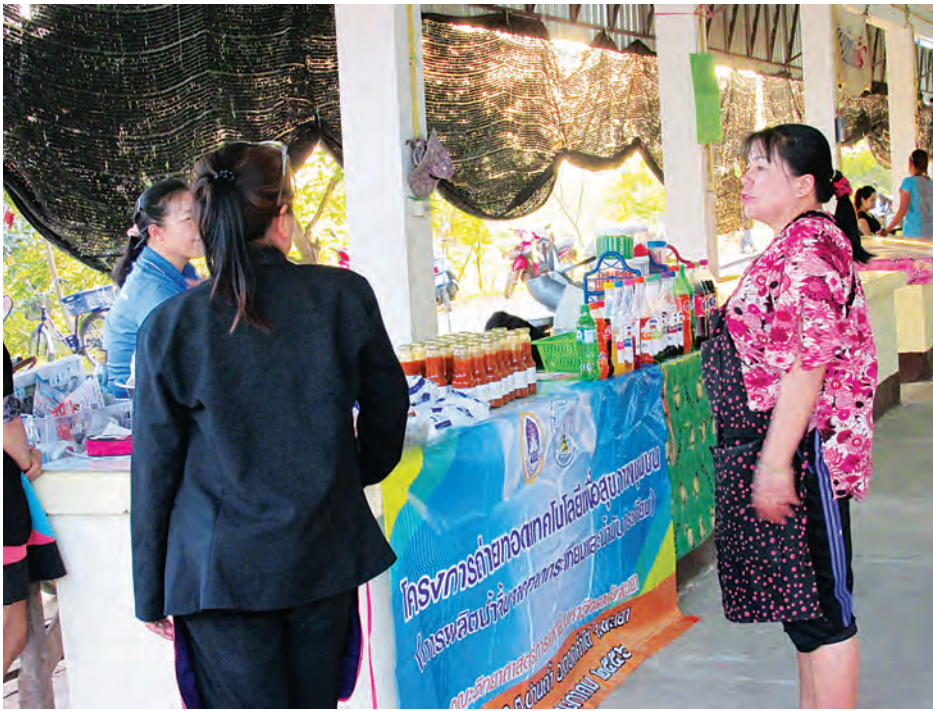
ผลิตภัณฑ์น้ำจิ้มสุกี้ที่นำไปจัดวางจำหน่ายที่ตลาดเทศบาลตำบลบ้านถ้ำ จังหวัดพะเยา

นำองค์ความรู้ที่ได้ไปผลิตผลิตภัณฑ์น้ำจิ้มสุกี้จากกากกระเทียมที่หมักด้วยเชื้อโพรไบโอติกที่มีคุณภาพและวางจำหน่ายภายในชุมชนเทศบาลเอง โดยมีการใช้วัตถุดิบในท้องถิ่นมาใช้เป็นส่วนประกอบด้วย มีการทำแผ่นพับประชาสัมพันธ์ข้อมูลเกี่ยวกับผลิตภัณฑ์น้ำจิ้มสุกี้โพรไบโอติกและข้อมูลด้านสุขภาพเกี่ยวกับโพรไบโอติกเพื่อกระตุ้นความสนใจของกลุ่มผู้บริโภคเป้าหมาย นับเป็นการส่งเสริมเศรษฐกิจชุมชนเทศบาล