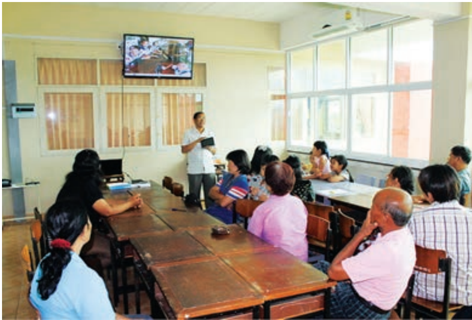
นำเสนอความคิดเห็นและวางแผนการเผยแพร่สื่อมัลติมีเดีย