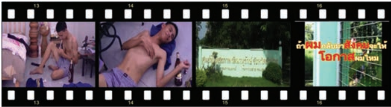
สื่อโฆษณาณรงค์ เรื่องโอกาส

3.4 สื่อโฆษณาณรงค์เรื่อง โอกาส เป็นการเสนอมุมมองการช่วยเหลือผู้ติดยาเสพติด และการให้โอกาสดับผู้เคยใช้ยาเสพติดให้สามารถกลับมาใช้ชีวิตในสังคมเหมือนเดิมได้ ดังนี้