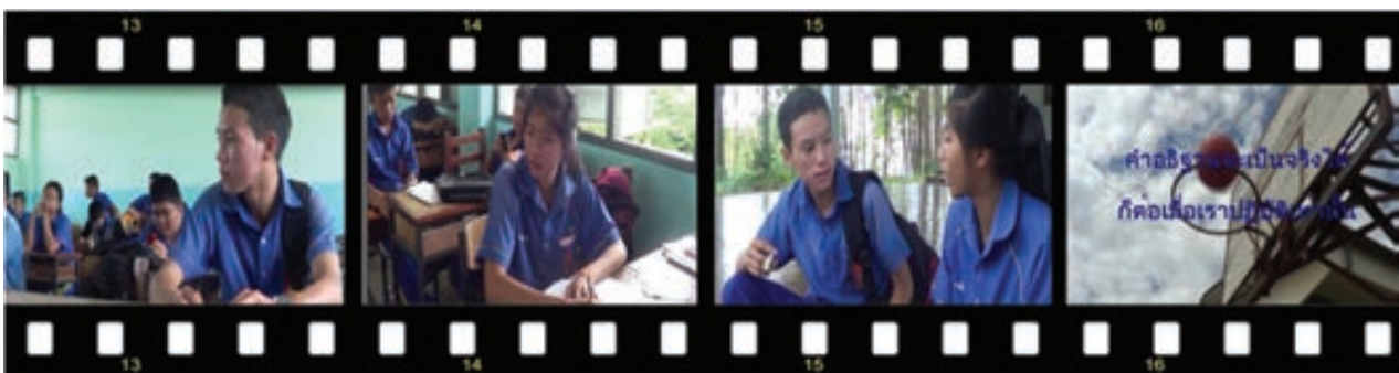
สื่อโฆษณาณรงค์ เรื่องคนรุ่นใหม่

3.2 สื่อโฆษณาณรงค์เรื่อง คนรุ่นใหม่ เป็นมุมมองการเปลี่ยนทัศนคติการใช้ยาเสพติด ได้ผลงานโฆษณาเรื่อง “คนรุ่นใหม่” นำเสนอการสูบบุหรี่ไม่ใช่ภาพลักษณ์ของคนรุ่นใหม่ ดังนี้