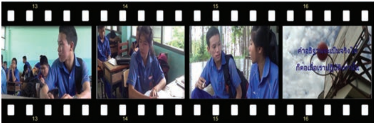
สื่อโฆษณาณรงค์ เรื่อง คำอธิษฐาน

3.1 สื่อโฆษณาณรงค์ เรื่อง คำอธิษฐาน เป็นมุมมองการใช้ยาเสพติดเพื่อแก้ปัญหาในวัยรุ่น ได้ผลงานโฆษณาเรื่อง “คำอธิษฐาน” นำเสนอการแก้ปัญหาพิศๆของวัยรุ่นด้วยยาเสพติดและการอธิษฐาน ดังนี้