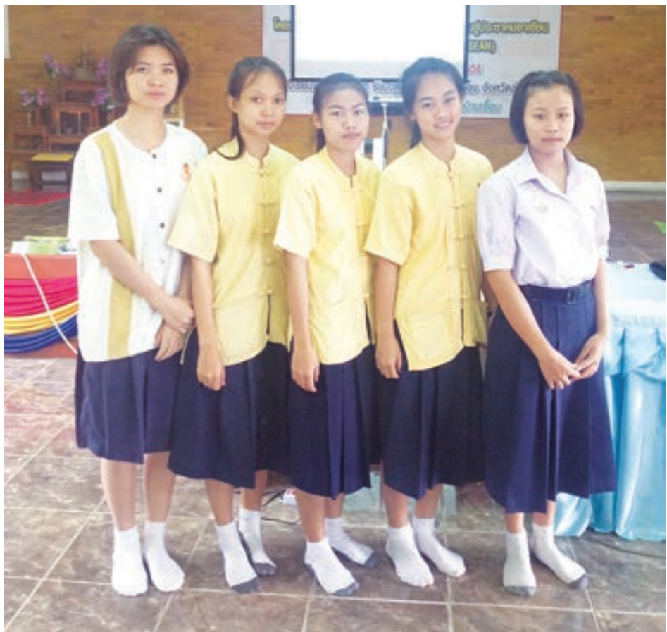
ทีมเยาวชนผลิตสื่อบ้านเอื้อม

เป็นร้อยละ 51.3 ปี 2553 ขณะเดียวกันกลุ่มเด็กและเยาวชนมีแนวโน้มเล่นการพนันมากขึ้น (แผนพัฒนาเศรษฐกิจและสังคมแห่งชาติ ฉบับที่ 11)ปัจจุบันการแพร่ระบาดของยาเสพติด เป็นปัญหาสำคัญที่ทำลายประเทศ ส่งผลกระทบต่อทั้งในระดับครอบครัว โรงเรียน ชุมชน เศรษฐกิจ สังคม และประเทศชาติ เกิดปัญหาอาชญากรรม ปัญหาสังคมขาดความปลอดภัยในชีวิตและทรัพย์สิน ในเขตพื้นที่ภาคเหนือ จังหวัดลำปางติดอันดับ ๓ ของพื้นที่ที่มีการแพร่ระบาดและพบปัญหาการติดยาเสพติด รองจาก เชียงใหม่ และเชียงราย ผลการปราบปรามยาเสพติดประจำปี 2555 ของตำรวจภูธรจังหวัดลำปาง ห้วงตั้งแต่ 1-28 กันยายน 2555 ผลการจับกุมภาพรวม ในรอบหนึ่งเดือนพบผู้ต้องหาครอบครองเพื่อจำหน่าย 150 ราย การจับกุมผู้เสพได้ 1,152 คน ส่วนรอบปี 2554-2555 ยึดจำนวนยาบ้าได้ทั้งหมดกว่า 2,454,000 เม็ด ยึดทรัพย์สินได้ทั้งหมด 72 ราย มีมูลค่ายึดทรัพย์สินทั้งหมด 45 ล้านบาทเศษ (เดลินิวส์, วันพุธที่ 11 กรกฎาคม 2555) สถานการณ์การค้าขายลักลอบขนยาเสพติดเกิดขึ้นจากทั้งคนในและคนนอกพื้นที่จังหวัดลำปาง มีรายงานจากเจ้าหน้าที่ตำรวจชุดสืบสวนลำปางว่า คาบตำรวจมนัส เสือโพธิ์ อายุ 42 ปี ผบ.หมู่งานจราจร สภ.ประจักษ์ฯ ทำการขน