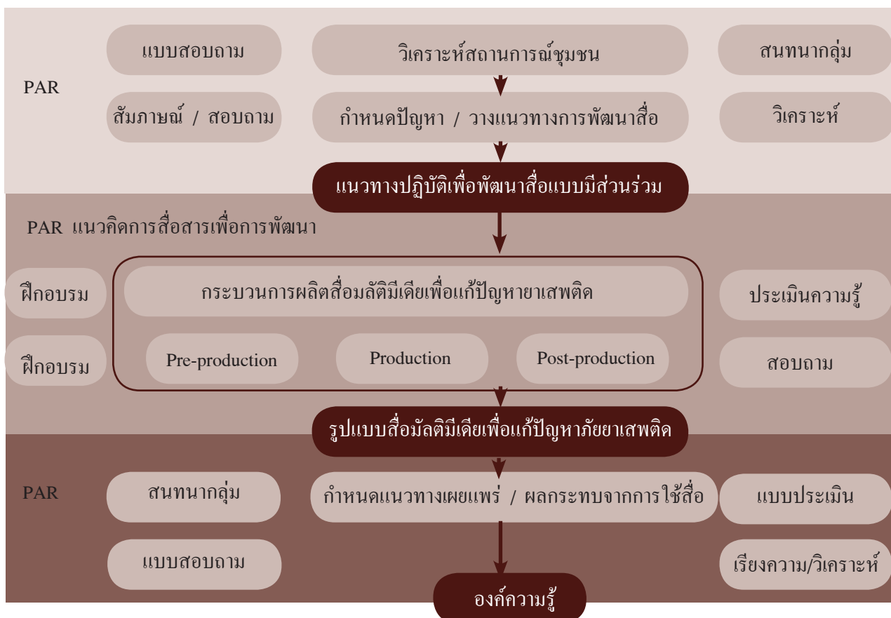
ภาพที่ 1 กรอบแนวคิดการวิจัย