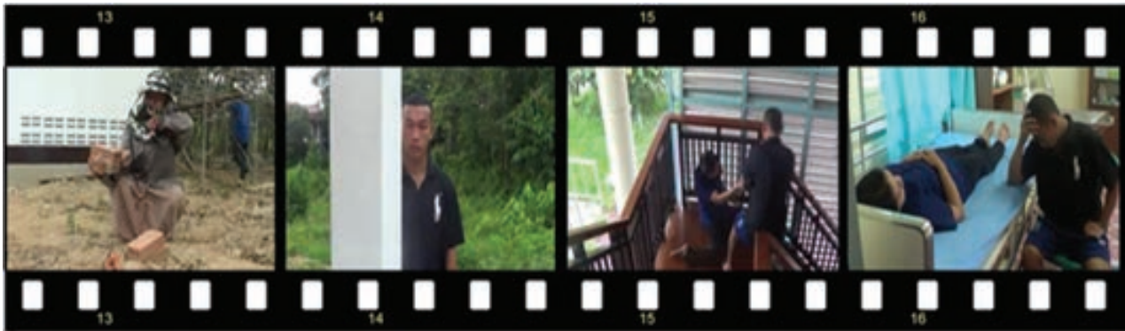
สื่อโฆษณาณรงค์ เรื่องทางเลือก

3.3 สื่อโฆษณาณรงค์เรื่อง ทางเลือก เป็นการเสนอภัยเสพยาเสพติดที่ส่งผลกระทบต่อครอบครัวและบุคคลที่รัก ดังนี้