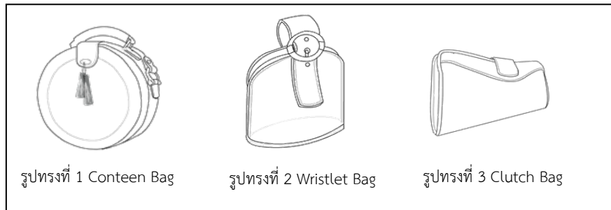
ภาพ 6 ภาพเปรียบเทียบรูปทรงกระเป๋าขนาดเล็ก

ผลการวิเคราะห์พบว่า รูปทรงกระเป๋าขนาดเล็กรูปทรงที่ 3 (Clutch Bag) มีระดับความเหมาะสมมากที่สุด ค่าเฉลี่ย 4.37