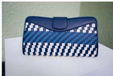
ภาพ 9 ภาพรูปลักษณ์ของกระเป๋าขนาดเล็ก รูปทรง Clutch Bag

จึงสรุปได้ว่า ผลการประเมินด้านความพึงพอใจของผู้บริโภคที่มีต่อรูปลักษณ์ของกระเป๋าขนาดกลาง รูปทรง Doctor's Bag มีระดับความพึงพอใจโดยรวมมากที่สุด ค่าเฉลี่ย 4.65