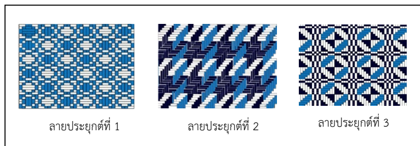
ภาพ 1 ภาพเปรียบเทียบลายประยุกต์ สำหรับออกแบบกระเป๋าขนาดใหญ่

1. ผลสรุปลวดลาย สำหรับออกแบบกระเป๋าขนาดใหญ่