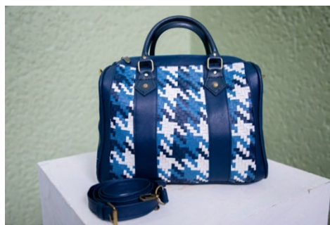
ภาพ 8 ภาพรูปลักษณ์ของกระเป๋าขนาดกลาง รูปทรง Doctor's Bag

จึงสรุปได้ว่า ผลการประเมินด้านความพึงพอใจของผู้บริโภคที่มีต่อรูปลักษณ์ของกระเป๋า ขนาดใหญ่ รูปทรง TOTE Bag มีระดับความพึงพอใจโดยรวมมากที่สุด ค่าเฉลี่ย 4.53