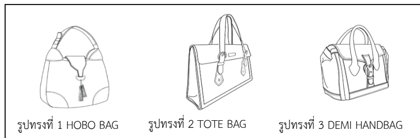
ภาพ 4 ภาพเปรียบเทียบรูปทรงกระเป๋าขนาดใหญ่

ผลการวิเคราะห์พบว่า รูปทรงกระเป๋าขนาดใหญ่ รูปทรงที่ 2 (TOTE Bag) มีระดับความเหมาะสมมากที่สุด ค่าเฉลี่ย 4.60