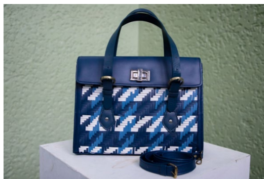
ภาพ 7 ภาพรูปลักษณะของกระเป๋าขนาดใหญ่ รูปทรง TOTE Bag

ผลการประเมินความพึงพอใจของผู้บริโภคที่มีต่อรูปลักษณะกระเป๋าหนัง โดยใช้เทคนิคการसान ได้แก่ผู้ประกอบการกระเป๋าหนัง 9 ท่าน และสุภาพสตรีที่มามีเลือกซื้อผลิตภัณฑ์กระเป๋าหนัง ณ ศูนย์แสดงสินค้าและการประชุมอิมแพคเมืองทองธานี ในงาน OTOP Midyear 2018 จังหวัดปทุมธานี จำนวน 100 ท่าน ผู้วิจัยได้แบ่งหัวข้อการประเมิน ออกเป็น 2 ด้าน คือ ด้านความงาม และด้านประโยชน์ใช้สอย ผลการประเมินด้านรูปทรงกระเป๋าขนาดกลาง ได้แก่ รูปทรง Doctor's Bag มีระดับความพึงพอใจโดยรวมมากที่สุด ค่าเฉลี่ย 4.65 รองลงมารูปทรงกระเป๋าถือขนาดใหญ่ รูปทรง Tote bag มีระดับความพึงพอใจโดยรวมมากที่สุด ค่าเฉลี่ย 4.53 และผลการประเมินด้านรูปทรงกระเป๋าขนาดเล็ก รูปทรง Clutch Bag มีระดับความพึงพอใจโดยรวมมากที่สุด ค่าเฉลี่ย 4.52 มีรายละเอียดผลการประเมินดังนี้