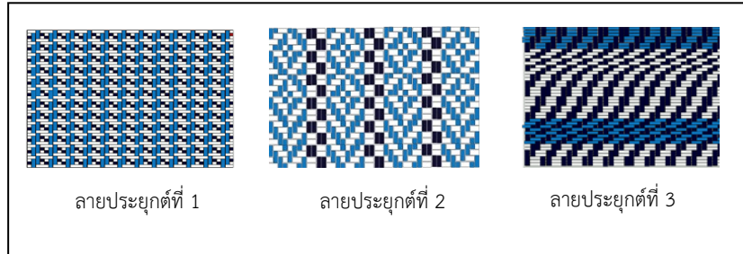
ภาพ 3 ภาพเปรียบเทียบลายประยุกต์ สำหรับออกแบบกระเป๋าขนาดเล็ก

ผลการวิเคราะห์พบว่า ลวดลายสำหรับออกแบบกระเป๋าขนาดเล็ก ลายประยุกต์ที่ 3 มีระดับความเหมาะสมมากที่สุด ค่าเฉลี่ย 4.73