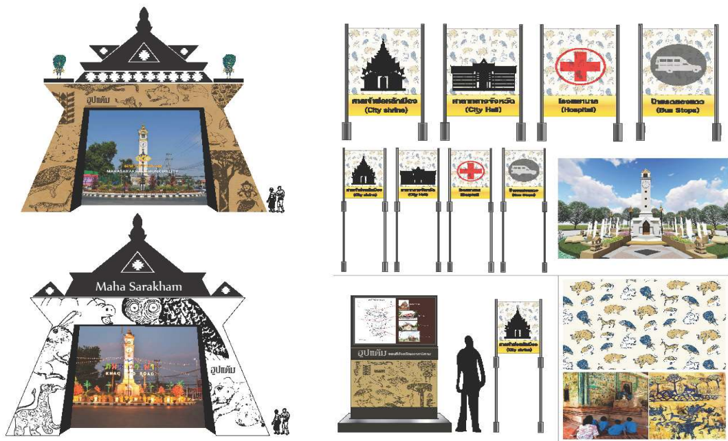
ภาพ 3 ต้นแบบกราฟิกสื่อสิ่งพิมพ์สุปแต้ม เป็นความงามที่ซ่อนอยู่ในส้มอีสานหรือก็คือภาพจิตรกรรมฝาผนังของโบสถ์ ภาพจิตรกรรมฝาผนังแบบอีสาน สะท้อนให้เห็นถึงภูมิปัญญาวิถีชีวิต และเรื่องราวในการดำเนินชีวิต