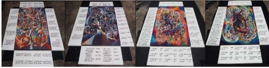
ภาพ 1 ผลงานโครงการศิลปนิพนธ์ยอดเยี่ยมทุนสร้างสรรค์ศิลปกรรม “ศิลป์ พีระศรี” ครั้งที่ 19 ประจำปี พ.ศ. 2562 ได้แก่โครงการวิจัยสร้างสรรค์ทัศนศิลป์กวีทรศน์ ชุดสังขารการปรุงแต่งประสบการณ์แห่งบุคคล “The Creation of Visual Arts: Mental Formations (Sankhara), the Formed of an Individual Experience” ทั้ง 4 ชุด