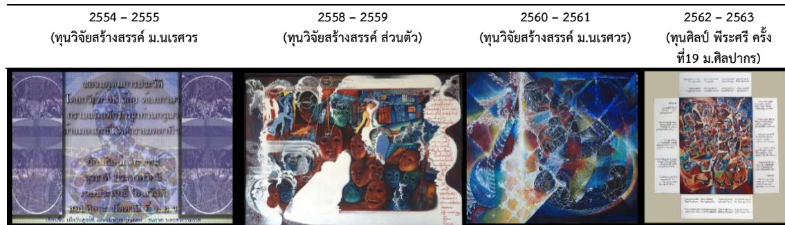
ภาพ 3 ตัวอย่างการวิจัยสร้างสรรค์งานทัศนศิลป์กวีทรศน์ 4 ชุด ที่ผ่านมาของผู้วิจัยสร้างสรรค์