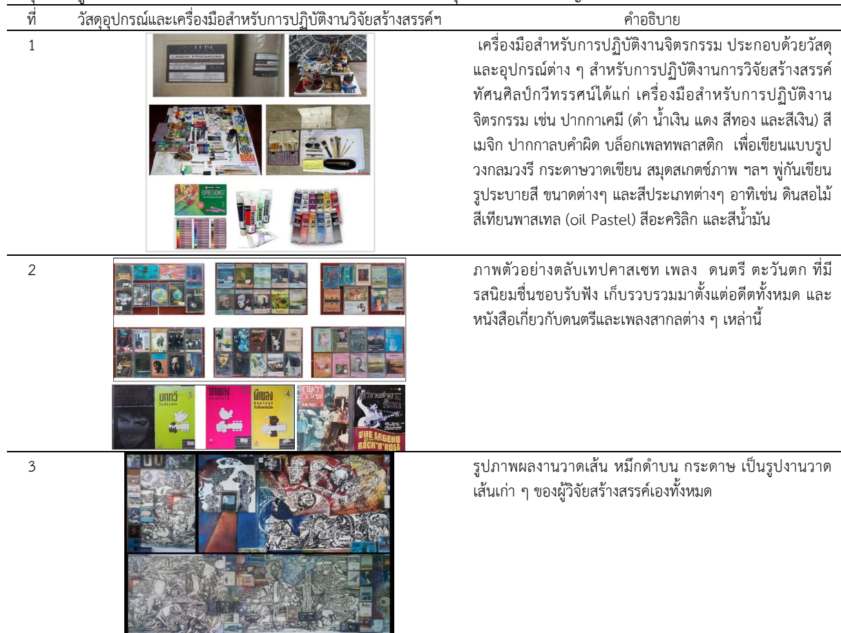
ภาพที่ 2 ตารางวัสดุอุปกรณ์ เครื่องมือสำหรับการปฏิบัติงาน