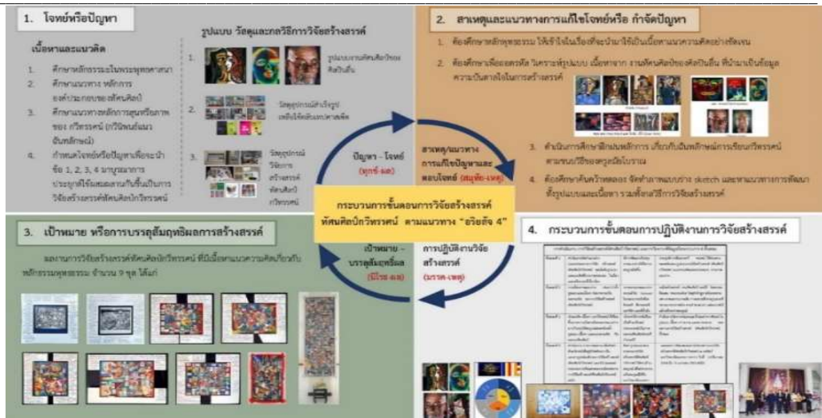
ภาพ 6 แสดงกระบวนการขั้นตอนการทำงานการวิจัยสร้างสรรค์ทัศนศิลป์กวีทรศน์ตามแนวทาง “อริยสัจ 4” จากหลักพุทธธรรม