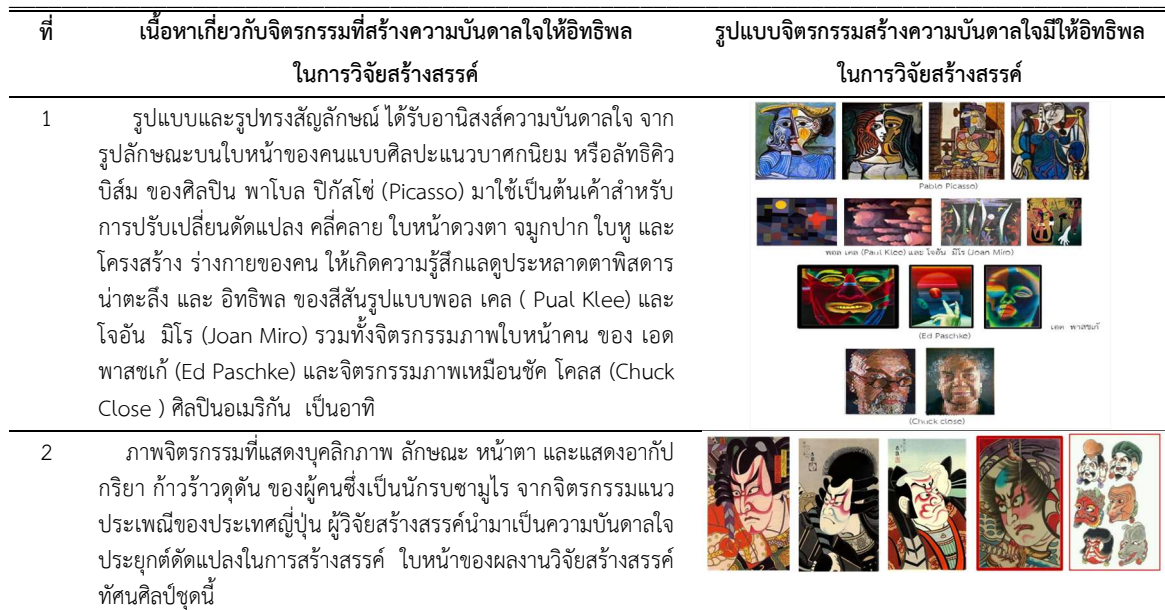
ภาพ 5 ตารางแสดงภาพรูปแบบและเนื้อหาเกี่ยวกับจิตรกรรมที่สร้างความบันเทิงใจในการวิจัยสร้างสรรค์ฯ

การวิจัยสร้างสรรค์ทศนศิลป์กวีทรศน์ มีกระบวนการวิเคราะห์รูปแบบ กระบวนการผลงานและเน้นการจัดทำภาพแบบร่าง เพื่อพัฒนาลักษณะรูปแบบ เนื้อหา แนวความคิด และกลวิธีสร้างสรรค์ จนเป็นผลงานการวิจัยสร้างสรรค์ทศนศิลป์ที่สำเร็จในขั้นตอนสุดท้าย เป็นแนวทางการสังเคราะห์ประมวลผลการสร้างสรรค์บทกวีทรศน์ ให้มีรูปแบบเนื้อหาสอดคล้องกับผลงานการวิจัยสร้างสรรค์งานทศนศิลป์กวีทรศน์ชุดนี้อย่างครบถ้วนสมบูรณ์ให้มากที่สุดเท่าที่ทำได้