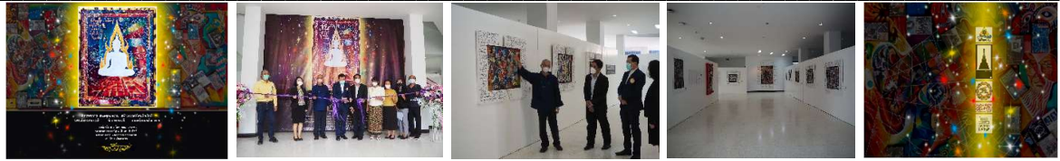
ภาพ 7 การจัดแสดงผลงานนิทรรศการศิลปะ การวิจัยสร้างสรรค์ทัศนศิลป์กวีทรศน์ ณ หอศิลป์มหาวิทยาลัยนเรศวร ระหว่างวันที่ 15 ธันวาคม 2564 ถึง 15 มกราคม 2565 เพื่อเผยแพร่องค์ความรู้การวิจัยสร้างสรรค์ทัศนศิลป์กวีทรศน์