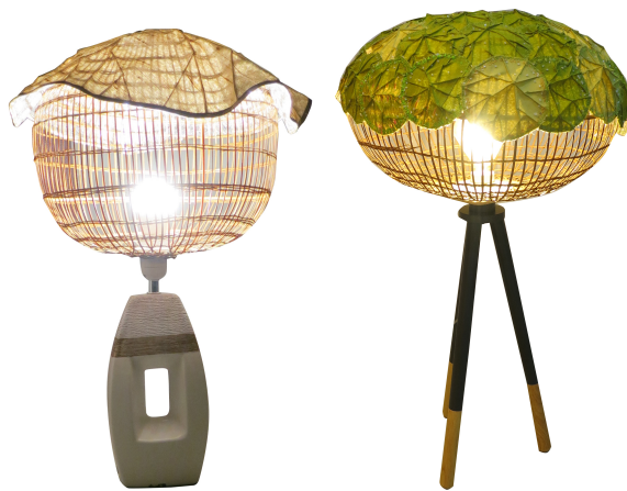
ภาพ 1 ภาพโคมไฟแนวคิดใบบัว

การออกแบบในครั้งนี้เลือกใช้การจักสานไม้ไผ่ลายตาข่ายทรงกลมขนาด 35 ซม., 45 ซม. และ 50 ซม. โคมไฟทรงกลมแทนความหมายของความไม่สิ้นสุดของแสงสว่าง ความรัก ความอบอุ่น และความสงบในครอบครัว เทคนิคการทำโคมไฟใบบัวเลือกรูปแบบใบบัวทั้งใบ โคมด้านบนเลือกใช้เทคนิคการเย็บตะเข็บขึ้นลายใบบัว ด้านในใบบัวเย็บซ้อนทับด้วยผ้าเลื่อมโลหะเพื่อช่วยให้เกิดการสะท้อนของแสงที่นุ่มนวลให้มากขึ้น และบ่งบอกถึงการรักษาดวงจิตให้สดใสไม่มัวหมองคือสิ่งมีคุณค่าที่สุด