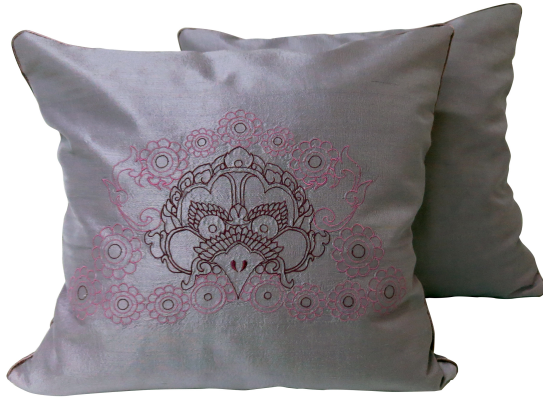
ภาพ 9 ปลอกหมอนหน้ากาลคายอุบะ