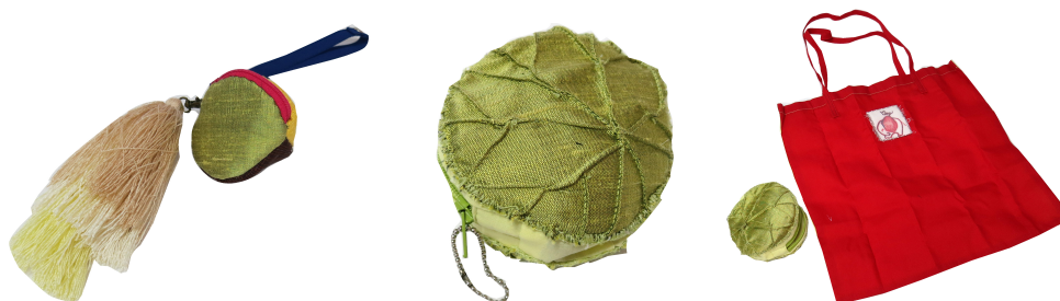
ภาพ 6 พวงกุญแจกระเป๋านกประสงค์จากเศษผ้าไหม