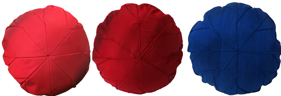
ภาพ 3 การทดลองเย็บหมอนรูปทรงใบบัว ขนาด 50 x 50 ซม.

แบบที่ 1 หมอนกลม ขนาด 50 x 50 ซม. ไม่กึ่งขอบ