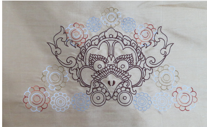
ภาพ 11 การทดลองปักลายหน้ากาลคยอูบะด้วยไหม 5 สี บนผ้าสีพื้น