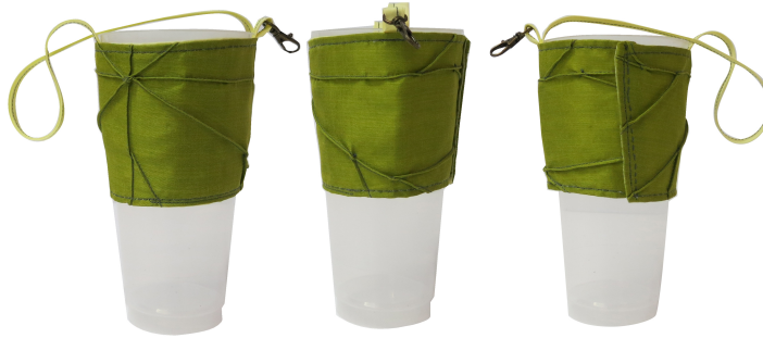
ภาพ 7 พวงกุญแจหัวแก้วน้ำจากเศษผ้าไหม

จากการทดลองเย็บกระเป๋าเนกประสงค์ มีพัฒนาการ 3 ครั้ง คือ แบบที่ 1 กระเป๋าทรงกลมลวดลายใบบัว ติดซิปลงสำหรับรูดเปิดปิดด้านข้าง ภายในบรรจุถุงลวดโลกร้อน สามารถเก็บถุงเมื่อเลิกใช้ งาน หรือแยกการใช้งานต่างหาก มีสายคล้องกระเป๋าต่อการพกพา