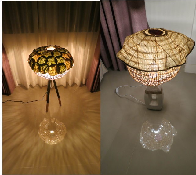
ภาพ 2 การสะท้อนแสงของโคมไฟแนวคิดใบบัว