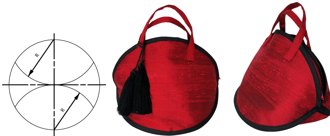
ภาพ 13 ภาพแพทเทิร์นและกระเป๋าจากแรงบันดาลใจลูกมะเฟือง ที่มา: เมธวดี พัยมประโคน, 2562

ความเป็นมาของรูปแบบกระเป๋าโดยแนวคิดในการออกแบบและพัฒนาผลิตภัณฑ์จากไหมและวัสดุชุมชนในครั้งนี้ นำเสนอกระเป๋าจากแนวคิดความสุขของครอบครัวไทยโดยมีช้างเป็นสัญลักษณ์ เนื่องจากธรรมชาติของช้างนั้นเป็นสัตว์เลี้ยงลูกด้วยนม และอยู่ร่วมกันแบบสังคมครอบครัวเช่นเดียวกับครอบครัวคนไทยซึ่งจะมีการดูแลซึ่งกันและกันในกลุ่มเครือญาติ อาศัยอยู่ร่วมกันแบบพึ่งพาอาศัยส่งผลให้คนไทยมีนิสัยเป็นมิตรและยิ้มแย้มแจ่มใส