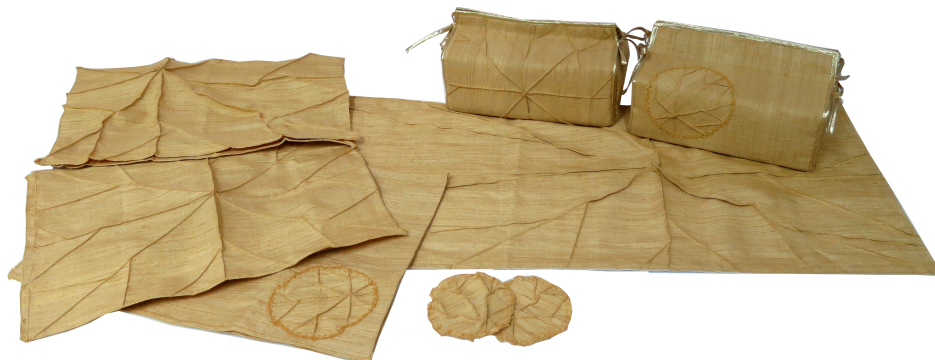
ภาพ 5 ชุดของตกแต่งบนโต๊ะอาหาร

แนวคิดในการออกแบบและพัฒนาผลิตภัณฑ์บนโต๊ะอาหารจากลวดลายใบบัว เกิดจากแรงบันดาลใจในการนำใบบัวมาใช้ในการทำอาหารของคนไทยในอดีต ดังนั้น หากนำใบบัวมาใช้เป็นแนวคิดในการออกแบบและพัฒนาชุดตกแต่งโต๊ะอาหาร นอกจากจะสื่อสัญลักษณ์ถึงการรักษาดวงจิตไม่ให้เศร้าหมองแล้ว ยังสอดคล้องกับวัฒนธรรมการรับประทานอาหารของคนไทยได้เป็นอย่างดีอีกด้วย การออกแบบในครั้งนี้ มีการพัฒนาแบบ 3 ครั้ง คือ