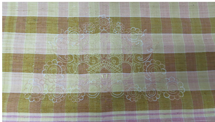
ภาพ 12 การทดลองปักลายหน้ากาลคยอูบะด้วยไหม 5 สี บนผ้าขาวม้า

การออกแบบและพัฒนาผ้าพันคอปักลายหน้ากาลคยอูบะ ที่ได้รับแรงบันดาลใจมาจากประติมากรรมหินอิทธิพลเขมร โดยได้ทดลองปักลายหน้ากาลลงบนผ้าขาวม้าไหมและผ้าไหมน้อย ด้วยไหม 2 สี และ 5 สี พบว่า ลวดลายหน้ากาลสอดคล้องกับผ้าไหมเป็นอย่างดี ลวดลายมีความสวยงามสะดุดตา สามารถนำผ้าปักที่ได้ไปเป็นผ้าพันคอ ปกคลุมหน้า กระเป๋า โคมไฟ และอื่น ๆ ได้