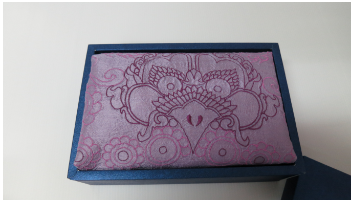
ภาพ 10 บรรจุภัณฑ์ปลอกหมอนหน้ากาลคายอุบะ

จากภาพ หมอนอิงสีเหลี่ยมจัตุรัสปกลายหน้ากาลด้วยเส้นไหม 2 สี คือ สีชมพู และสีม่วงเข้มล้อมรอบด้วยพวงอุบะดอกไม้สีชมพูอ่อน