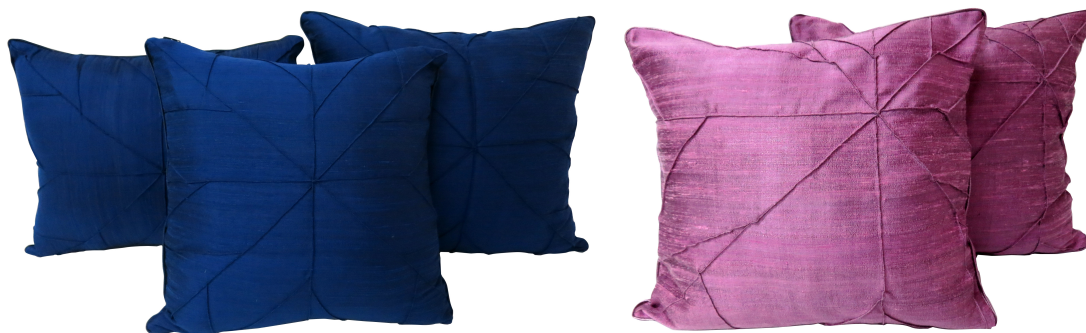
ภาพ 4 การทดลองเย็บชุดหมอนเหลี่ยมแบบตะเข็บกลาง และตะเข็บข้าง

จากภาพเป็นการทดลองเย็บลายใบบัวบนหมอนเหลี่ยม ขนาด 37x40 ซม., 37x46 ซม., 48x48 ซม.