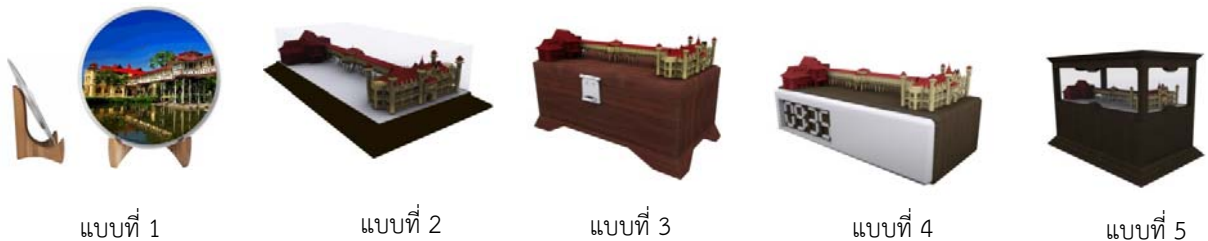
ภาพ 3 แสดงต้นแบบผลิตภัณฑ์ของที่ระลึกทั้ง 5 ประเภท

ดังนั้น ผู้วิจัยจึงเลือกที่จะออกแบบผลิตภัณฑ์ของที่ระลึกทั้งหมด 5 ประเภท คือ กล้องดนตรี นาฬิกา กล่องใส่ของแบบจำลอง และงานโซว์