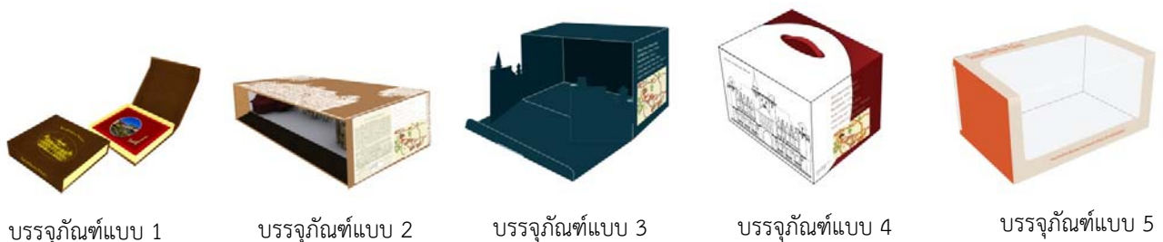
ภาพ 4 แสดงต้นแบบบรรจุภัณฑ์