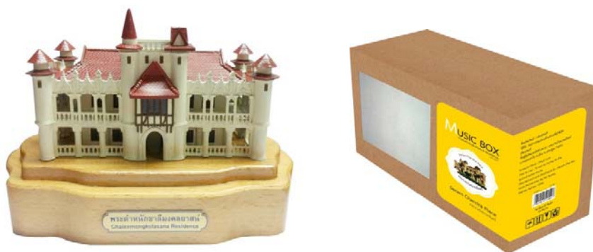
ภาพ 5 ผลิตภัณฑ์ของที่ระลึกกล่องดนตรีต้นแบบ และบรรจุภัณฑ์ที่พัฒนาตามข้อเสนอแนะของผู้เชี่ยวชาญ

การประเมินผลิตภัณฑ์ของที่ระลึกมีระดับมาก อยู่ 3 แบบ ดังนั้นผู้วิจัยจึงเลือกผลิตภัณฑ์ของที่ระลึก ประเภทกล่องดนตรีซึ่งมีค่าเฉลี่ยสูงสุด ( \bar{X} = 4.21, S.D=0.67 ) และนำมาปรับปรุงตามคำแนะนำของผู้เชี่ยวชาญ (ภาพที่ 4)