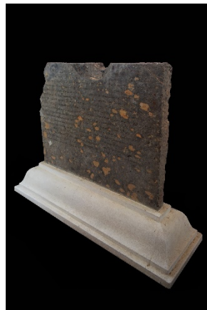
ภาพที่ 2 ศิลาจารึกการย้ายรอยพระพุทธรูป ที่มา: ภาพถ่ายโดยผู้เขียน เมื่อวันที่ 7 เมษายน 2566

อาลัยอยู่ในนครนี้ (แผ่นศิลาแกะเทาะ) ก็ได้เลื่อมจากความรู้คุณของพระศาสนา แลวัฒนธรรม ศิลปกรรมอุสาหกรรรมฯ ลงเปนลำดับ ต่อมา...พ.ศ. 2461 ประชาชนในพระนครนี้จวนจะ ไม่รู้จักพระศาสนาคืออะไร บ้างก็พากันทำร้ายร้างและนำสมบัติอันเป็นถาวร วัตถุปูชนียวัตถุ ออกซื้อขายเลี้ยงชีพตาม ๆ กัน.... (แผ่นศิลาแกะเทาะ) เมื่อ พ.ศ. 2470 เจ้าพระคุณพระ โบราณวัตร (ทิม) อุปัชชา(ย)ะของข้าฯ ได้มาเห็นพฤติการณ์ของปวงชนในพระนครนี้ กำลัง พากันเขาสู้รบอย่างน่าสงสาร ท่านจึงจัดการกอบกู้ให้หมู่ชนพ้นอบาย ได้นำประชาชนไป อันเชิญรอยพระพุทธรูปที่อยู๋เขาชื่อสุวรรณกุดนี้มาประดิษฐานไว้เกาะตะพังทอง แล้วมี การนมัสการประจำปีทุก ๆ ปี มีการปรับปรุง (รุง)วัดวาอาราม กระทำสพานข้ามเขาเกาะแล บำรุงสระให้มีน้ำใช้ตลอดกาล ท่านได้สร้างมณฑกไม้ศาลากฎีเป็นที่อาลัยแล..... (แผ่นศิลา แกะเทาะ) เจ้าหน้าทีรักษาถาวรวัตถุปูชนียวัตถุรวบรวมทำบัญชีสงกรมเพื่อสงวนไว้ ท่านกอบกู้ อยู่ 6 ปี ประชาชนก็ไม่เป่นผลแสดงขมาลี้กอยู่เสมอ... (แผ่นศิลาแกะเทาะ) ท่านจึงการมีเปื่อหมาย แต่ยังสงสาร จึงส่งข้าฯ มาบริหารพระศาสนาในนครสุโขทัย ข้าฯ ได้กอบกู้จิตใจประชาชน ด้วยขันติวิริยะภาพจนเลื่อมไสย์ เมื่อข้าฯ ชนะพาลชนแล้ว ข้าฯจึง (จบข้อความเพียงเท่านี้). 1