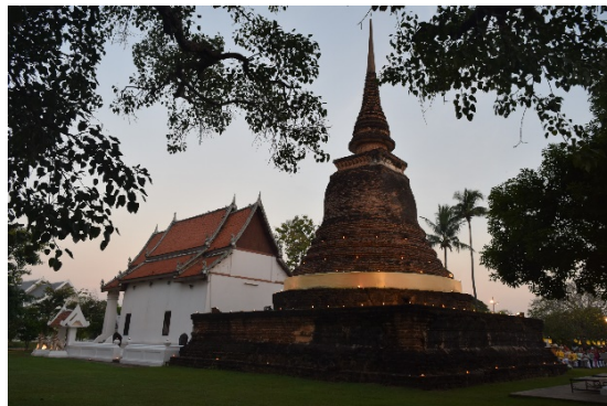
ภาพที่ 1 วัดตระพังทอง

(สำนักวรรณกรรมและประวัติศาสตร์ กรมศิลปากร, ม.ป.ป.)