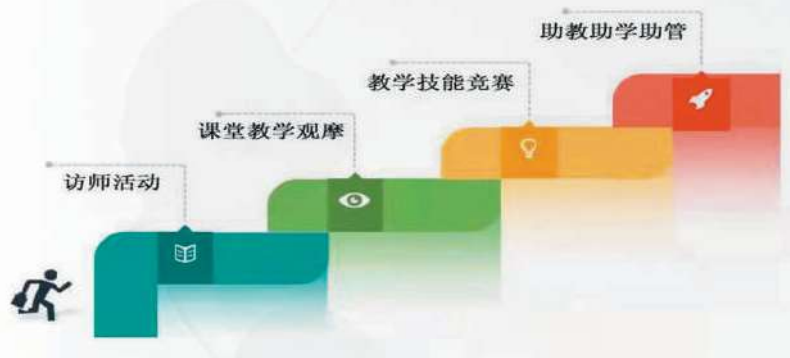
图2 教育见习课程化

开展系列渗透性教育见习课程，确保见习内容“四覆盖”：访师活动重在师德体验；课堂教学观摩和教学技能竞赛重在教学体验与实践；首创校内助教助学助管，重在直接感知班级管理与和教学研究。