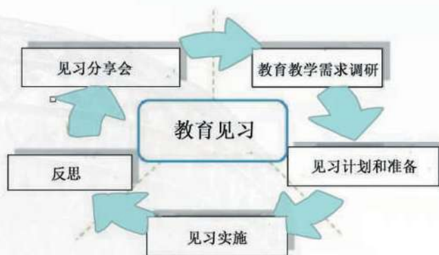
图3 教育见习“五步连环”流程图

开展系列渗透性教育见习课程，确保见习内容“四覆盖”：访师活动重在师德体验；课堂教学观摩和教学技能竞赛重在教学体验与实践；首创校内助教助学助管，重在直接感知班级管理与和教学研究。