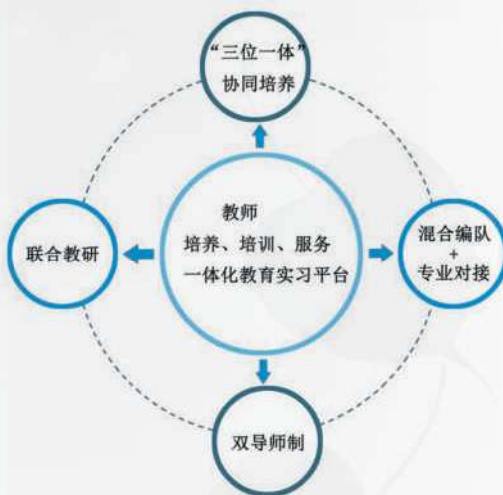
图4 培养、培训和服务一体化教育实习平台

•“三位一体”协同培养，高校为地方教育行政部门提供教育政策理论依据，为中学教改提供方向指引；地方教育行政部门为师范生培养提供政策保障；中学提供实践平台与实习实践指导；