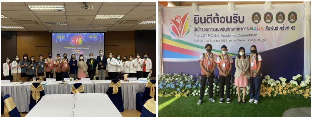
ภาพประกอบ 1 และ 2: กิจกรรมการเข้าร่วมแข่งขันทางวิชาการ พ.จ.น.ภ สัมพันธ์ครั้งที่ 43 ที่มาภาพ: บันทึกโดยผู้ศึกษา วันที่ 20 ธันวาคม พ.ศ. 2565

1.5 เข้าใจเชิงระบบ ประสบการณ์การเข้าร่วมกิจกรรมทางวิชาการเป็นการฝึกทักษะการคิดอย่างเป็นระบบได้เป็นอย่างดี เริ่มจากการเข้าใจถึงเหตุผล การมองเห็นปัญหาและวิธีแก้ปัญหาเฉพาะหน้าจากการฝึกทักษะ การนำบทเรียนจากการแก้ปัญหาพัฒนาเพื่อให้เกิดคุณภาพระหว่างกระบวนการมากยิ่งขึ้น ซึ่งทั้งหมดสามารถนำมาใช้ในการศึกษาในมหาวิทยาลัยหรือการดำเนินชีวิตโดยเฉพาะการต้องเผชิญกับสถานการณ์ที่เปลี่ยนแปลงอยู่ตลอดเวลา การตระหนักถึงการวางแผน การใส่ใจต่อกระบวนการทำงาน และคำนึงถึงผลลัพธ์ที่จะเกิดขึ้นล่วงหน้าได้ ดังการสนทนากลุ่มว่า “ค้นพบว่าการทำงาน หรือทำอะไรสักอย่างต้องมีการวางแผนล่วงหน้า แต่ละคนอาจมีบทบาทหน้าที่การทำงานอย่างลงตัว เพื่อที่จะทำให้การทำงานนั้น เสร็จทันเวลา และการทำงานร่วมกัน การทำงานงานต้องจัดสรรเวลาให้พอดี และลงตัว” (สนทนากลุ่ม, 20 กรกฎาคม 2564) และการสนทนากลุ่มว่า “หากวันใดวันหนึ่งทำงานแล้ว เราต้องรู้จักประเมินเวลาในการทำงานให้ได้มีประสิทธิภาพสูงสุด เช่น เวลาทำงาน 8 ชั่วโมงครึ่ง ก็ควรจะต้องเดินทาง 7 โมง เมื่อรถติดก็จะทำให้ไม่ไปทำงานสาย ต้องจัดเวลาให้เหมาะสม” (สนทนากลุ่ม, 20 กรกฎาคม 2565) และการสะท้อนกลับว่า “สามารถนำไปปรับใช้ได้หลายสถานการณ์ การแข่งขันจะต้องมีปัญหา ความคิดต่างกันบ้าง แต่เราต้องเปิดใจคุยช่วยกันคิดเลือกสิ่งที่ดีที่ทำงานกลุ่ม เลือกที่ดีที่สุด” (สนทนา, 20 กรกฎาคม 2565) ดังข้อสะท้อนประสบการณ์ข้างต้นได้แสดงให้เห็นผลลัพธ์ที่เกิดขึ้นจากประสบการณ์การเข้าร่วมการแข่งขัน แม้ว่าจะเป็นช่วงระยะเวลาไม่นาน แต่ได้สร้างประสบการณ์และระบบวิธีคิดที่ดีให้กับเยาวชนได้เป็นอย่างดี