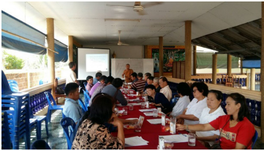
ภาพที่ 3 การสนทนากลุ่มร่วมกับผู้นำชุมชน