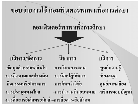
ภาพ 1.1 แสดงขอบข่ายการใช้คอมพิวเตอร์แท็บเล็ต สำหรับการบริหาร วิชาการและบริการ โดยเน้นการใช้สำหรับงานวิชาการเป็นหลัก

แท็บเล็ตสำหรับงานบริหาร (Administration) งานวิชาการ (Academic) และงานบริการ (Services)