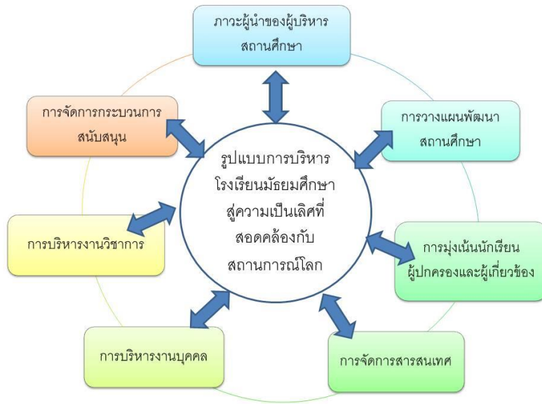
ภาพที่ 2 รูปแบบการบริหารโรงเรียนมัธยมศึกษาสู่ความเป็นเลิศที่สอดคล้องกับสถานการณ์โลก

องค์ประกอบด้านภาวะผู้นำของผู้บริหารโรงเรียน มีความสำคัญ เนื่องจากผู้บริหารสถานศึกษาจะต้องเป็นแกนหลักในการบริหารงาน และดำเนินงานร่วมกับบุคลากรแกนนำอื่นๆ เพื่อช่วยผลักดันส่งเสริมสนับสนุน และประสานให้บุคลากรภายในโรงเรียน และบุคลากรผู้เกี่ยวข้องภายนอก ร่วมกันทำงานเป็นทีม เพื่อพัฒนาคุณภาพทางการศึกษาให้เป็นระบบครบวงจรโดยเฉพาะการใช้ภาวะผู้นำแบบประชาธิปไตยในการบริหารงาน ผู้รู้จักใช้ความสามารถของผู้ใต้บังคับบัญชาให้ได้ประโยชน์มากที่สุด และมีความสัมพันธ์อันดีกับผู้ร่วมงาน เพื่อให้เกิดความร่วมมือร่วมใจในการดำเนินงานจากผู้เกี่ยวข้องทุกฝ่าย จึงเป็นหน้าที่ของผู้บริหารโรงเรียน ที่จะนำเอาเทคนิควิธี และกระบวนการบริหารที่เหมาะสมมาใช้ให้เกิดประสิทธิภาพและบรรลุเป้าหมายของสถานศึกษา ซึ่งสอดคล้องกับ (สถาบันเพิ่มผลผลิตแห่งชาติ. 2547: 3)