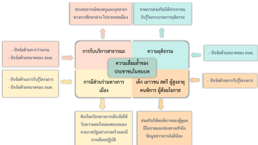
ภาพที่ 1 สภาพปัญหาความเหลื่อมล้ำของประชาชนในพื้นที่ชนบท จังหวัดเชียงราย

มี 4 ด้าน ได้แก่ ด้านสิทธิและโอกาสในการรับบริการสาธารณะ ด้านสิทธิและโอกาสในการได้รับความยุติธรรม ด้านสิทธิและโอกาสของเด็ก เยาวชน สตรี ผู้สูงอายุ คนพิการ และผู้ด้อยโอกาส และอยู่ในด้านสิทธิและโอกาสในการมีส่วนร่วมทางการเมือง แม้ว่าภาพรวมของปัญหาความเหลื่อมล้ำทุกด้านอยู่ระดับปานกลาง แต่เมื่อพิจารณาเปรียบเทียบระหว่างด้านจะเห็นได้ว่า ด้านสิทธิและโอกาสของการรับบริการสาธารณะมีสภาพปัญหาสูงกว่าด้านอื่น เมื่อพิจารณาสภาพปัญหาความเหลื่อมล้ำในแต่ละรายด้านจะพบว่า ด้านสิทธิและโอกาสในการรับบริการสาธารณะ ปัญหาความเหลื่อมล้ำสูงสุดอยู่ในระดับมาก ได้แก่ ประสบการณ์ในการทำงานของครูและบุคลากรทางการศึกษาในพื้นที่ชนบทที่ต่างไปจากพื้นที่เขตเมือง รองลงมา พื้นที่ชนบทขาดโอกาสที่ได้รับการพัฒนาระบบขนส่งมวลชนที่ทันสมัยและสอดคล้องกับความต้องการของประชาชน และการส่งเสริมให้ประชาชนในพื้นที่ชนบทมีโอกาสทางการศึกษานั้นน้อยกว่าในเมือง ส่วนด้านสิทธิและโอกาสที่ได้รับความยุติธรรม ปัญหาอยู่ในระดับมาก ได้แก่ การจัดการส่งเสริมให้ประชาชนในพื้นที่ชนบทรับรู้สิทธิในกระบวนการยุติธรรม ด้านของสิทธิและโอกาสของเด็ก เยาวชน สตรี ผู้สูงอายุ คนพิการ และผู้ด้อยโอกาส ปัญหาในระดับมาก ได้แก่ การส่งเสริมให้คนพิการ ผู้ดูแลคนพิการ ผู้มีแนวโน้มพิการ พื้นที่ชนบท ให้มีโอกาสและช่องทางการเข้าถึงข่าวสารเกี่ยวกับสิทธิ สวัสดิการ และบริการ ยังมีน้อยมาก และด้านสิทธิและโอกาสการมีส่วนร่วมทางการเมือง ปัญหาอยู่ในระดับมาก คือ โอกาสในการแสดงความคิดเห็นทางการเมืองของประชาชนในพื้นที่ชนบทขาดความเป็นอิสระและประชาชนในพื้นที่ชนบทขาดโอกาสในการร้องเรียนเรื่องต่าง ๆ อย่างเท่าเทียมกัน