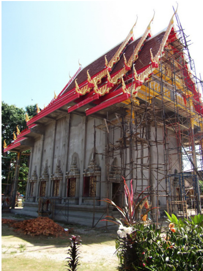
ภาพที่ 6 อุโบสถใหม่ที่สร้างทับอุโบสถเดิมวัดบ้านแก่งไต้ ตำบลบ้านแก่ง อำเภอตรอน

- การลักลอบขุดโบราณสถานเพื่อค้นหาโบราณวัตถุ เป็นการทำลายโบราณสถานโดยตรงเช่นกัน ในกรณีการลักลอบขุดนั้น เกิดขึ้นได้กับทั้งโบราณสถานที่เป็นศาสนสถานและแหล่งโบราณคดี ซึ่งจะเป็นเหตุให้โบราณสถานถูกรบกวน รวมถึงเกิดการเปลี่ยนแปลงสภาพทางกายภาพ