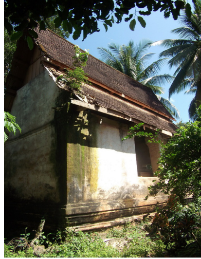
ภาพที่ 2 วิหารเก่า วัดเจดีย์ศรีวิหาร ตำบล ฝายหลวง อำเภอลับแล มีคราบราและ ตะไคร่เกาะอยู่รอบบริเวณผนังวิหาร ภาพถ่ายเมื่อวันที่ 18 พฤษภาคม 2553