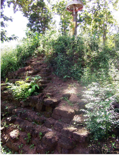
ภาพที่ 1 เจดีย์ก่อด้วยศิลาแลง วัดถ้ำเขี สำราญ ตำบลทุ่งยั้ง อำเภอลับแล มีวัชพืช ขึ้นปกคลุมหนาแน่นโดยไม่มีการดูแลรักษา ภาพถ่ายเมื่อวันที่ 17 พฤษภาคม 2553