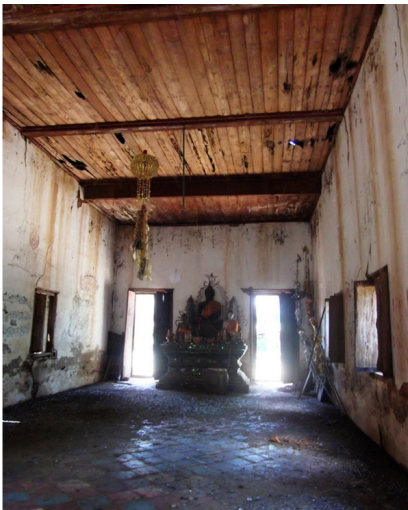
ภาพที่ 3 อุโบสถวัดท่าดินแดง ตำบล ไร่อ้อย อำเภอพิชัย ภายในอุโบสถเต็ม ไปด้วยมูลนกและคราบสกปรกจำนวนมาก ภาพถ่ายเมื่อวันที่ 19 พฤษภาคม 2553