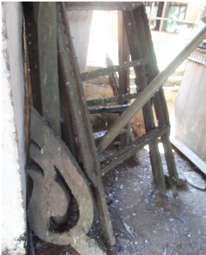
ภาพที่ 7 สภาพภายในวิหารเก่าวัดเจดีย์คีรีวิหาร ตำบลฝายหลวง อำเภอลับแล ถูกใช้เป็นสถานที่เก็บของที่ไม่ได้ใช้ประโยชน์

- การทิ้งร้างและไม่ดูแลรักษา จากการลงพื้นที่สำรวจโบราณสถานในจังหวัดอุดรดิตถ์พบว่า โบราณสถานหลายแห่งถูกทิ้งร้าง ไม่ได้ใช้ประโยชน์และไม่ได้รับการดูแลรักษา ซึ่งสาเหตุสำคัญเกิดจากการขาดกำลังเจ้าหน้าที่บุคลากรหรืออาสาสมัครในการดูแลรักษาโบราณสถานเหล่านั้น รวมถึงหน่วยงานที่มีหน้าที่รับผิดชอบและคนในพื้นที่เพิกเฉยและละเลยที่จะดูแลรักษาโบราณสถานให้อยู่ในสภาพที่เหมาะสม