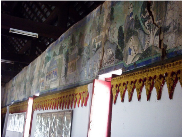
ภาพที่ 4 ร่องรอยข้าวและคราบน้ำฝน บริเวณภาพจิตรกรรมบนผนังวิหารวัดทองลับแล ตำบลฝายหลวง อำเภอลับแล ภาพถ่ายเมื่อวันที่ 18 พฤษภาคม 2553