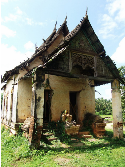
ภาพที่ 5 อุโบสถวัดดอยแก้ว ตำบลแสนตอ อำเภอเมืองอุตรดิตถ์ ปรากฏร่องรอยแตก ข้าวและความเสื่อมโทรมของโบราณสถาน ภาพถ่ายเมื่อวันที่ 22 พฤษภาคม 2553