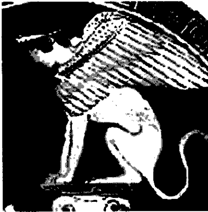
รูปที่ 9 สฟิงซ์