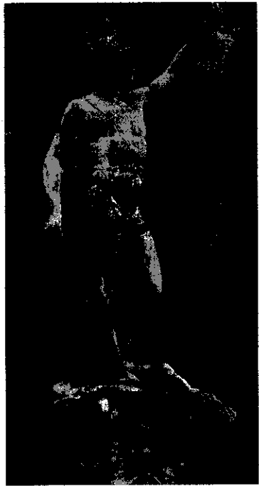
รูปที่ 4 เพอร์ซุสกับเมดูซ่า

เมื่อวีรบุรุษเพอร์ซุส 5 ได้รับบัญชาจากโพลีเดกทิส (Polydectes) กษัตริย์ของเกาะแห่งหนึ่งในทะเลอีเจียน (Aegean) ให้ไปนำหัวนางกอร์กอนตนหนึ่งมาให้ เทวีอธีนาซึ่งยังพิโรธเมดูซ่าอยู่ได้แนะนำให้เพอร์ซุสไปเอาหัวของนางกอร์กอนเมดูซ่า เพราะนางเป็นกอร์กอนตัวเดียวที่ไม่มีฤทธิ์และไม่ได้เป็นอมตะ พร้อมทั้งบอกวิธีไปหาตัวเมดูซ่า ในที่สุดเพอร์ซุสสามารถตัดหัวของนางเมดูซ่า (รูปที่ 4) ซึ่งกำลังตั้งครรรภ์กับเทพไฟไซดอน และนำไปถวายกษัตริย์โพลีเดกทิสได้ โลหิตของนางเมดูซ่าที่ไหลออกมาทำให้เกิดม้าเพกาซัส (Pegasus) และยักษ์คริซอร์ (Chrysaor) เทวีอธีนาเองได้เอาหนังของนางเมดูซ่ามาทำเป็นเกราะหน้าอกของพระนาง