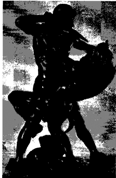
รูปที่ 3 ธีซุสกับไมโนเทาว์

ก่อนที่ไมนอสจะขึ้นเป็นกษัตริย์แห่งครีต พระองค์ได้ทำพิธีขอให้เทพโพไซดอน (Poseidon) ช่วยให้พระองค์มีรัชชชนะในการรบชิงราชสมบัติ โดยขอให้พระองค์ พระราชทานวัวตัวผู้ที่มีสีขาเหมือนหิมะให้เพื่อแสดงว่าพระองค์เห็นชอบให้ไมนอสครอง ราชย์สมบัติ และไมนอสสัญญาว่าจะใช้วัวตัวนี้เป็นเครื่องสังเวยต่อเทพโพไซดอนเพื่อ แสดงความจงรักภักดี แต่เมื่อกษัตริย์ไมนอสเห็นวัวที่เทพโพไซดอนส่งมาให้ก็เกิดความเสียดาย ทรงเปลี่ยนพระทัยกลับใช้วัวตัวอื่นเป็นเครื่องสังเวยแทน เทพโพไซดอนทรงพิโรธจึงสาปให้ พาซิพี หลงใหลวัวตัวผู้อย่างมาก พระนางมีพระราชเสาวนีย์ให้ดีดัลลัส (Daedalus) สถาปนิกฝีมือเอกสร้างวัวตัวเมียด้วยไม้ และพระนางทรงป็นเข้าไปอยู่ในวัวไม้หลอกล่อให้ วัวตัวผู้ที่พระนางหลงใหลมาสมสู่ ต่อมา พระนางให้กำเนิดไมโนเทาว์ซึ่งเป็นสัตว์กินคน กษัตริย์ไมนอสทรงอับอายที่มเหสีมีลูกเป็น สัตว์ประหลาดจึงให้สถาปนิกดีดัลลัสผู้สร้างวัว ไม้ สร้างเขาวงกตเพื่อใช้กักขังไมโนเทาว์ และทุกปีนครเอเธนส์จะต้องส่งนุรุษหนุ่มและ สตรีแรกนุอย่างละเจ็ดคนไปเป็นเครื่อง สังเวยไมโนเทาว์ วีรบุรุษธีซุส (Theseus 4 ) ได้ อาสาเป็นหนึ่งในเครื่องสังเวยเพื่อได้มีโอกา สกำจัดไมโนเทาว์ ธีซุสสามารถฆ่าไมโนเทาว์ (รูปที่ 3) และหลบหนีออกจากเขาวงกตได้ ด้วยความช่วยเหลือของอาริแอดนี (Ariadne) พระธิดาของกษัตริย์ไมนอส