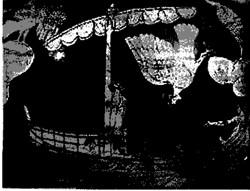
รูปที่ 6 โอดิซุสกับไซเรนส์

เสียงเพลงของนางไซเรนส์ได้ ด้วยการให้ลูกเรือมัดตัวเขาไว้กับเสาเรือและเอาซี่ผึ้งอุดหูลูกเรือ จนกระทั่งเรือแล่นผ่านพ้นแดน (รูปที่ 6)