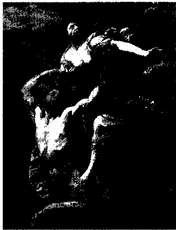
รูปที่ 2 เนสซัสกับนางดียาโนรา

เซนเทาว์มีสองประเภทด้วยกันคือ เซนเทาว์ป่าเถื่อน กับเซนเทาว์ที่เป็นปราชญ์ สาเหตุที่มีเซนเทาว์ที่ตื้นนั้นเป็นเพราะเนื่องจากในสมัยโบราณมักเป็นสัตว์ที่อยู่ใกล้ชิดกับมนุษย์ ทำให้เซนเทาว์ถูกกำหนดให้เป็นสัตว์ที่เป็นเพื่อนที่ดีของมนุษย์ เซนเทาว์ ไครอน (Chiron) เป็นปราชญ์ที่มีชื่อเสียง เป็นอาจารย์ของวีรบุรุษ เช่น อาคิลีส (Achilles) (รูปที่ 1), เจสัน (Jason) 2 อีเนียส (Aeneas) 3 และ ยังเป็นอาจารย์ของเทพแอสคลีพิอุส (Asclepius) ซึ่งเป็นเทพแห่งการแพทย์