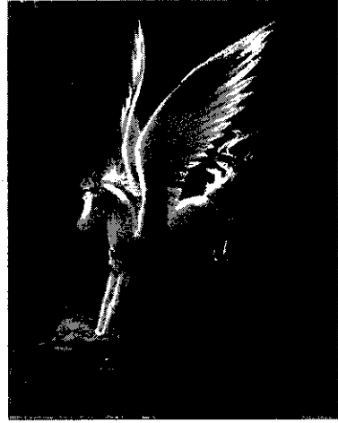
รูปที่ 8 ม้าเพกาซัส

คิมิราได้บุกเข้าทำร้ายผู้คนและเผาเมืองลิเซีย (Lycia) กษัตริย์ไอโอบาทีส (Iobates) ทรงบัญชาให้เบลเลอริโอโฟน (Bellerophon) ไปปราบ เมื่อเบลเลอริโอโฟน 10 (Bellerophon) ได้รับบัญชาจากกษัตริย์แห่งลิเซียให้กำจัดคิมิรา เบลเลอริโอโฟนได้รับคำแนะนำให้จับม้าเพกาซัส (รูปที่ 8) มาเป็นพาหนะ ม้าเพกาซัสเป็นม้าที่เทวีอริธน่าจับได้และมอบให้แก่วีทวิแห่งศิลปะศาสตร์ ดูแล เทวีอริธน่าได้บอกสถานที่ที่อยู่ของม้าเพกาซัส และมอบสายบังเหียนทองคำให้ เบลเลอริโอโฟนจับม้าเพกาซัสได้และเข้าไปสังหารคิมิรา และเบลเลอริโอโฟนสามารถฆ่าคิมิราได้