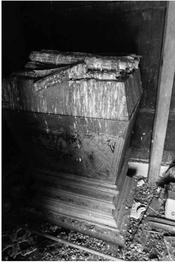
ภาพที่ 2 ธรรมโบลานภายในห้องเก็บธรรมบนหอไตรได้รับความเสียหายจากมูลก (สิงหาคม 2557)