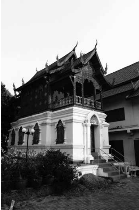
ภาพที่ 7 หอไตรวัดช้างรอง อ.เมือง จ.ลำพูน ได้รับรางวัลอาคารอนุรักษ์ศิลปสถาปัตยกรรม จากสถาปนิกล้านนา พ.ศ. 2557 (สิงหาคม 2557)

ตัวอย่างหอไตรครึ่งไม้ครึ่งปูน 2 ชั้น ชั้นล่างก่ออิฐ ชั้นบนเป็นไม้ ในผังรูปสี่เหลี่ยมผืนผ้าย่อเก็จในตอนหน้าและหลัง ตั้งบนฐานสูงสี่เหลี่ยมผืนผ้าไม่ย่อเก็จ มีบันไดทางขึ้นด้านหน้า ในส่วนย่อเก็จหน้าและหลังของอาคารด้านบนเป็นระเบียง ประตูทางเข้าทางทิศตะวันออก ทำเป็นซุ้มปูนปั้นทรงโค้งยอดแหลม 2 ชั้น ปลายซุ้มมีหางหงส์รูปหัวนาค ภายในซุ้มปูนปั้นประดับรูปดอกพุดตาน มีเสากรอบประตู 2 ชั้น ประดับบัวเชิงบันและเชิงฐานและประจายามรดดอก ผนังข้างมีหน้าต่างด้านละ 4 ช่อง ตกแต่งคล้ายประตู ส่วนผนังด้านทิศตะวันตกปิดทึบ อาคารส่วนล่างใช้ผนังรับน้ำหนัก ส่วนอาคารด้านบนใช้ระบบเสาและคานรับน้ำหนัก โดยประกอบด้วยเสา 6 ต้นในห้องตอนกลาง ส่วนย่อเก็จหน้าและหลังอย่างละ 2 ต้น รวม 10 ต้น ประตูทางเข้าอยู่ที่ผนังด้านสกัดทั้ง 2 ด้าน ที่พื้นเจาะช่องบันไดที่ส่วนย่อเก็จมุมขะเบียงหน้า ปัจจุบันปิดพื้นไม้และใช้บันไดพาดจากด้านหน้าเมื่อจะขึ้นสู่ตัวอาคารด้านบน ผนังด้านข้างมีช่องหน้าต่างด้านละ 1 ช่อง ประดับกรอบซุ้มยอดโค้ง ฝาผนังตีไม้ทึบในแนวตั้ง ตกแต่งลายฉลุ ส่วนหลังคาทรงคฤห์ ใช้โครงสร้างไม้ตั้งใหม่ ทวากรบูรณะภายหลังได้เสริมจันทันไม้กับส่วนหลังคาชั้นลดที่ด้านหน้าและด้านหลัง แล้วตีแผ่นไม้ทึบประดับลายเครือเถากันแดด จึงมองเห็นโครงสร้างไม้ตั้งใหม่ทางด้านหน้า เครื่องหลังคาประกอบด้วยข้อฟ้าแบบปากนก ไบรกะกาแบบรวยระกา หางหงส์แบบหัวนาค ทั้งหมดเป็นไม้ประดับกระจก ลักษณะสถาปัตยกรรมเป็นเช่นเดียวกับหอไตรวัดพระธาตุหริภุญชัย