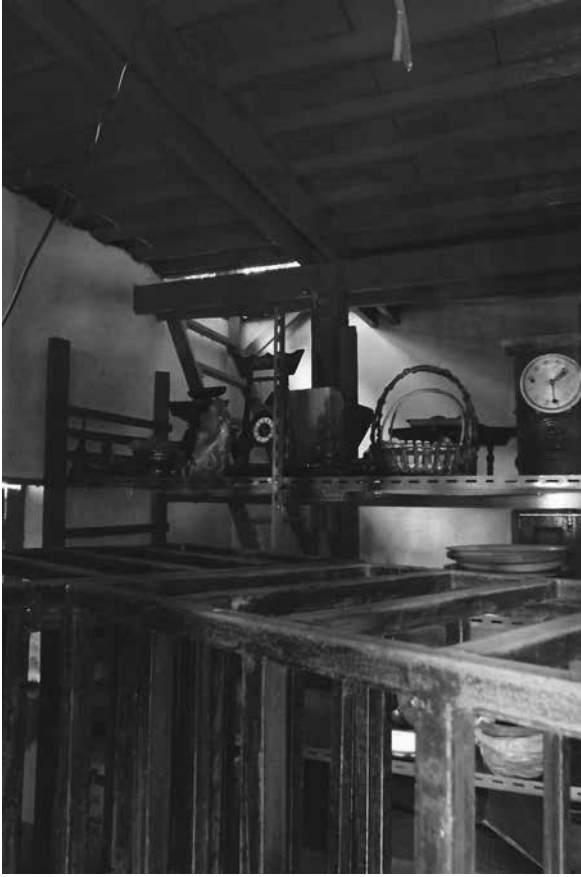
ภาพที่ 3 ห้องด้านล่างหอไตรถูกเปลี่ยนสภาพเป็นห้องเก็บของ (พฤษภาคม 2557)