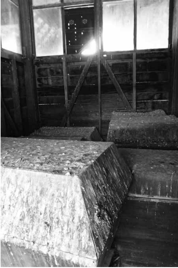
ภาพที่ 1 หีบธรรมภายในห้องเก็บธรรมบนหอไตรได้รับความเสียหายจากมุลนก (พฤษภาคม 2557)