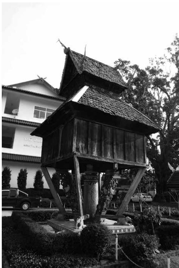
ภาพที่ 8 หอไตรเสาเดียว วัดศรีดัง อ.เชียงของ จ.เชียงราย (พุทธศักราช 2557)

ตัวอย่างหอไตรไม้ชั้นเดียวที่สร้างกลางสระน้ำ ตัวหอไตรมีขนาดเล็กในผังสี่เหลี่ยมจัตุรัส กว้างยาวด้านละประมาณ 2 เมตร รองรับไว้ด้วยเสาไม้ขนาดใหญ่เพียงต้นเดียว หลังคาทรงโรง มองเห็นคอสองชัดเจน ด้านล่างเป็นฐานบัวก่ออิฐในผังสี่เหลี่ยมจัตุรัส วางไว้กลางสระน้ำ ฐานนี้ยกสูงประมาณ 80 ซม. ตอนกลางของฐานเป็นเสาไม้กลมขนาดใหญ่ตั้งขึ้นรองรับห้องเก็บคัมภีร์ ทิศทั้ง 8 มีไม้ค้ำยันขึ้นไปยังมุมและกึ่งกลางด้านห้องเก็บธรรม เฉพาะที่มุมทั้งสี่และฐานข้างรองรับไว้ วางคานคู่สอดเข้าไปในเสากลมต้นกลางเป็นรูปกากบาท แล้วจึงตีพื้นชั้นบน ไม่มีตงเสริมขึ้นจากคาน ตัวห้องเก็บธรรมทึบ มีประตูด้านหน้า ฝาตีไม้ตั้งขึ้น หลังคาทรงโรง โดยส่วนปีกนกคลุมลงมาต่ำมาก สามารถมองเห็นคอสองชัดเจน จั่วตอนกลางด้านบนมีขนาดใหญ่ ซ่อฟ้าเป็นไม้แบบนาค ปากนกมีปีกอย่างซ่อฟ้าที่พบทั่วไปในจังหวัดเชียงรายและน่าน ใบระกาตรง ทางหงส์เป็นหัวนาค