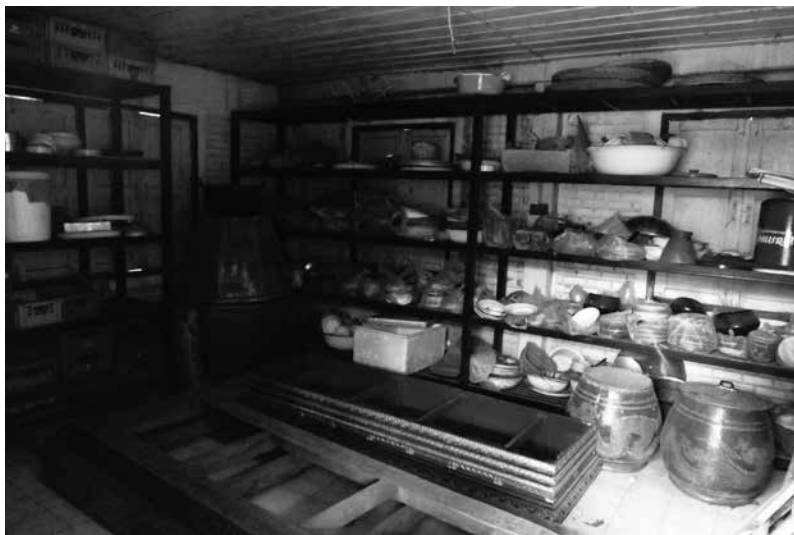
ภาพที่ 4 ห้องด้านล่างหอไตรถูกเปลี่ยนสภาพเป็นห้องครัว ภายหลังจากวัดได้รื้อส่วนห้องครัวออก ปล่อยให้โล่ง (สิงหาคม 2557)