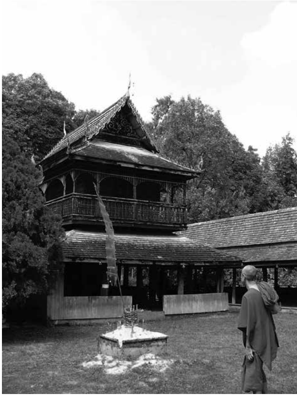
ภาพที่ 6 หอไตรวัดหลวงขุนวิน อ.แม่วาง จ.เชียงใหม่ ได้รับรางวัลอาคารอนุรักษ์ศิลปสถาปัตยกรรม จากสถาปนิกล้านนา พ.ศ. 2557 (พฤศจิกายน 2557)

ตัวอย่างหอไตรไม้ชั้นเดียว ใต้ถุนสูง ได้สัดส่วน ได้สัดส่วน วางตัวอาคารไปตามแกนทิศตะวันออก-ตะวันตกขนานไปกับวิหาร ผังเป็นรูปสี่เหลี่ยมผืนผ้า ชั้นล่าง มีเสาไม้รับน้ำหนักตัวหอไตรด้านบน 8 ต้น และรับน้ำหนักหลักคานปีกนกของตัวหอไตรด้านล่างโดยรอบ อีก 16 ต้น เฉพาะด้านหลังตีไม้ตั้งเป็นฝาสูงไปจนถึงพื้นด้านบน ชั้นบนเป็นห้องตีฝาทึบ มีประตูทางเข้าด้านหน้า 1 ช่อง ทางขึ้นจากชั้นล่างสู่ชั้นบนเป็นช่องสี่เหลี่ยมที่ถูกเจาะไว้บริเวณพื้นห้อง พอคนเพียงคนเดียวลอดผ่านขึ้นไปได้ รอบห้องเป็นระเบียง ตัวระเบียงใช้ไม้กลึง ยึดไว้กับเสาไม้ต้นเล็กที่เสริมออกมา ด้านบนระหว่างเสาไม้นี้ ตีไม้ระแนงเป็นวงโค้ง ส่วนหลังคาเป็นทรงโรง คือเป็นหลังคาจั่วในตอนกลางคลุมตัวห้องด้านบน และปีกนกเสริมออกมาทั้งสองด้าน โดยใช้เสาของระเบียงเป็นตัวรับน้ำหนักหลังคาปีกนก มุงด้วยกระเบื้องดินเผา