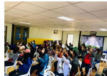
(7) Data creation and use activities to promote and increase distribution channels for agricultural products