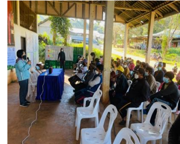
(5) Workshop on adding value of agricultural waste products