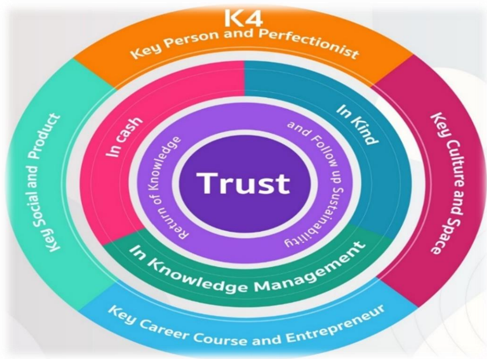
Figure 3 Guidelines for Career Skills under the Career Development Scholarship Program and Community-based Innovation of Farmers Group in Terms of Policy Goals for Sustainability