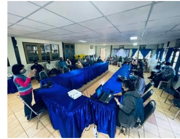
(6) Activities for creating and using data for income planning, expense planning for debt management, savings, and career plans