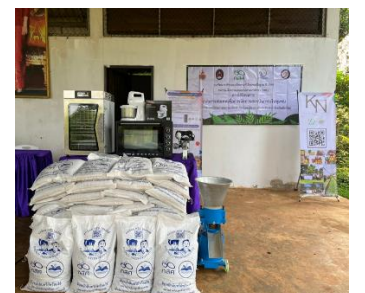
(8) Community activities on borrowing the information and return back in the form of new career to promote the quality of life of the community