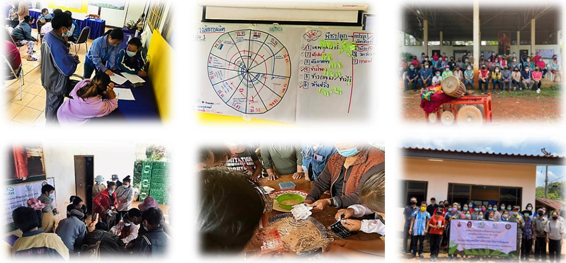
Figure 2 Data Collection/ Production Planning/ Career Skills Activities/ Product Processing Skills

ในการตั้งประเด็นการสนทนาและมีผู้ช่วยเป็นผู้บันทึกการสนทนาพร้อมทั้งตั้งประเด็นการสนทนาเสริม โดยการสัมภาษณ์แบบกึ่งโครงสร้าง ซึ่งใช้การวิเคราะห์เนื้อหา (Content Analysis) โดยจำแนกตาม วัตถุประสงค์ประเด็นการศึกษาสังเคราะห์เพื่อให้ได้ภาพรวม สรุปผลการศึกษาและนำเสนอผลการศึกษา