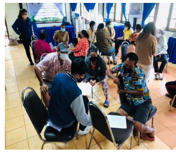
(1) Activities to understand and prepare the target groups for professional skill development