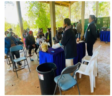
(4) Product processing workshop activities to increase income