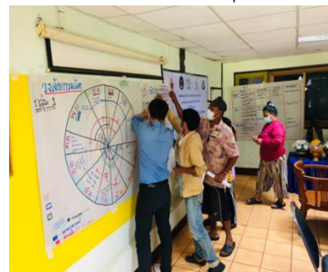
(2) Occupational skills development activities with income system and production cost planning system