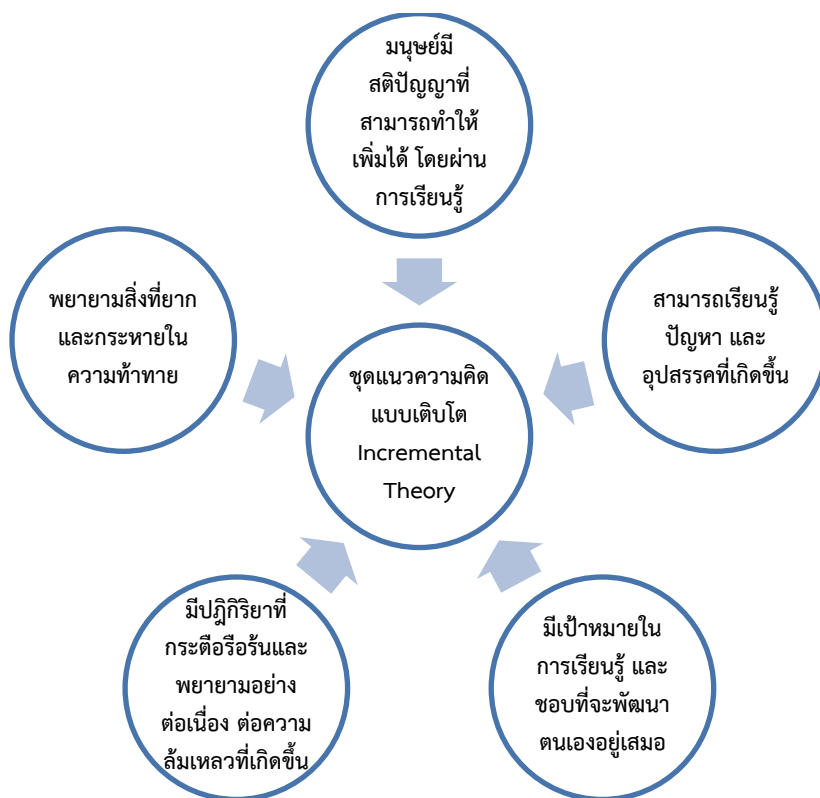
ภาพที่ 1 ชุดแนวความคิดแบบเติบโต Incremental Theory ที่มา : พัฒนมาจาก Self-theories ของ Dweck (2000)