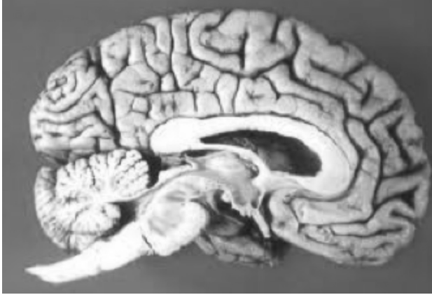
ภาพที่ 1 สมองของมนุษย์

ปัจเจกบุคคลมีทัศนคติและค่านิยมในการดำเนินชีวิตที่แตกต่างกัน