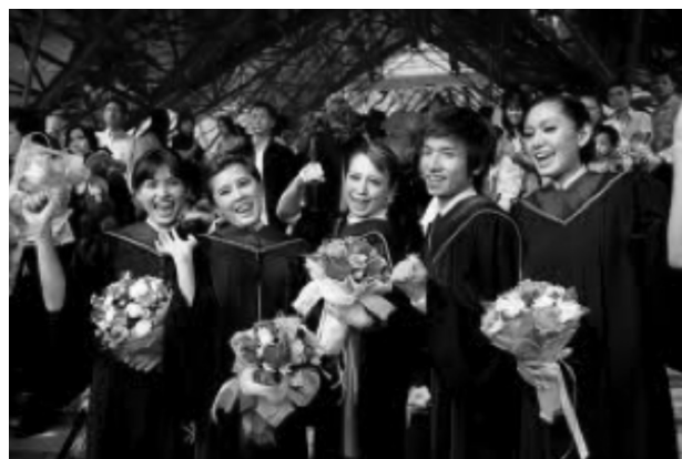
ภาพที่ 3 บัณฑิตที่สำเร็จการศึกษา

ที่จะดำรงชีวิตอยู่ร่วมกันอย่างสร้างสรรค์และมีความสุข ความเป็นอิสระและเสรีภาพบนพื้นฐานความเสมอภาคที่เท่าเทียมกัน ดังนั้น การคำนึงถึงสิทธิมนุษยชน การเคารพซึ่งกันและกัน และไม่ละเมิดสิทธิหรือก่อความเดือดร้อนเสียหายแก่ผู้อื่นจึงเป็นพื้นฐานของคุณธรรมในการดำเนินชีวิตที่สำคัญมาก ความรับผิดชอบดังกล่าวเป็นสิ่งจำเป็นที่สถาบันการศึกษาต้องปลูกฝังและสร้างเสริมเป็นอย่างยิ่ง เพราะการสร้างความเป็นมนุษย์จะสมบูรณ์ได้ ต้องให้บุคคลมีคุณธรรม และเชื่อว่าทุกคนมีศักดิ์ศรีและเกียรติภูมิที่เป็นมนุษย์เท่าเทียมกัน จึงไม่ควรเบียดเบียนหรือทำร้ายกันไม่ว่าในรูปแบบใด