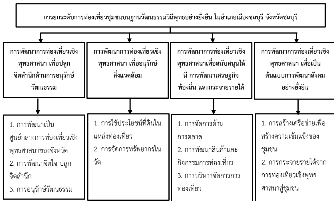
รูปที่ 2 : การยกระดับการท่องเที่ยวชุมชนบนฐานวัฒนธรรมวิถีพุทธอย่างยั่งยืน (พระชลญาณมุนี, 2567)