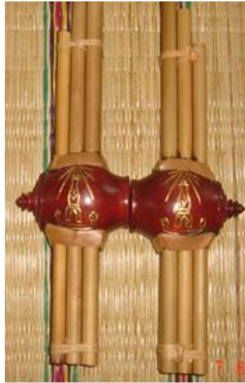
ภาพที่ 1 ภาพแคนหกในสาธารณรัฐประชาธิปไตยประชาชนลาว