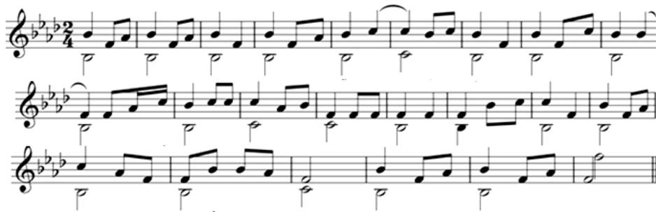
ภาพที่ 4 ตัวอย่างโน้ตสากลการเป่าแคนประกอบการขับเซียงขวางในสาธารณรัฐประชาธิปไตย ประชาชนลาว