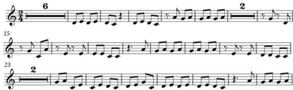
ภาพที่ 5 ตัวอย่างโน้ตสากลการเป่าแคนประกอบการขับซ้ำเหนือในสาธารณรัฐประชาธิปไตย ประชาชนลาว

จากลายแคนทั้ง 3 ลาย ซึ่งแสดงให้เห็นในรูปแบบของโน้ตสากลนั้น การเป่าแคนประกอบการขับซ้ำมี และขับซ้ำเหนือมีรูปแบบคล้ายคลึงกันซึ่งจะมีการล้อกับทำนองหลักของการขับเป็นระยะ ส่วนการขับเสียง ขวางจะใช้แคนเป่าประกอบการขับเท่านั้น