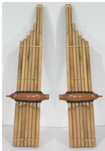
ภาพที่ 2 แคนเจ็ดในสาธารณรัฐประชาธิปไตยประชาชนลาว

หลักและวิธีการเป่าแคนประกอบการขับในสาธารณรัฐประชาธิปไตยประชาชนลาว เริ่มต้นจากการใช้ลมสั้นและลมยาว โดยการขึ้นต้นเสียงแคนจะใช้ลมสั้นสลับกับลมยาว ใช้นิ้วคู้ นิ้วเดียว และนิ้วผสมในการเป่าแคนประกอบการขับ ซึ่งการขับเซียงขวางจะใช้ลมสั้น และจะใช้ลมยาวในวรรคสุดท้ายของการขับ การขับเซียงขวางมีความเร็วปานกลาง การขับจิมหมอแคนจะต้องฟังทำนองขับจิมจากหมอขับเป็นหลักและหมอขับจะต้องรักษามาตรฐานของเสียงขับจิมให้ตรงกับเสียงแคน การขับซำเหนือจะใช้แคนเจ็ดเป่าประกอบการขับ จะมีการขึ้นต้นเสียงแคน เพื่อให้หมอขับได้เทียบเสียงขับให้ตรงกับหมอแคน