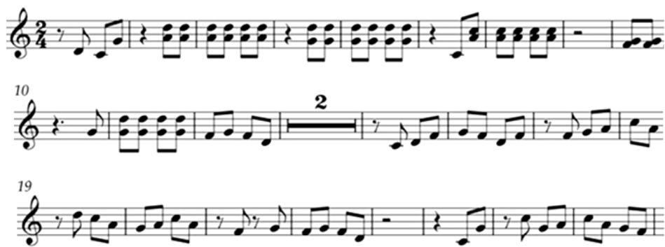
ภาพที่ 3 ตัวอย่างโน้ตสากลการเป่าแคนประกอบการขับจิมในสาธารณรัฐประชาธิปไตยประชาชนลาว

สาธารณรัฐประชาธิปไตยประชาชนลาวมีศาสนา ประเพณี ความเชื่อ และภาษา โดยเฉพาะอย่างยิ่ง ศิลปะการแสดงด้านการขับ มี “แคน” เป็นเครื่องดนตรีที่โดดเด่นและเป็นเครื่องดนตรีประจำชาติ ส่วนศิลปะการแสดงของสาธารณรัฐประชาธิปไตยประชาชนลาวที่เป็นการขับนั้น การขับอยู่ในแขวง เวียงจันทน์ไปทางตอนเหนือ ได้แก่ การขับจิมอยู่บริเวณแม่น้ำจิมทางทิศเหนือหรือทิศตะวันออกเฉียงเหนือ ของแขวงเวียงจันทน์ การขับข่าเหนืออยู่บ้านข่าเหนือ แขวงหัวพัน และการขับเซียงขวางอยู่ในแขวงเซียง ขวาง สาธารณรัฐประชาธิปไตยประชาชนลาว การเป่าแคนประกอบการขับมีลักษณะทำนอง ดัง ภาพประกอบ ต่อไปนี้