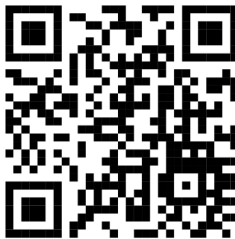
ภาพที่ 4 คิวอาร์โค้ด (QR Code) สื่อการสอนเสริมทักษะการอ่านโน้ตฉับพลันตามแนวทางการสอนแบบย้อนกลับ สำหรับนักเรียนแซกโซโฟน วิทยาลัยนาฏศิลป์