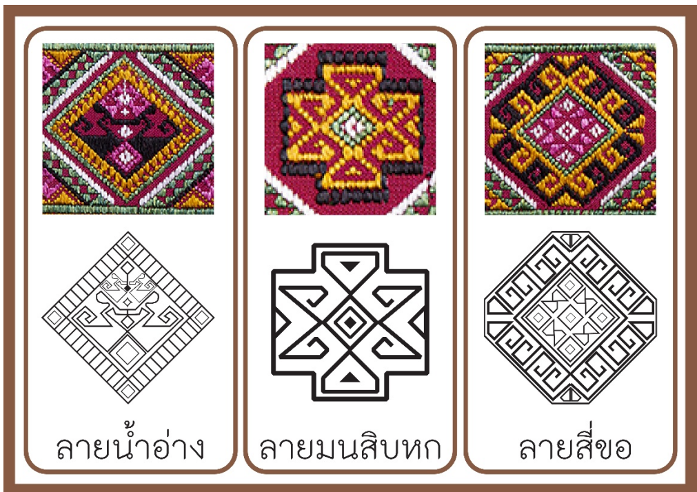
ภาพที่ 1 ลวดลายที่เป็นอัตลักษณ์ได้แก่ ลายน้ำอ่าง ลายมนสิบทก และลายสี่ขอ

ด้านโทนสี นิยมใช้สีจากธรรมชาติเป็นหลัก เช่น สีแดง คราม เหลือง น้ำตาล และครีม ซึ่งมีความหมายเชื่อมโยงกับความเชื่อและเอกลักษณ์ของท้องถิ่น