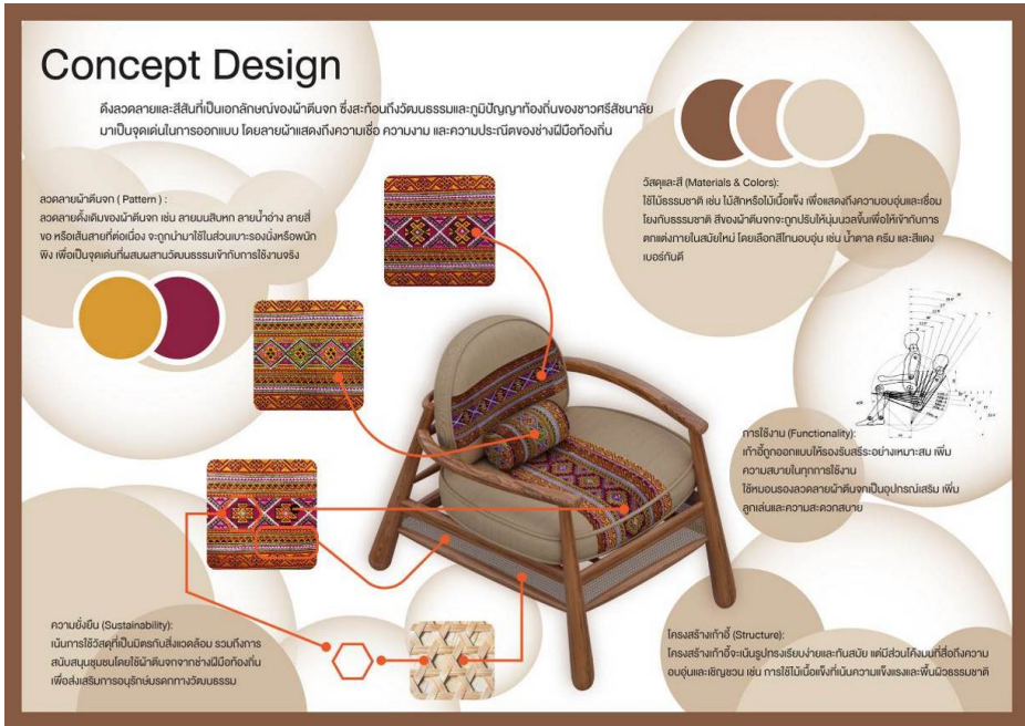
ภาพที่ 4 แนวความคิดในการออกแบบจากอัตลักษณ์ผ้าตีนจก