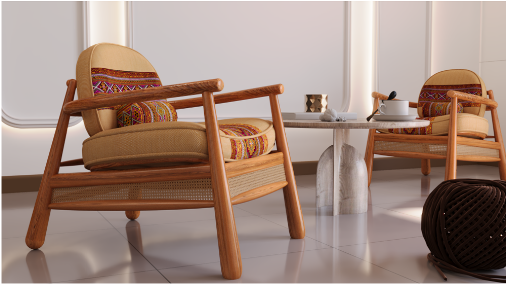
ภาพที่ 6 ภาพจำลองการใช้งานเก้าอี้พักผ่อนที่ออกแบบพัฒนาขึ้นใหม่ 1