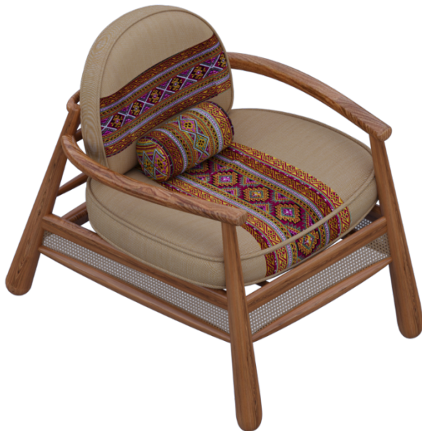
ภาพที่ 5 ต้นแบบเก้าอี้พักผ่อนจากอัตลักษณ์ผ้าตีนจกอำเภอศรีษะนาลัย จังหวัดสุโขทัย