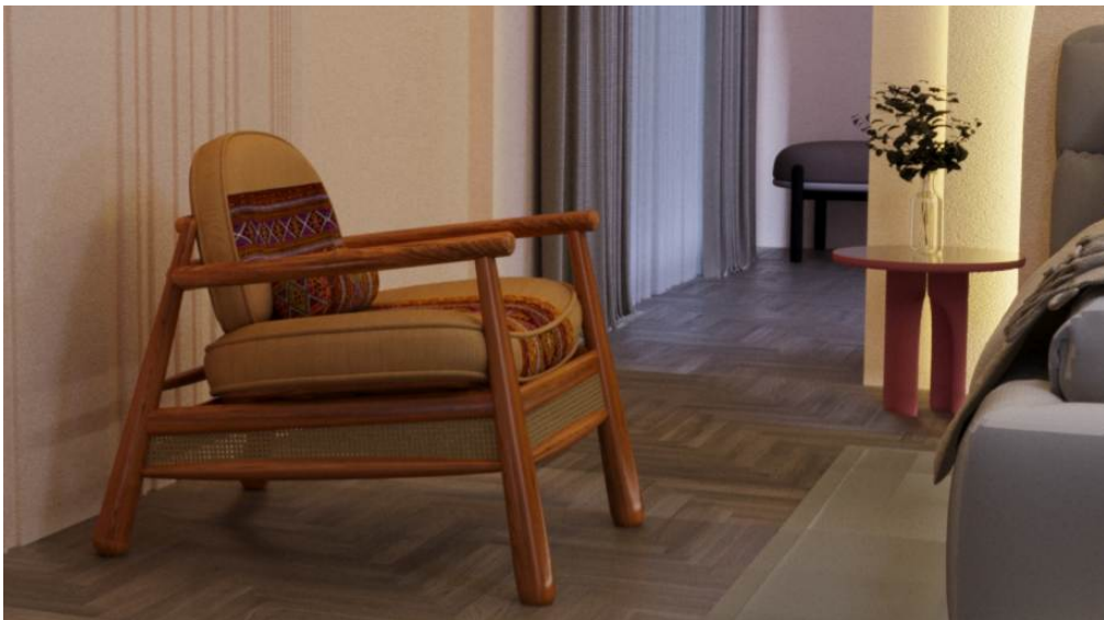
ภาพที่ 7 ภาพจำลองการใช้งานเก้าอี้พักผ่อนที่ออกแบบพัฒนาขึ้นใหม่ 2